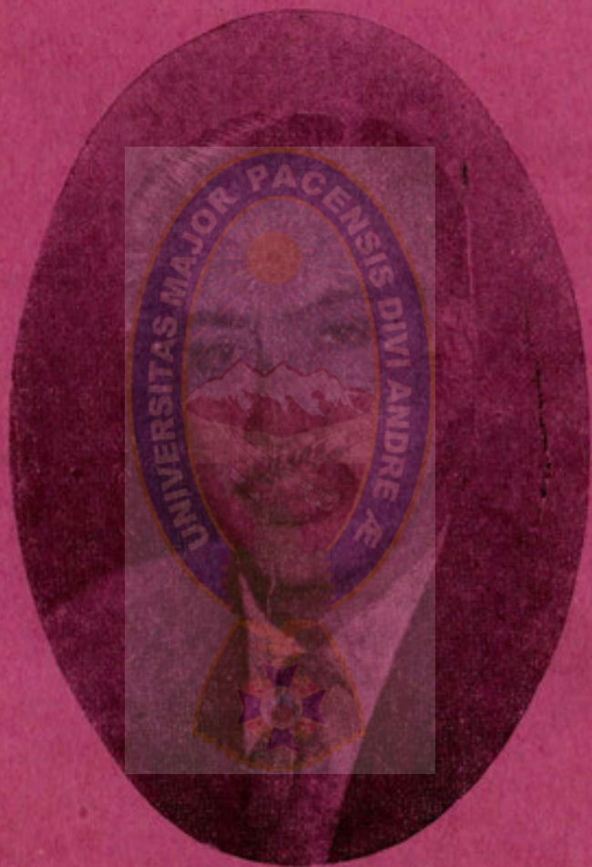
Sr. JUAN LECHIN OQUENDO