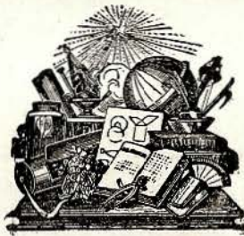
TABLA DE LAS MATERIAS CONTENIDAS EN EL EXAMEN QUE PRESENTAN LOS ALUMNOS DE LA CLASE DEL PRIMER AÑO DE LA FACULTAD DE DERECHO DE ESTA UNIVERSIDAD.