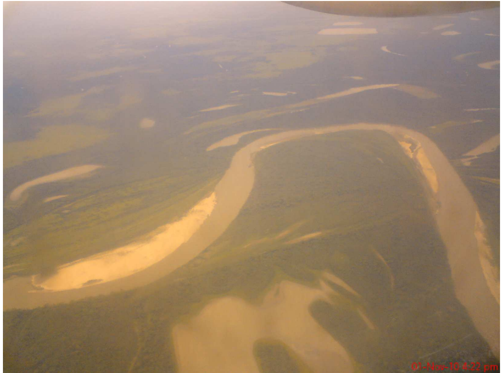
Desborde de Ríos lo más común en comunidades cercanas a las orillas.