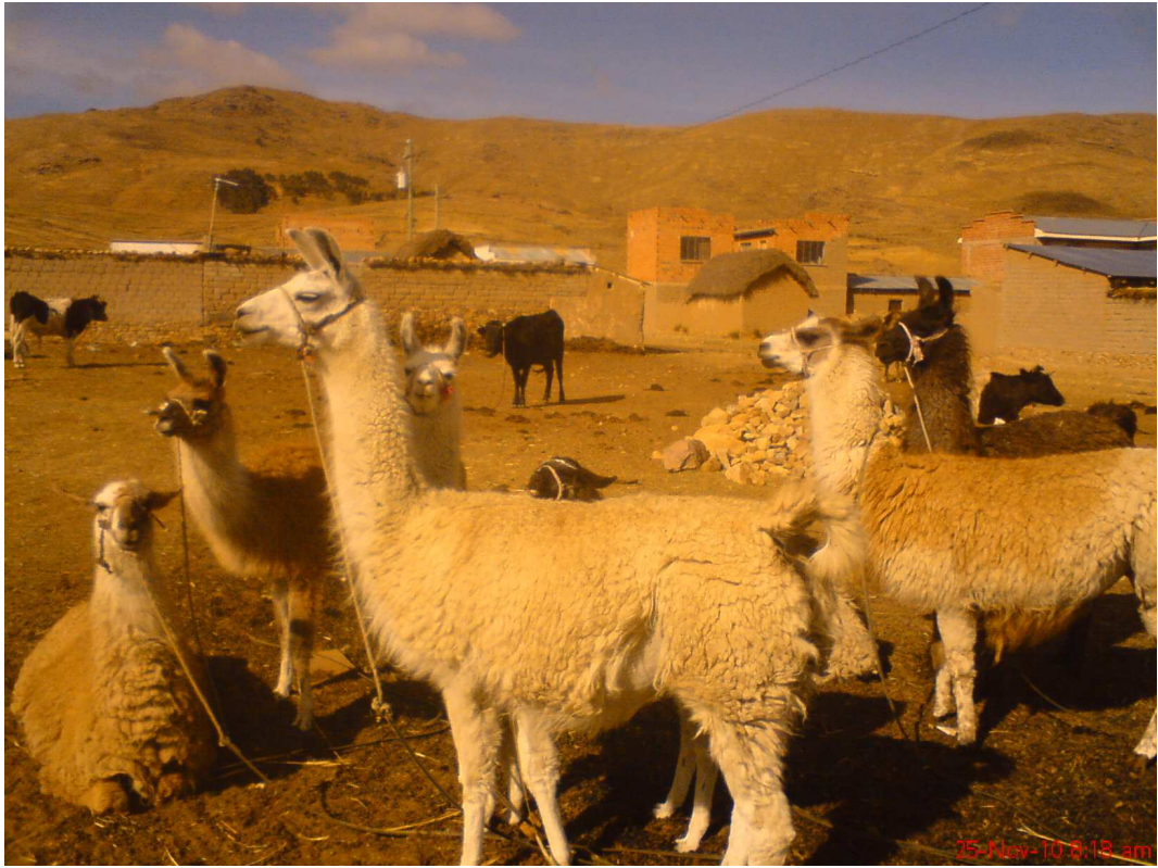
Se ve la Gran Diferencia de Tierras la tierra occidental siempre árida para el cultivo