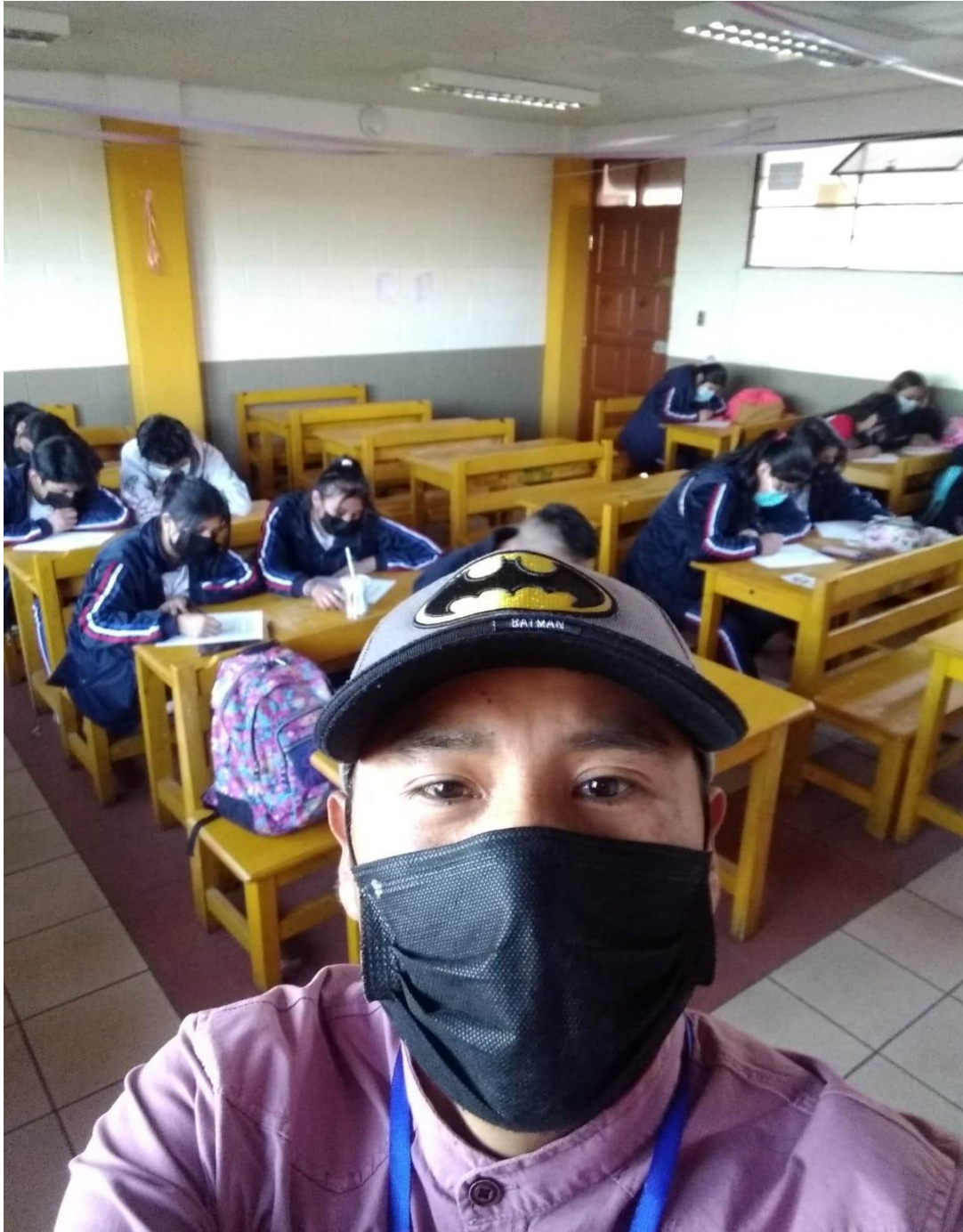
El investigador en una clase