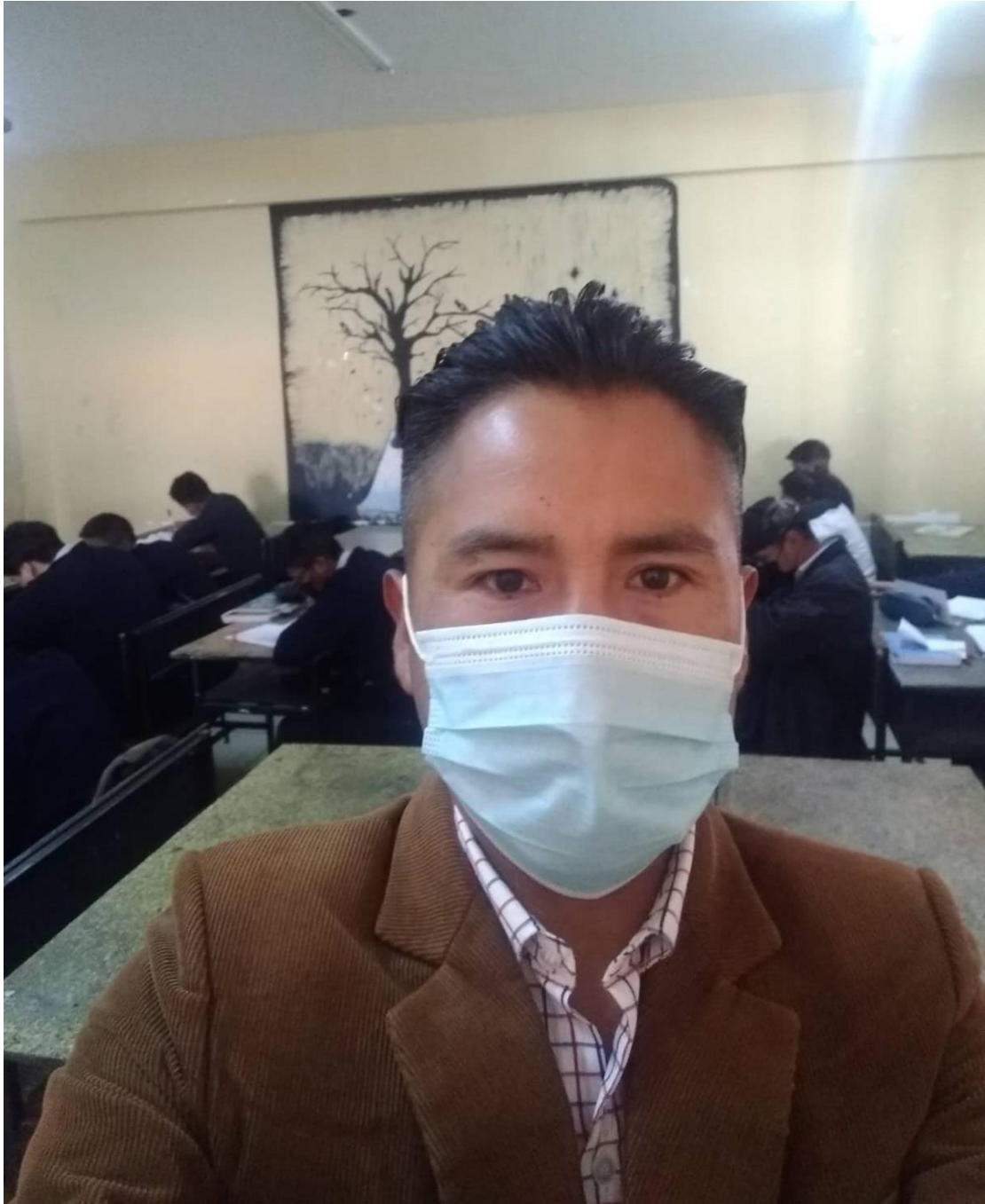
El investigador en otro momento en el aula y los estudiantes