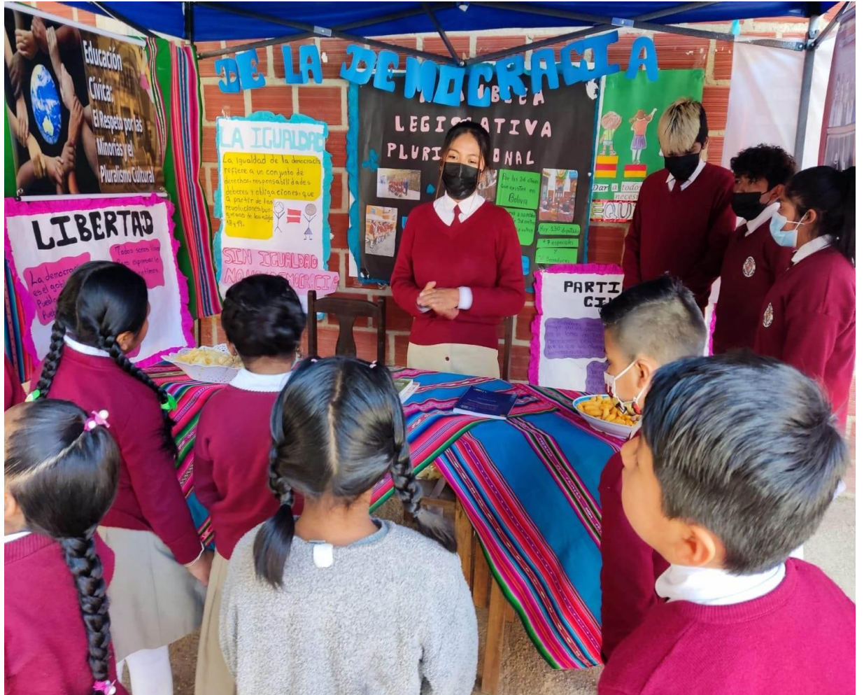
Los estudiantes exponiendo los valores democráticos