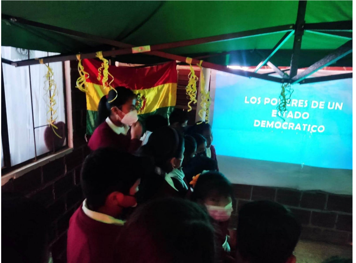
Los estudiantes en otro momento de su exposición, sobre los valores democrático