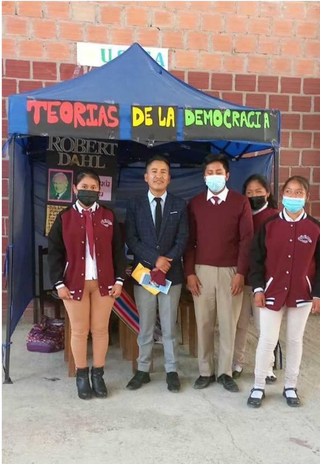
El investigador con los estudiantes en la feria democrática