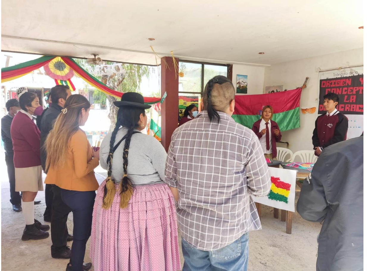
Los Padres de familia y estudiantes, participando de la exposición sobre los valores democráticos