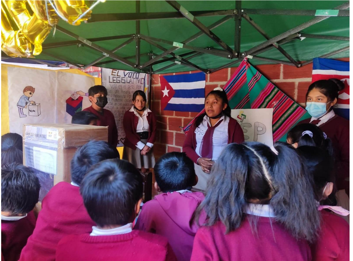
Los estudiantes exponiendo a sus compañeros los valores democráticos