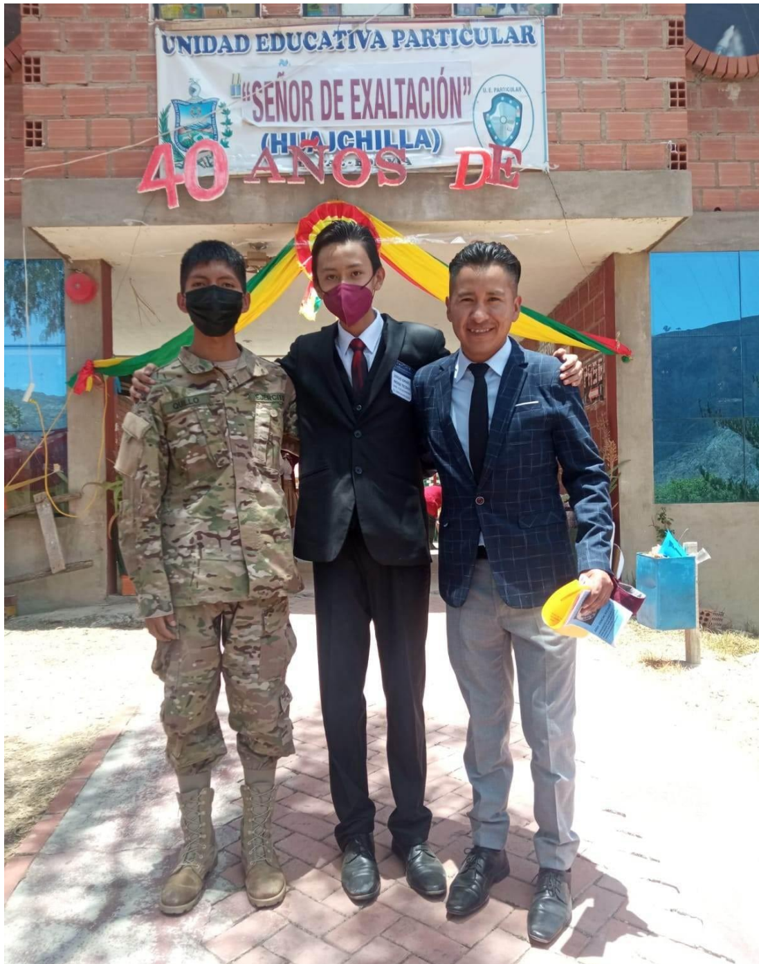
El investigador con dos estudiantes de la promoción