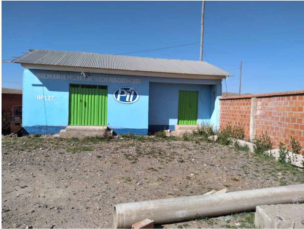
Acopio de Leche Pil – Principal Actividad Económica