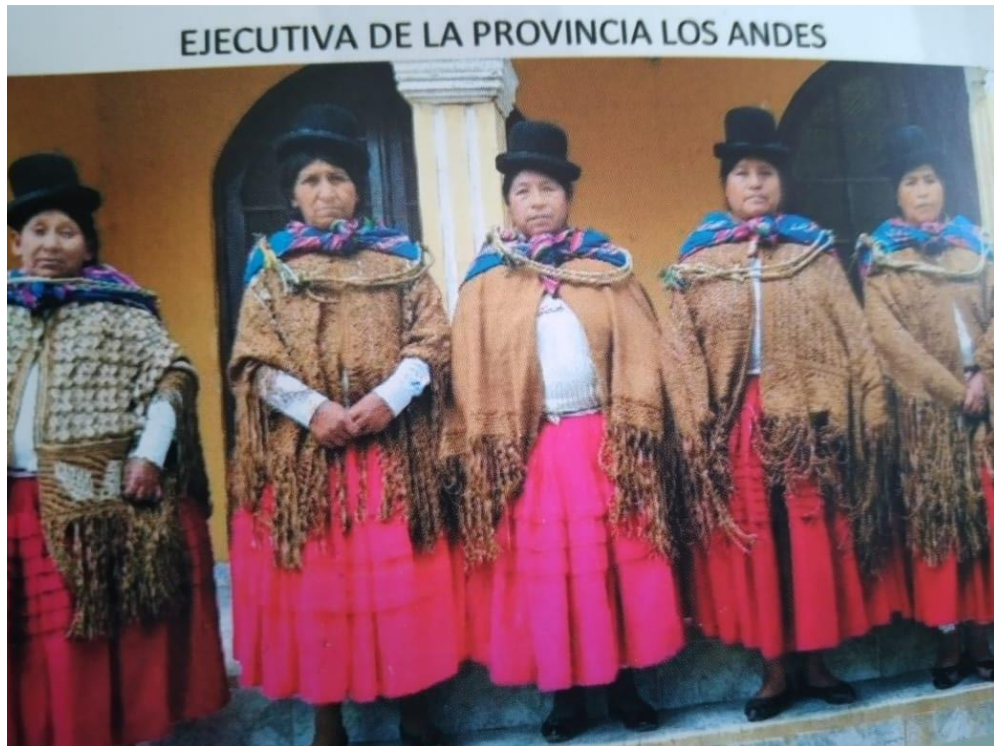
Autoridades Originarias Bartolina Sisa