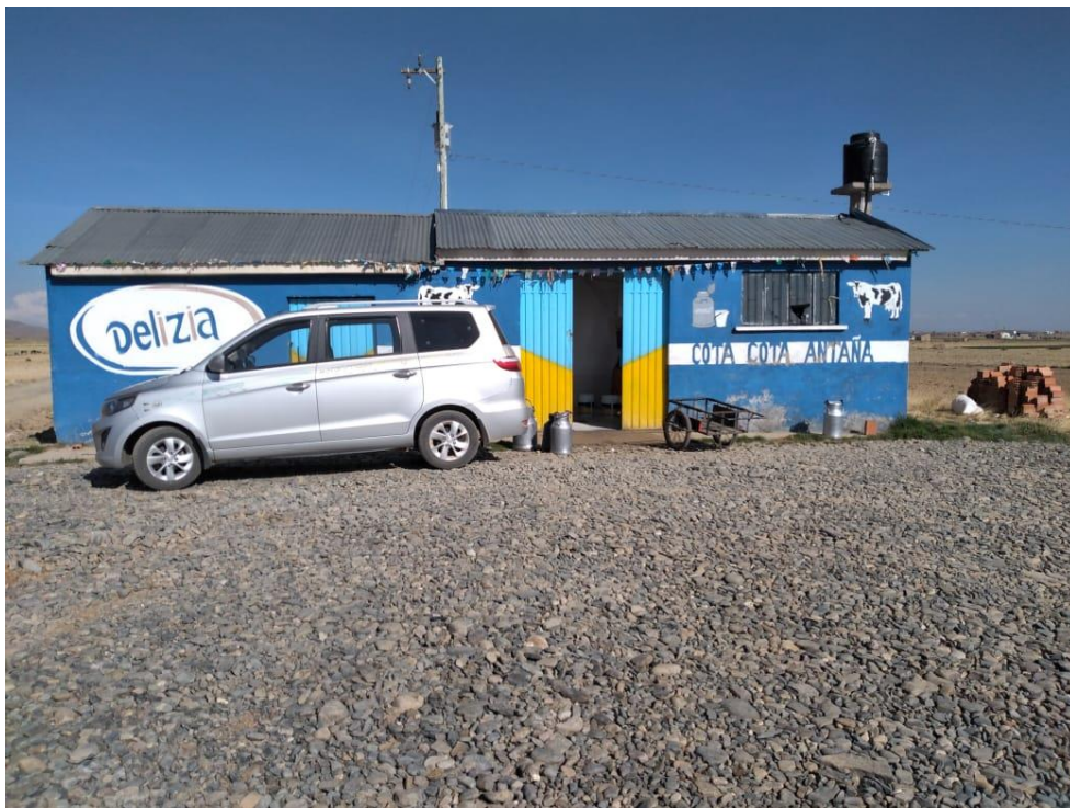
Acopio de Leche Delizia