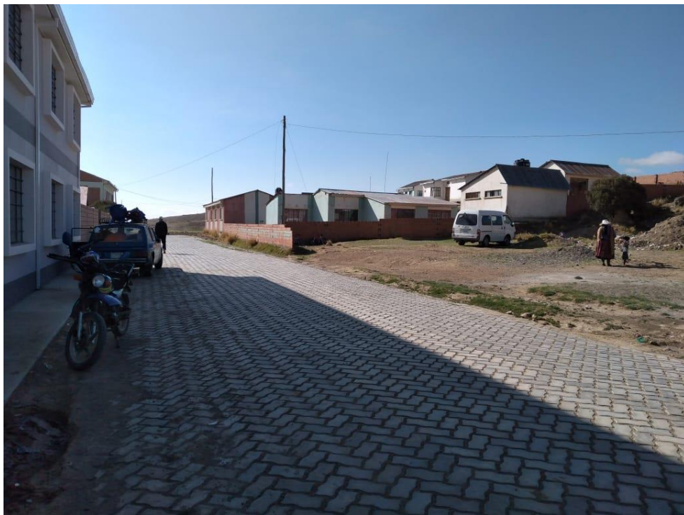
Sede Social de la Comunidad Cota Cota