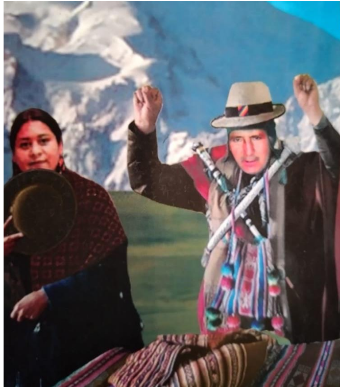
Toma de Juramento de Autoridades JIOC