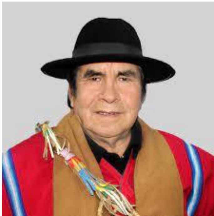
Felipe Quispe "El Mallku" Referente de la JIOC