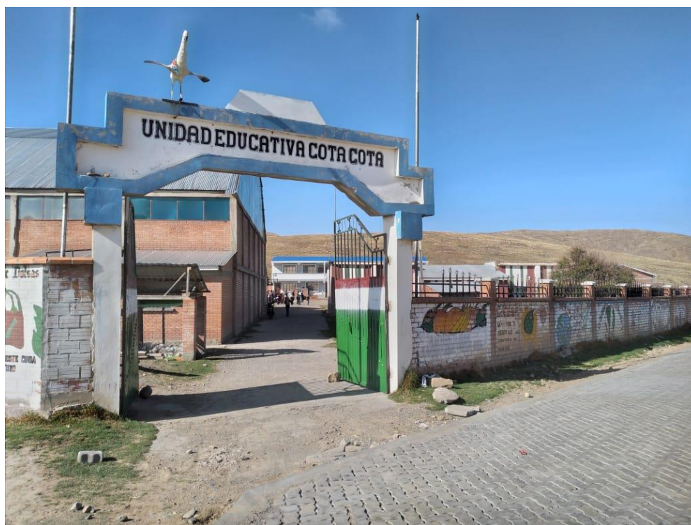
Colegio Técnico Humanístico Cota Cota