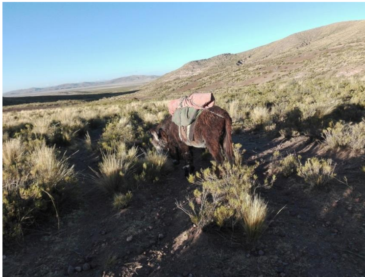
TRANSPORTE PARA LA CARGA DE BULTOS