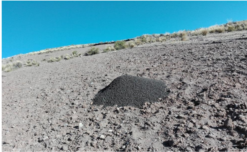
ABONO ORGANICO PARA LA SIEMBRA DE PAPA