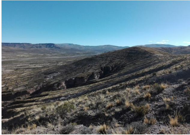
AYNOQA JANKOCHULLPA