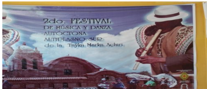
FOTO 6 MARCA ACHIRI

Con la creación de la provincia Pacajes mediante la ley de 29 de marzo de 1826, y elevación al rango de Cantón, al pueblo de Achiri, en forma oficial y legal llamado Cantón Achiri se creó con sus tres comunidades grandes Laura, Collana, Ninoca en total estaba conformada por setenta y dos micro comunidades.