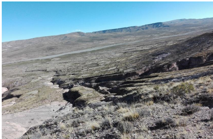
AYNOQA TURI TURINI