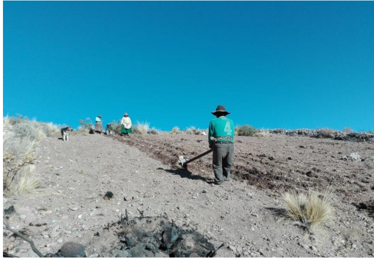
PARCELA CHAÑOQAWI “FAMILIA HUISA”