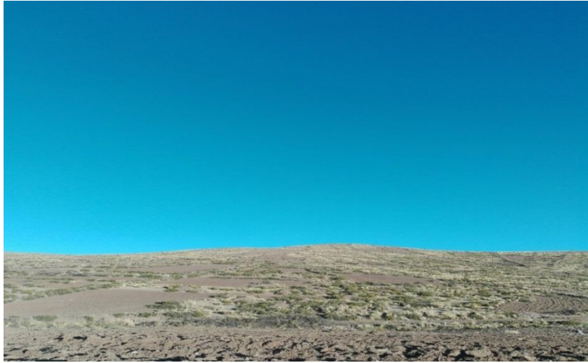
PARCELAS DE AYNOQA QUE SERAN SEMBRADAS