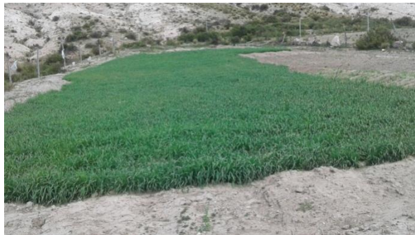
FOTO 5 CEBADA DE AYNOQA