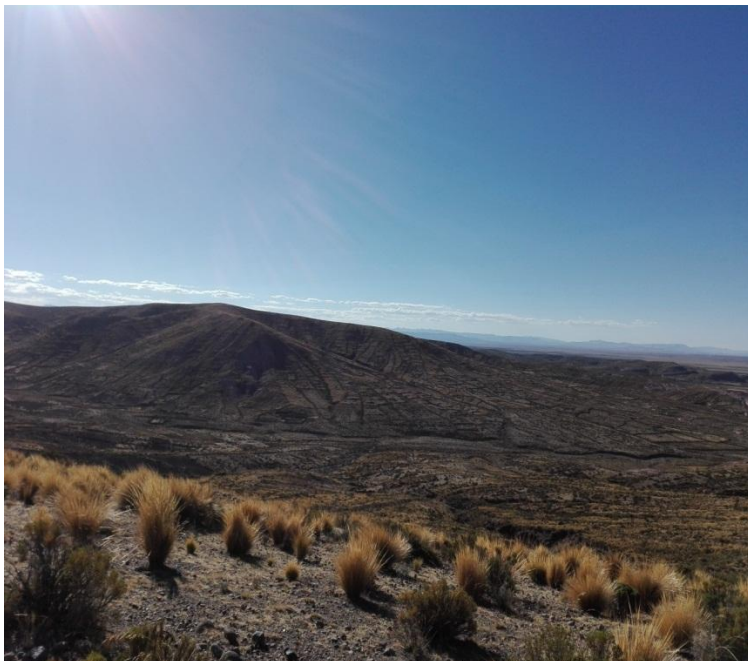
AYNOQA TITIJINCHU