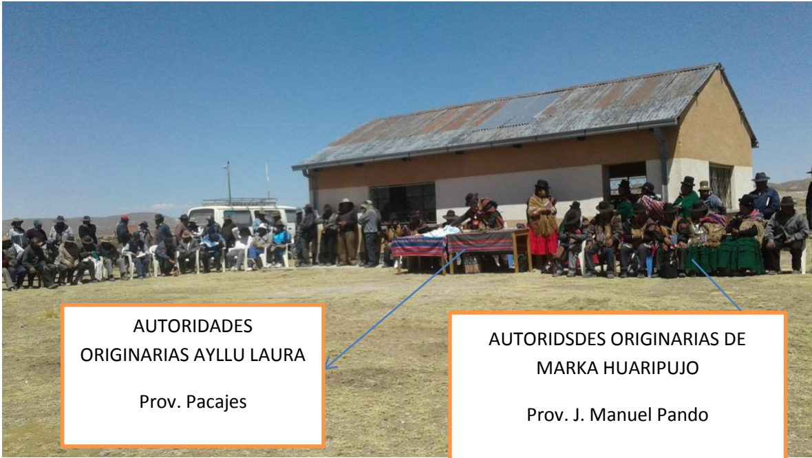
Asamblea General de Ayllu Laura y Marka Huaripujo