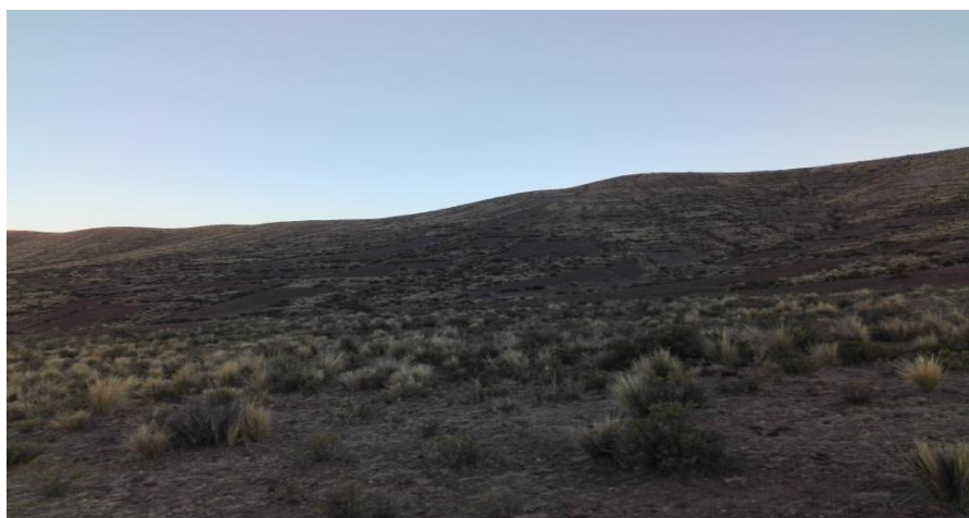
FOTO 1 CERRO DE AYNOQA KALLPAS DE AYLLU LAURA

Así mismo las parcelas de Aynoqa (kallpas) se encuentran en disputa ya que la población de Huaripujo utiliza estas parcelas para su producción agrícola donde esta situación dificulta a las autoridades originarias a realizar la resolución del problema.