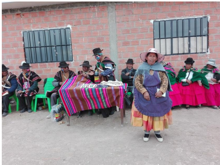
ASAMBLEA GENERAL DE AYLLU LAURA