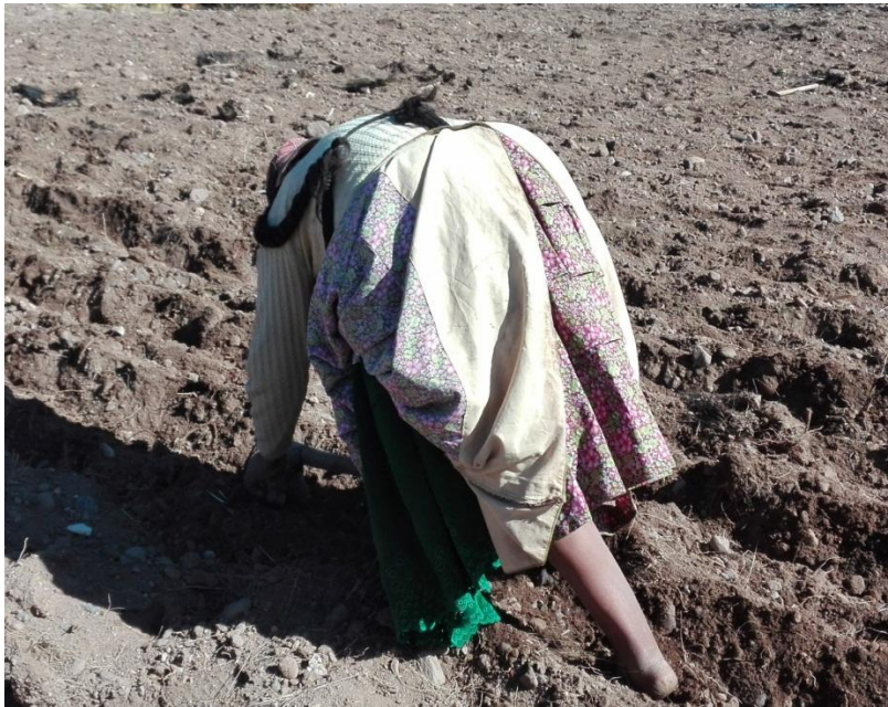
SIEMBRA EN PARCELA DE AYNQQA CHAÑOQAWI