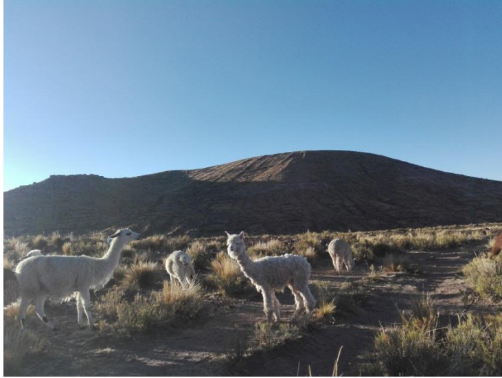
LA GANADERIA EN LAS PARCELAS DE AYNQQA