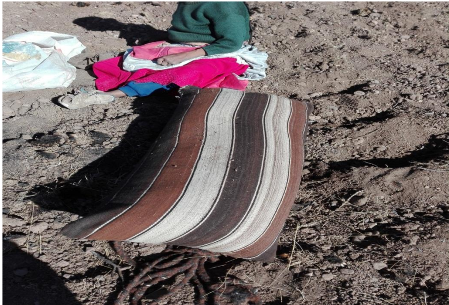
SEMILLA DE PAPA PARA SEMBRAR