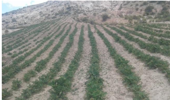
FOTO 4 CHACRA DE AYNOQA