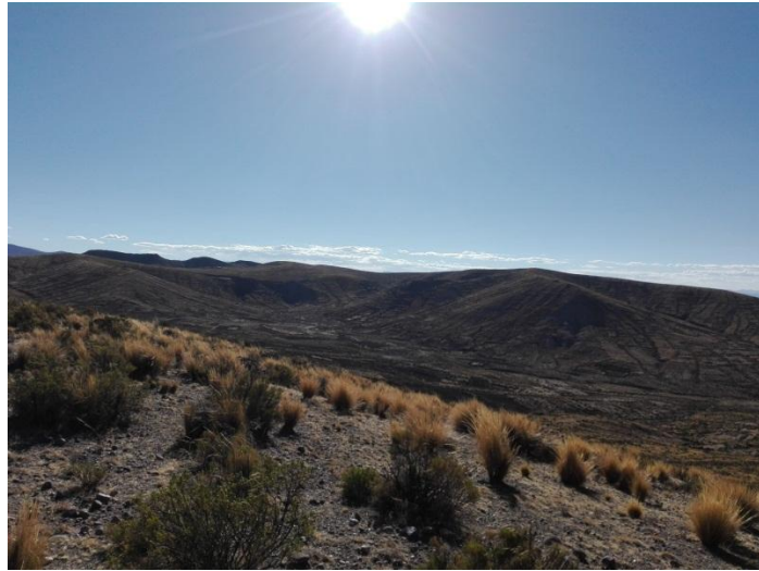
AYNOQA CHAÑOKAWI