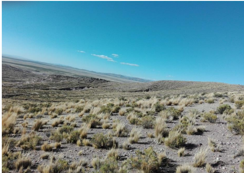
AYNOQA KUTINIW