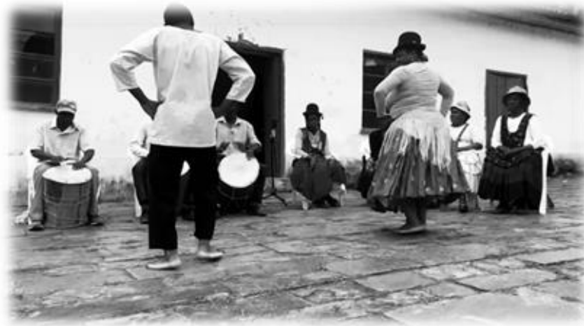
Ilustración 9 Zemba