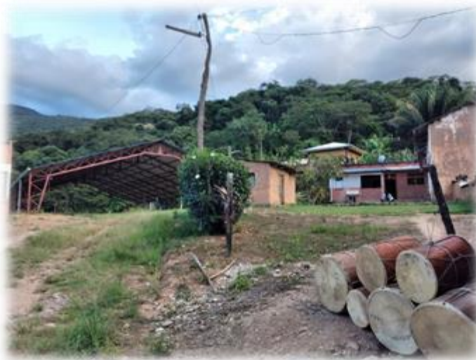
Ilustración 10 Chijchipa