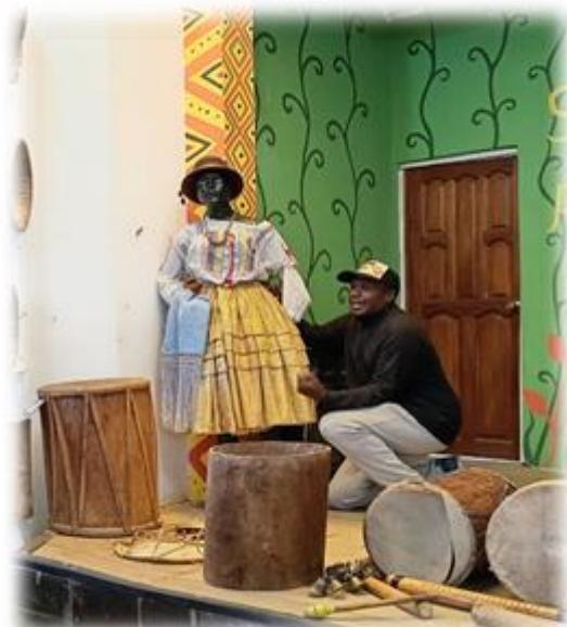
Ilustración 21 Explicación dentro del museo