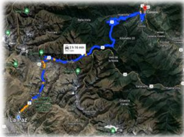
Ilustración 1 Coroico

Ruta establecida desde la terminal Minasa de la ciudad de La paz, hacia la plaza principal "Manuel Victorio Gracia Lanza", Municipio de Coroico.