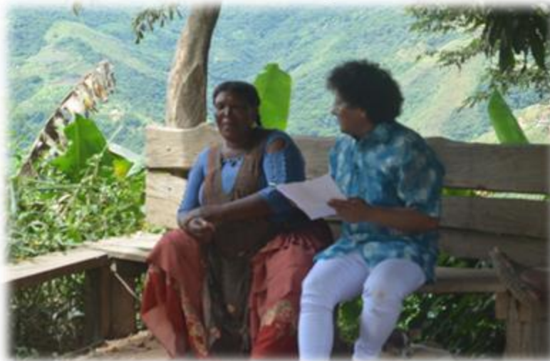
Ph. Noelia Romero Arroyo