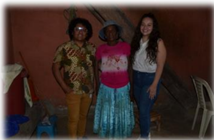
Ilustración 22 Tía Sofía, Chijchipa