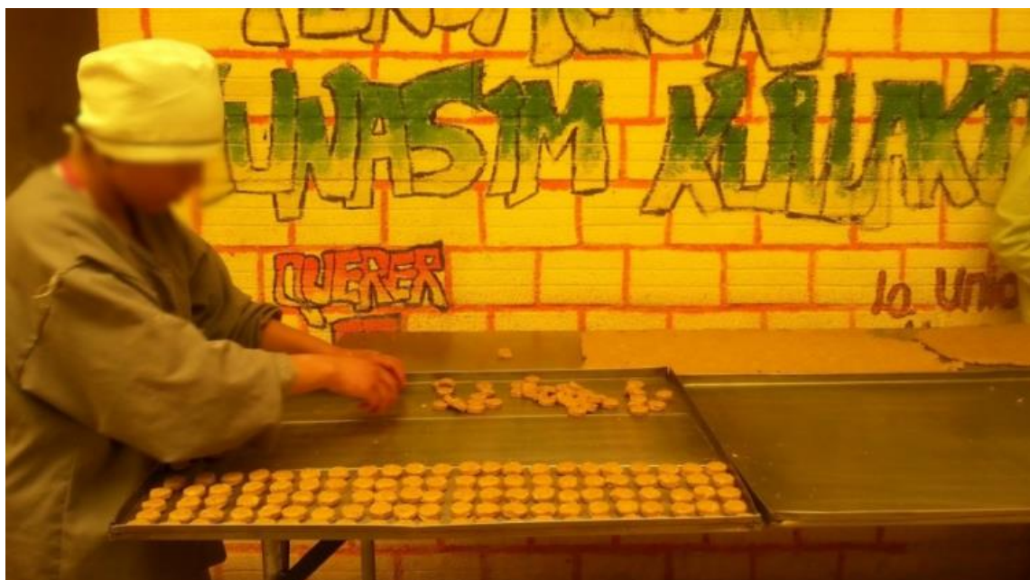
Jovencita rescatada realizando galletas en el taller de panadería. (Lemus, 2018)