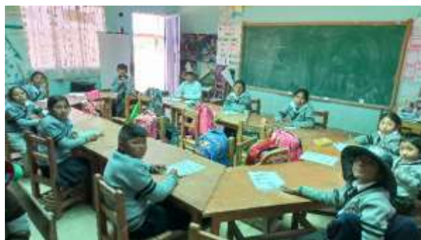
Organización de los grupos focales