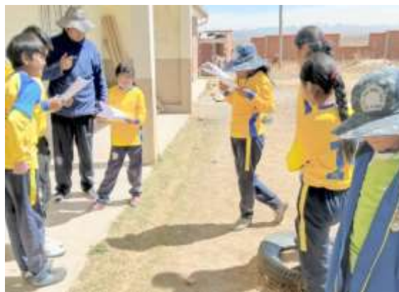
Expresando los diálogos para la grabación