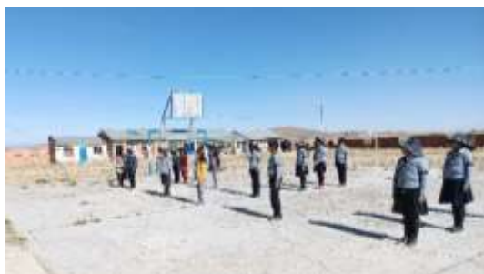
Estudiantes en formación