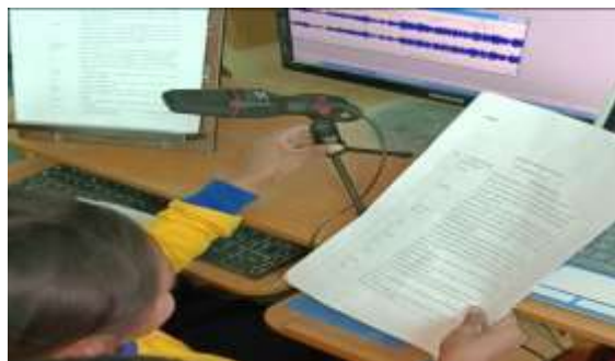
Grabando la voz en off para después editar los radio cuentos