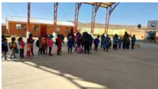
Unidad Educativa Humberto Portocarrero