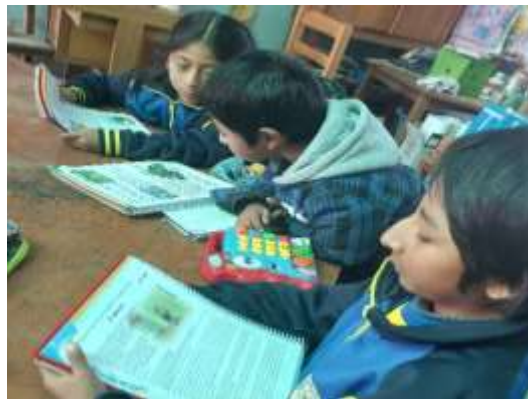
Buscando cuentos en los libros de apoyo