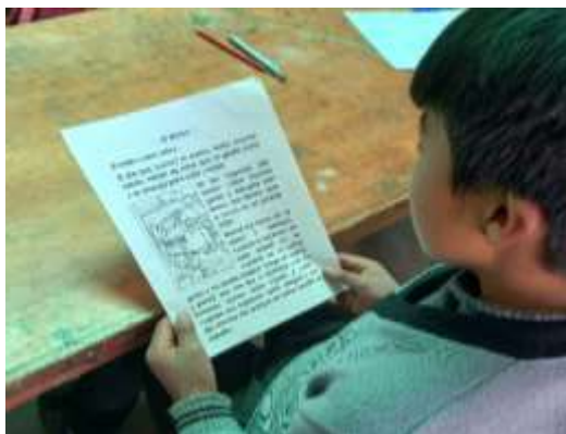
Realizando lecturas de cuentos