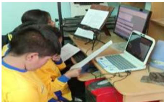
Grupos en el proceso de grabación