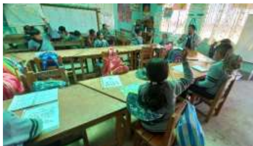
Debate sobre la importancia de la lectura comprensiva con participación activa de los estudiantes