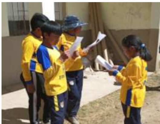
Practicando la lectura de libretos