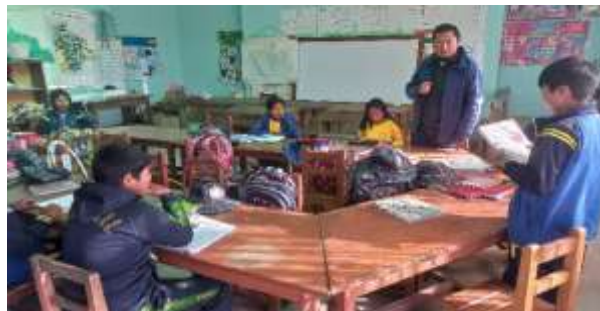
Diagnóstico de lectura comprensiva