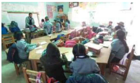
Presentación del moderador y los estudiantes