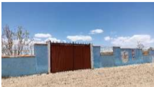
Puerta principal de la Unidad Educativa José Miguel Lanza