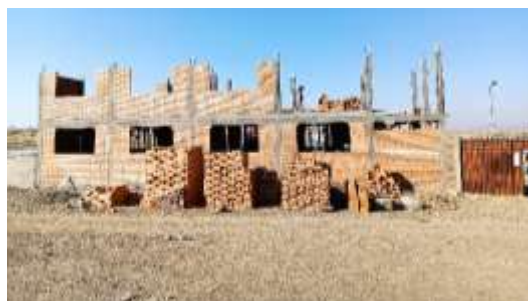
Unida Educativa Ancocala