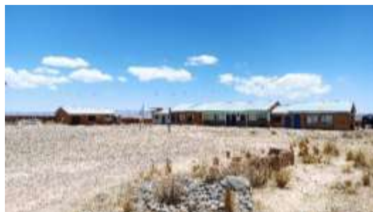
Infraestructura y ambientes de la Unidad Educativa