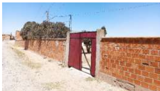
Unida Educativa Pallina Laja