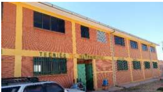
Núcleo Educativo Pallina Laja Técnico Humanístico Julián Apaza