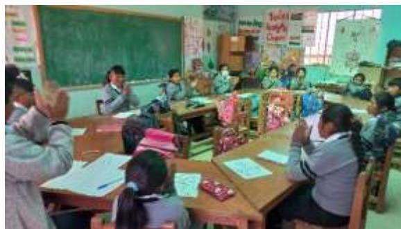
Dinámicas de motivación