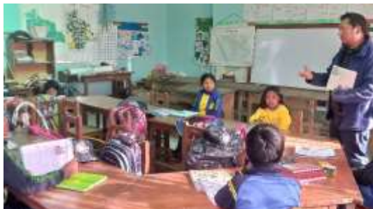
Visita a la Unidad Educativa para la intervención