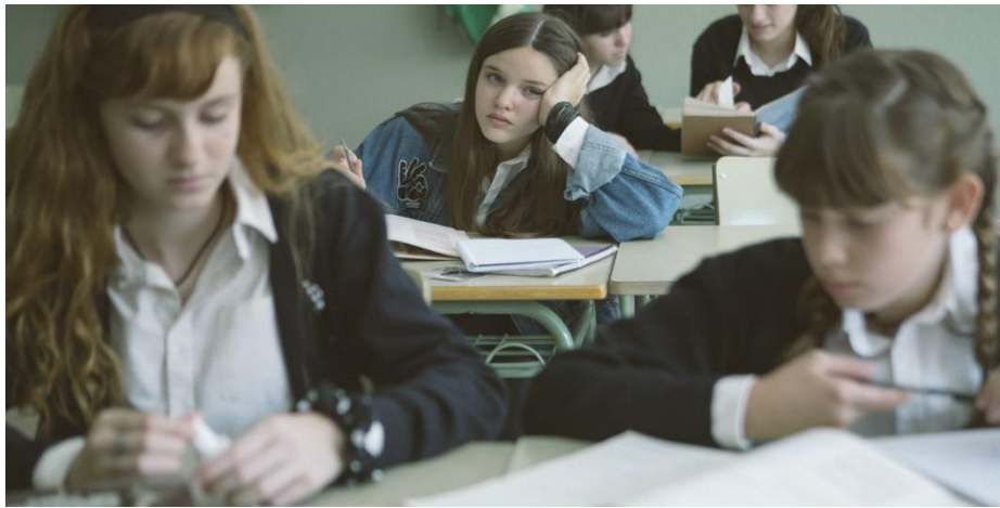
Palomero, P.(Directora), Cajías, D (Fotógrafa). (2020). Las niñas [Captura-Película]. España, Inicia Films, BTeam Pictures, TVE, Movistar+, Aragón TV