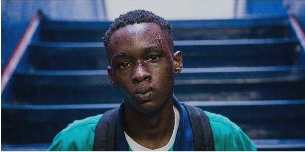
Jenkins, B.(Director), Laxton, J (Fotógrafo). (2016). Moonlight [Captura-Película]. Estados Unidos, A24, PASTEL Production, Plan B Entertainment.