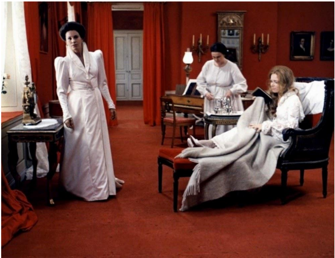
Bergman, I. (Director), Nykvist, S. (Fotógrafo), 1972. Viskningar och rop [Captura-Película]. Suecia, Svenska Filminstitutet, Cinematograph AB.