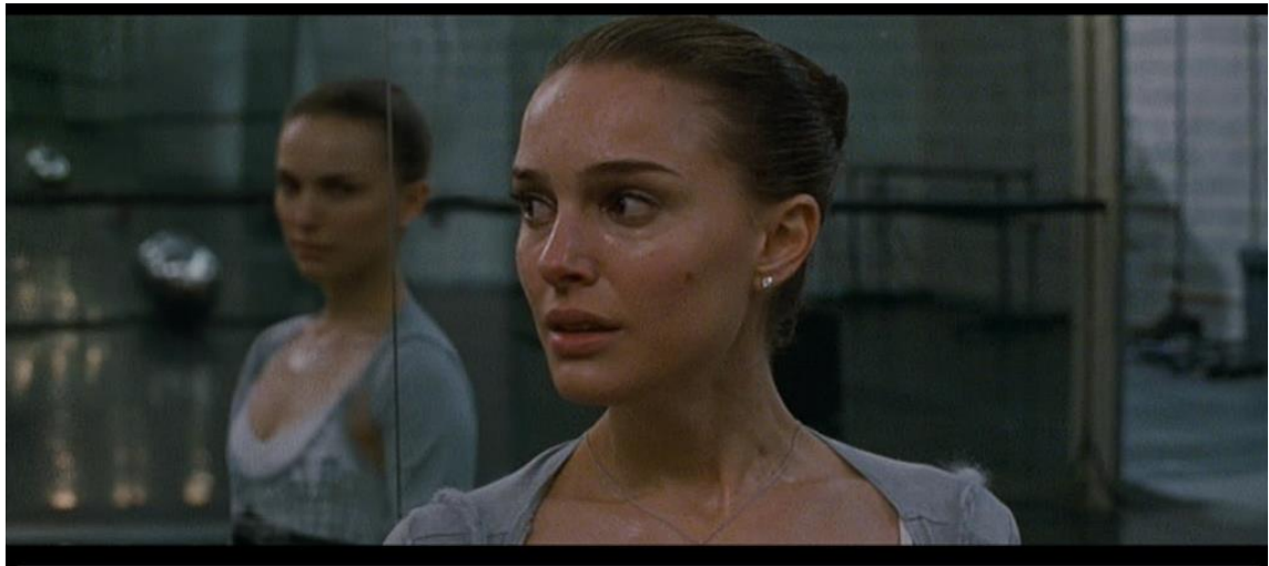
Aronofsky, D.(Director), Libatique, M.(Fotógrafo) (2010). Black Swan [Captura-Película]. Estados Unidos, Fox Searchlight Pictures, Phoenix Pictures.