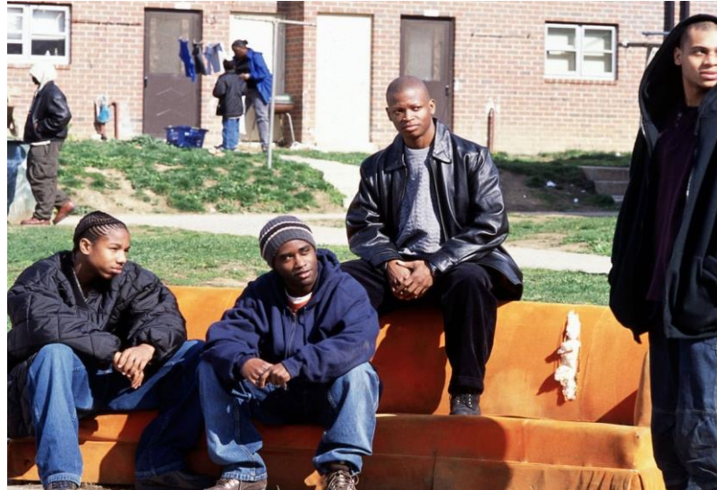
Simon, D., Briesewitz, U.(Productores), (2002-2008) The Wire [Captura-Serie de Televisión]: HBO.