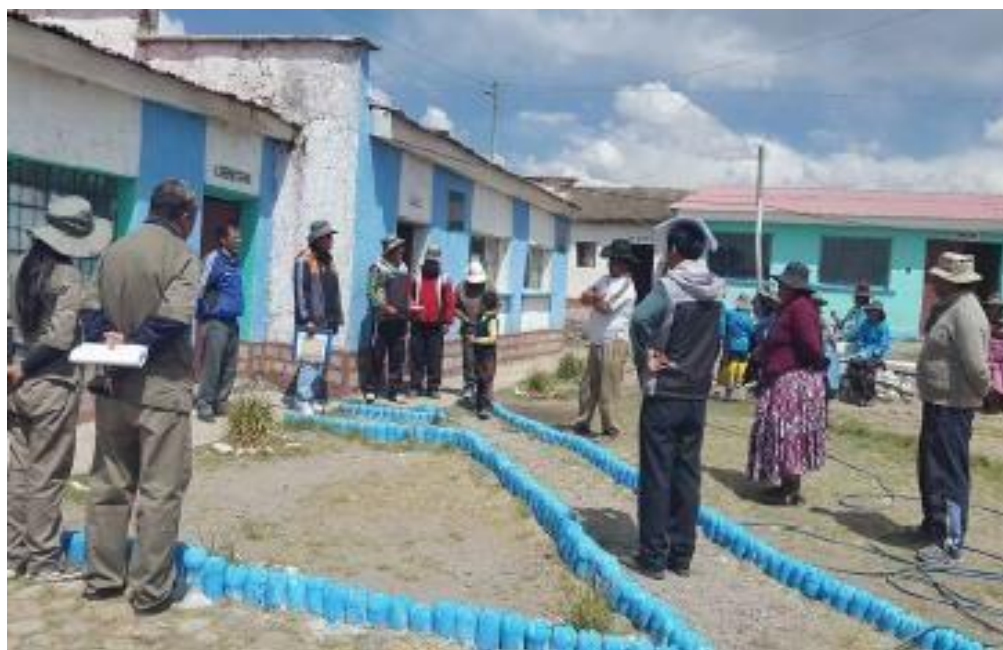
Actores educativos, trabajando en la organizando de espacios saludables y acogedores en la U.E. “3 de Mayo A”