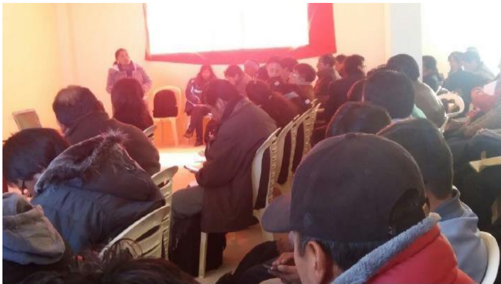
Directora de U.E. “3 de Mayo A” realizando la reunión de análisis y reflexión con los actores educativo al finalizar el trimestre de la gestión escolar