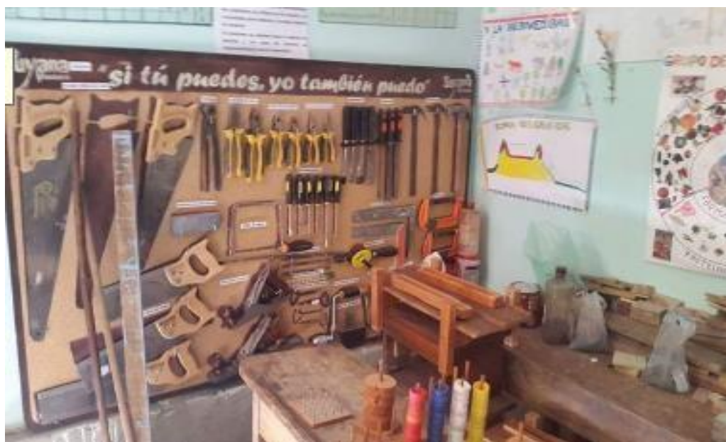
Taller del área técnica tecnológica organizada para los estudiantes realicen trabajos de manera práctica.