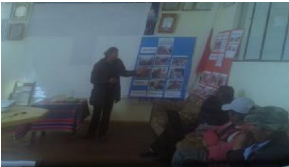
Docente de 6to. A de la U.E. “3 de Mayo A”, realizando el intercambio de experiencias pedagógica frente a los maestros