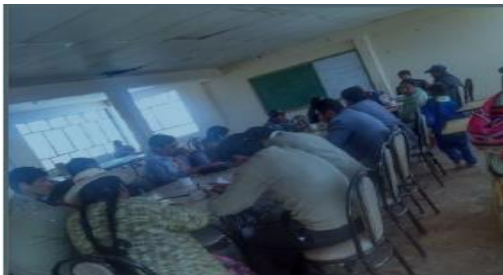
Docentes analizando junto a los representantes de padres de familia de los cursos las dificultades y logros del proceso enseñanza aprendizaje al finalizar el trimestre