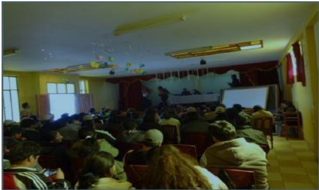
Reunión taller de fortalecimiento dirigido a docentes de la unidad educativa “3 de Myo A”