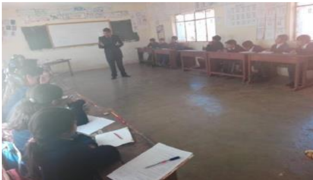
Docente de 3ro. A de la U.E. “3 DE Mayo A” desarrollando clase abierta frente a los jurados