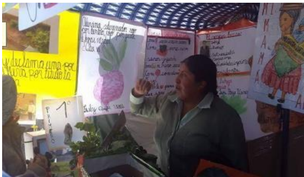
Docente de 5to. A de la U.E. “3 de Mayo A” realizando la clase pública en la plaza principal de la urbanización “3 de Mayo”