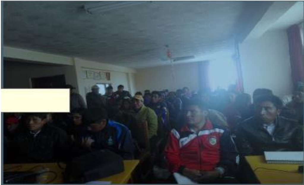
Reunión de coordinación, planificación y organización de la gestión educativa como gestora y/o directora de unidad educativa luego de haber ganado el concurso de méritos