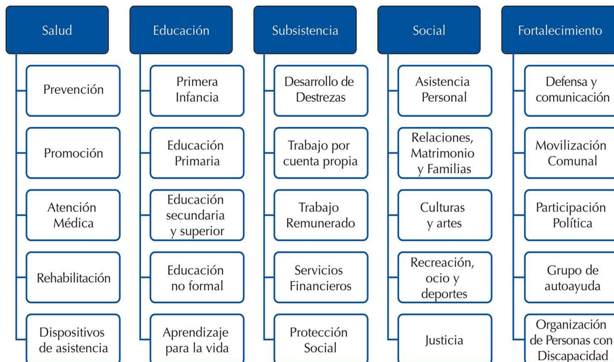
Matriz de Rehabilitación Basada en la Comunidad