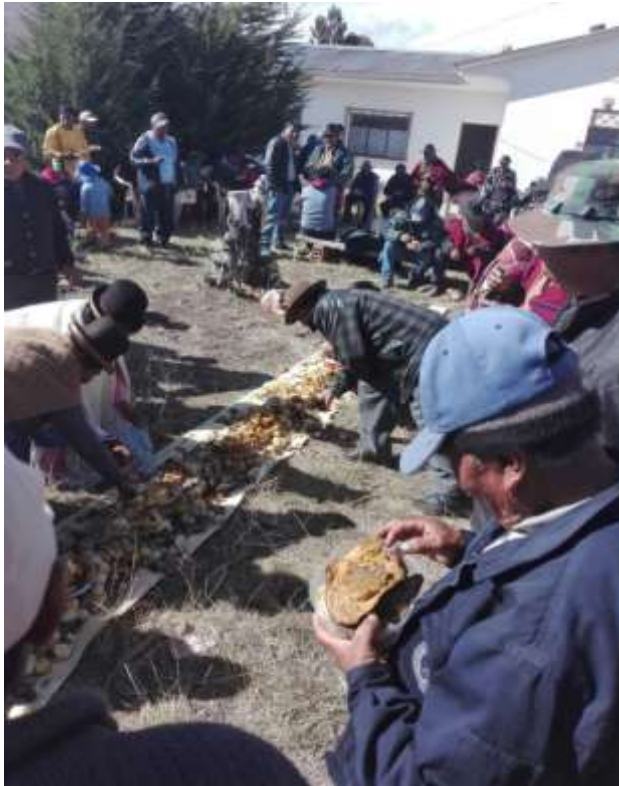
Foto No 11 Comunidad organizadora compartiendo un apthapi

organizadora de Villa Molino, Tilacoca desde 1992 hasta 2023 siempre está ubicado a una esquina de la cancha de fútbol, al lado este del campo deportivo lo cual es su lugar de concentración que es considerado un lugar simbólico de muchas victorias y pérdidas para el equipo. De la misma manera otras comunidades tienen su espacio cuando organizan en otras comunidades del campeonato de Primero de Mayo. En el espacio la autoridad deportiva tiene su preparativo según los usos y costumbres de cada comunidad.