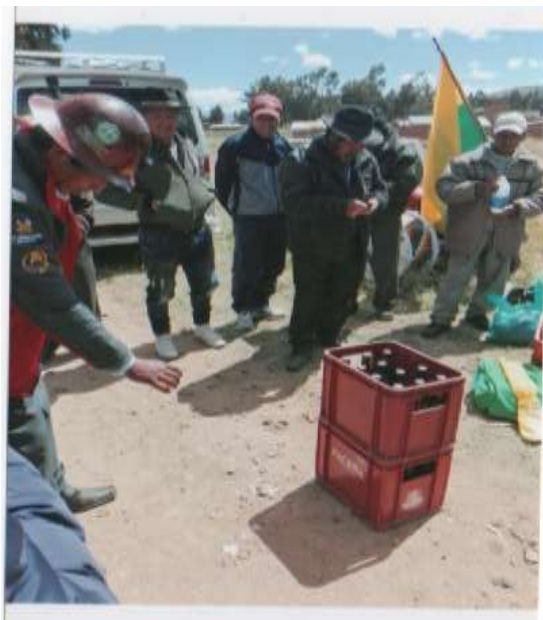
FOTO No 15 Dirigente de cooperativa challando para la comunidad y entregando cerveza.