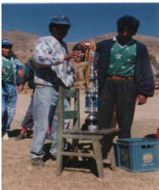
FOTO No 16 Deportistas de la comunidad con el trofeo y una caja de cerveza 1993