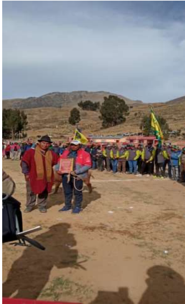
FOTO No 33 Reconocimiento entregado por la máxima autoridad