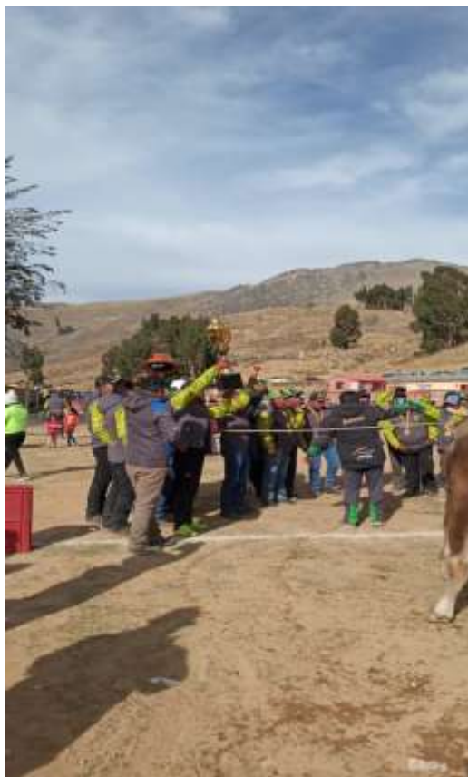
Foto No 9 Cooperativa festejando el primer lugar como símbolo levanta el casco del minero

La cooperativa minera Matilde es un equipo seleccionado, que participa en el campeonato departamental de cooperativas mineras, que se lleva año tras año. En los centros mineros, los trabajadores están en constante actividad deportiva entre todo el grupo, por obligatoriedad de la directiva.