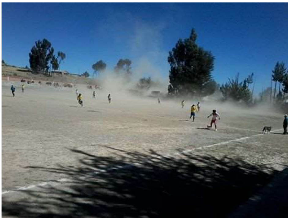
Foto No 1 Jugadores en el desenlace del campeonato en temporada de viento.