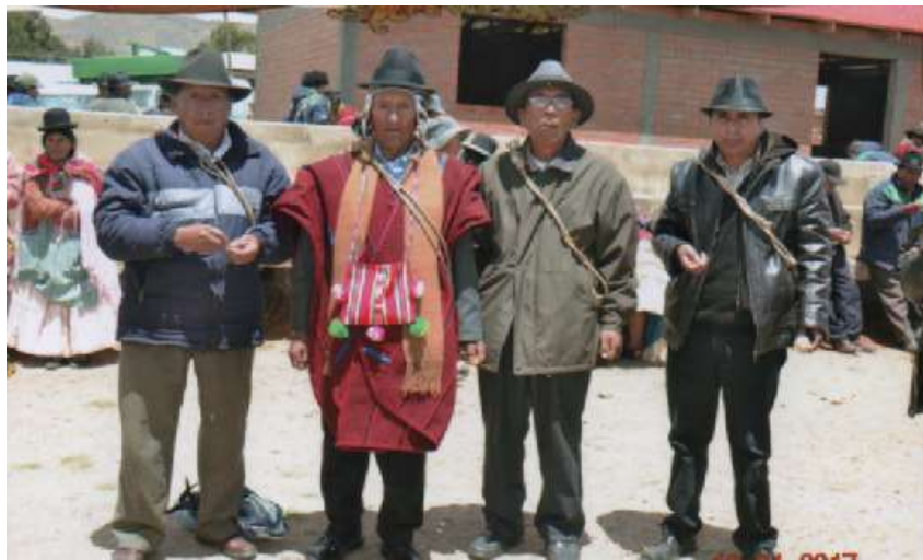
Foto No 7 Autoridades con el chicote en el día del campeonato y el secretario general puesto el poncho y chuspa.

Los domingos, días de fútbol, las autoridades de la comunidad organizadora siempre están presentes toda la directiva más que todo el secretario general, por ser la máxima autoridad. Tiene una responsabilidad de cuidar el bienestar de sus habitantes y de todas las comunidades participantes al campeonato. Esta autoridad durante su gestión siempre tiene puesto el chicote, como máximo representante de existir algunos problemas afuera de la cancha, la autoridad tiene la potestad de solucionar. Si una autoridad no lleva el chicote puesto, se lo considera como una falta a las costumbres de la comunidad y recibe críticas de los propios comunarios y recibe llamada de atención en una asamblea general.