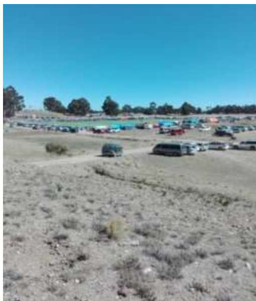
Foto No 2 Cancha sintético en terrenos de la comunidad de Cojata Pampa

Lo que se resalta según todas las autoridades es que se mantiene la forma de rotación u organización del campeonato comunal es decir la comunidad que salga campeón seguirá auspiciando el fútbol en su lugar de origen. La opción solo es para la cooperativa Matilde, que al no tener una cancha propia puede auspiciar en la cancha sintética lo cual es satisfactorio para los equipos.