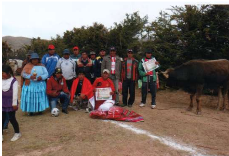
Foto No 10 equipo campeón Villa Molino.

La comunidad ganadora tiene más oportunidades de exigencia hacia el municipio, como por ejemplo, la mejora del campo deportivo que es apoyada, por otras comunidades que participan en el campeonato, se encuentra una solidaridad de apoyo. El municipio es un ente ejecutor de obras, según las demandas de las comunidades lo cual en ocasiones se retrasan años, solamente la ejecución lo realizan cerca a elecciones, como queriendo ganar votos.