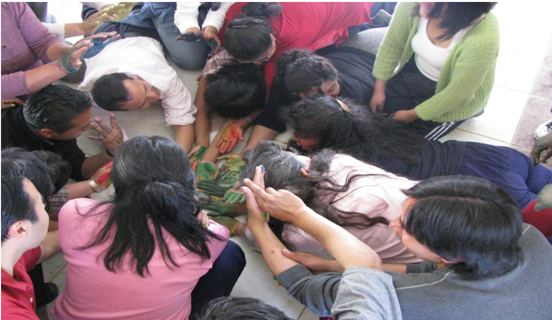
Curso taller en animación sociocultural, Asociación Alemana para la Educación de Adultos, Año 2008.