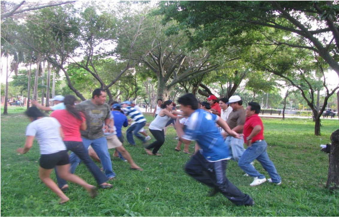
Curso Taller en Animación Sociocultural, Salud familiar intercultural SAFCI, año 2012