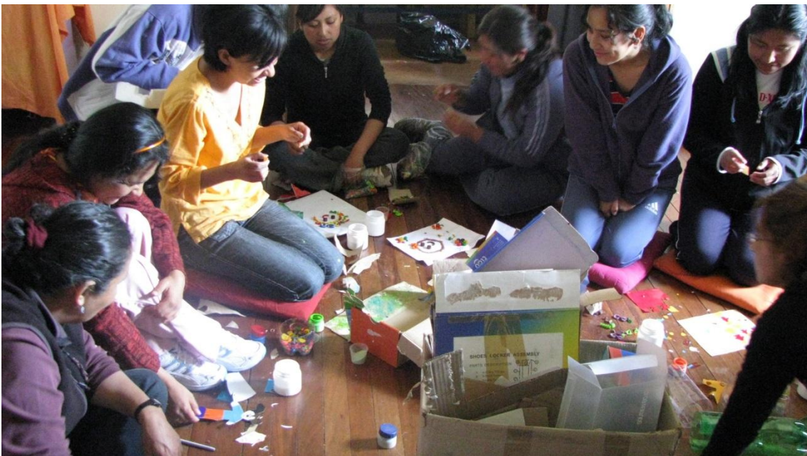
Curso de Formación en Animación Sociocultural, Carrera de Ciencias de la Educación UMSA, año 2011.