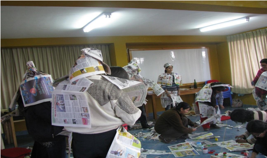
Curso Taller, en animación sociocultural, Fundación Wanapanakusun, Cusco-Perú, año 2011.