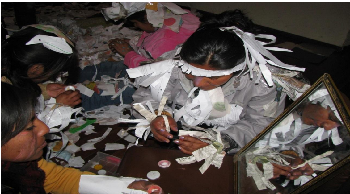
Curso de Formación en Animación Sociocultural, estudiantes de la carrera de ciencias de la educación UMSA, año 2010.