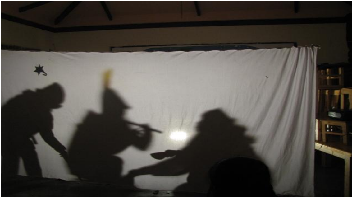
Curso de Formación en Animación Sociocultural, Sociedad Católica San José , Año 2012