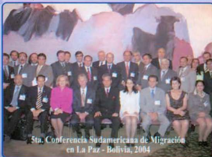
5ta. Conferencia Sudamericana de Migración en La Paz - Bolivia, 2004

(Fuente NNUU Diccionario Demográfico Plurilingüe, NY 1959)