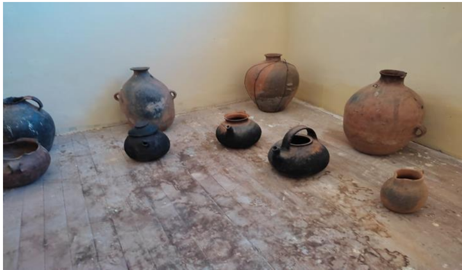
Fotografía: Nro. 8