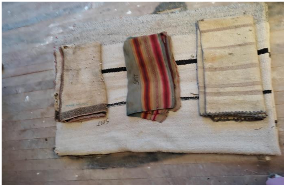
Fotografía: Nro. 9

En el tema de educación para el 10 de septiembre algunos estudiantes de la Unidad Educativa Chojña realizan las investigaciones o entrevistas se acercan a mi persona para saber la historia de Santos Marka T'ula y Manuela Guarachi por ejemplo en la gestión