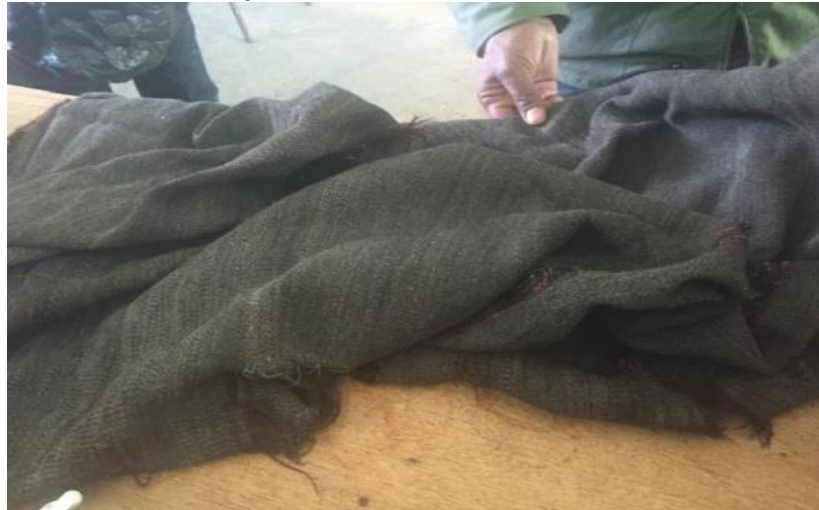
Fotografía: Nro. 3