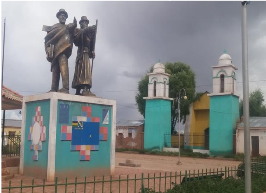
Fotografía: Nro. 5

El monumento de Santos Marka T'ula y Manuela Guarachi. Mi persona como bisnieta he sido gestora del monumento de ambos líderes históricos chacha-warmi, está en su lugar de su nacimiento en el Ayllu Hilata Baja Sub Central Chojña, Municipio San Pedro de Curahuara de la Provincia Gualberto Villarroel departamento de La paz, cada 10 de septiembre lo recordamos su aniversario del nacimiento del líder histórico a la cabeza del ejecutivo provincial en coordinación con Centrales Agrarias, Sub Centrales, Secretarios Generales los tres Gobiernos Municipales y la Unidad Educativa del Lugar de la provincia y con la visita de las autoridades provinciales departamentales y nacionales. En homenaje al líder cada Ayllu se presentan con músicas con festival de tarqueada de acuerdo al contexto las y los participantes de esta actividad demuestran sus talentos de música coreografías de presentación y teatros siempre aguardando nuestra propia cultura originaria con mucha alegría con su ajayu y qamasa del líder histórico.