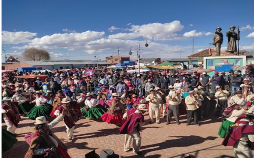
Fotografía: Nro. 6