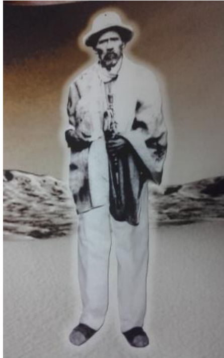
Fotografía: Nro. 2