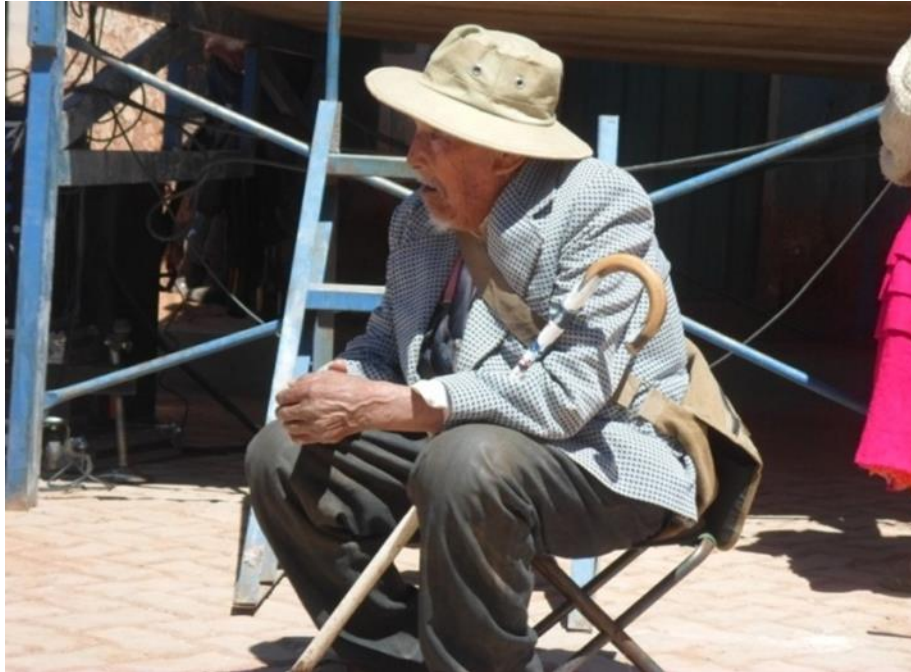
Fotografía: Nro. 3