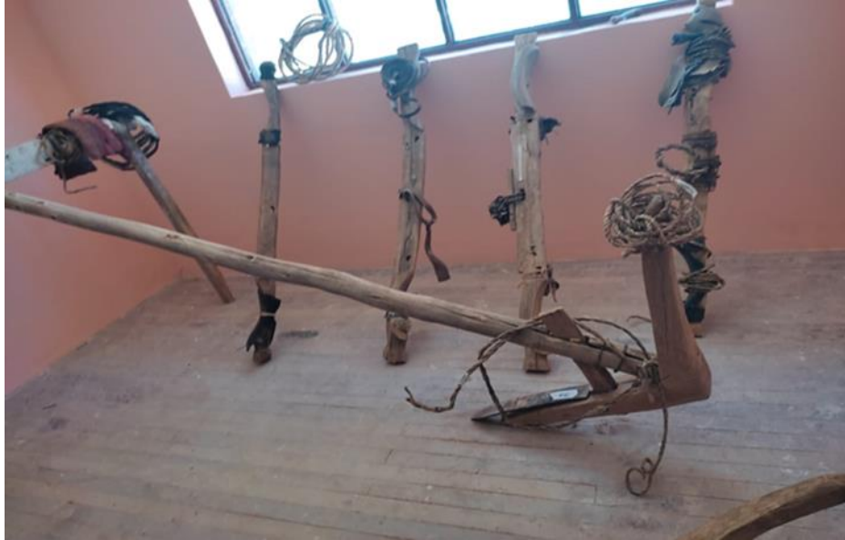
Fotografía: Nro. 8