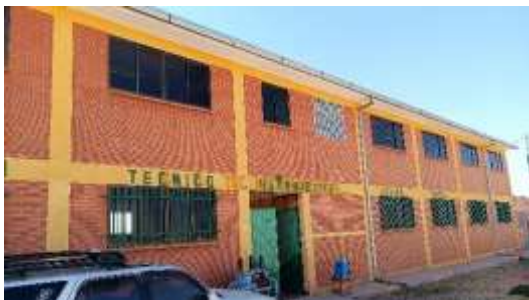
Núcleo Educativo Pallina Laja Técnico Humanístico Julián Apaza