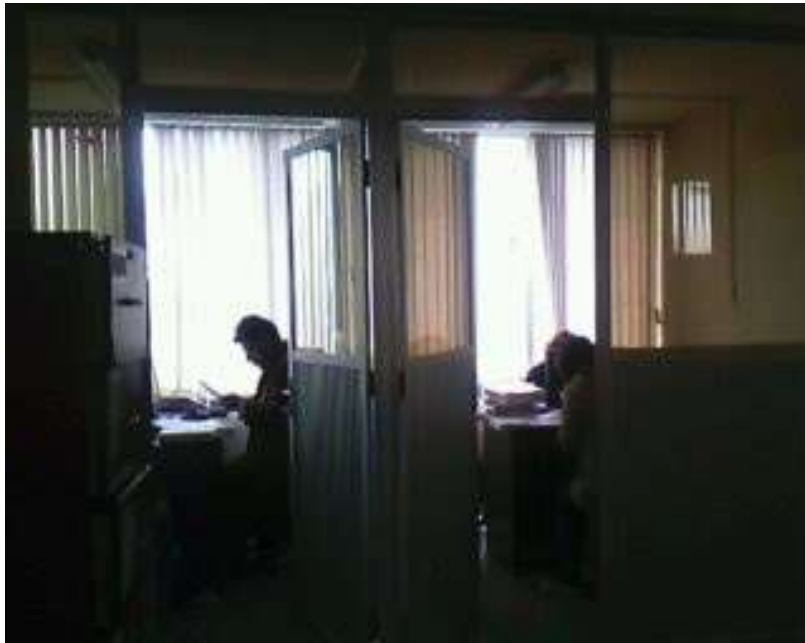
FOTO 9. LA TRABAJADORA SOCIAL ATENDIENDO UN CASO