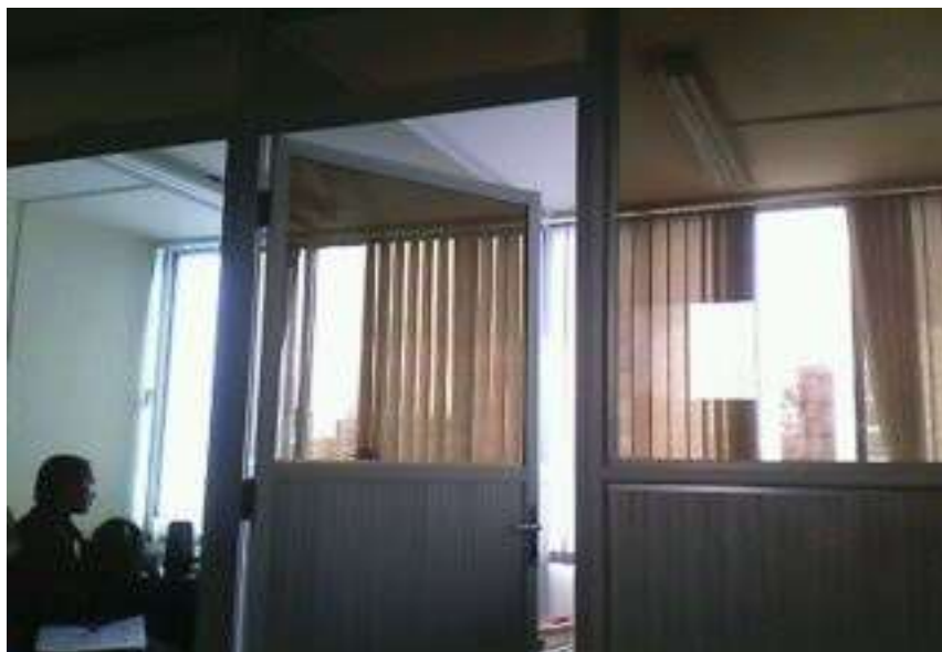
FOTO 11. FOTOGRAFÍA CON EL EQUIPO INTERDISCIPLINARIO DE LA DEFENSORÍA ESPECIALIZADA