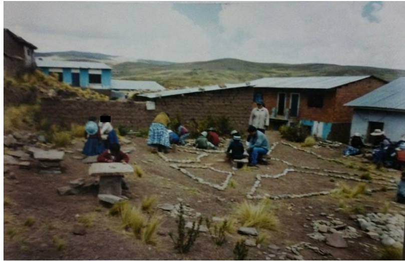
Conversando con los niños de la comunidad de Cantuyo