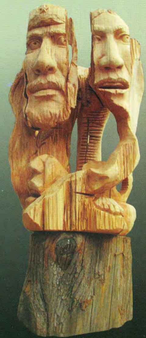
■ TITULO / FAUNA DE LA PAZ AUTOR / ESCUELA TALLER G.A.M.L.P. DIMENSIONES / 8X1.10X1.