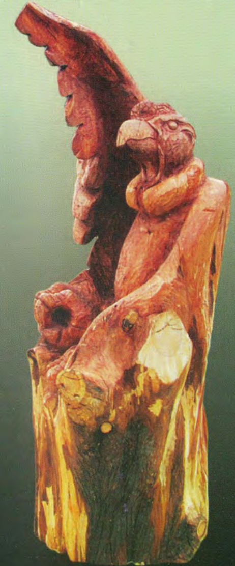
■ TITULO / LIBERTAD AUTOR / FÉLIX GÓMEZ CHIPANA DIMENSIONES / 1.40X87X87.