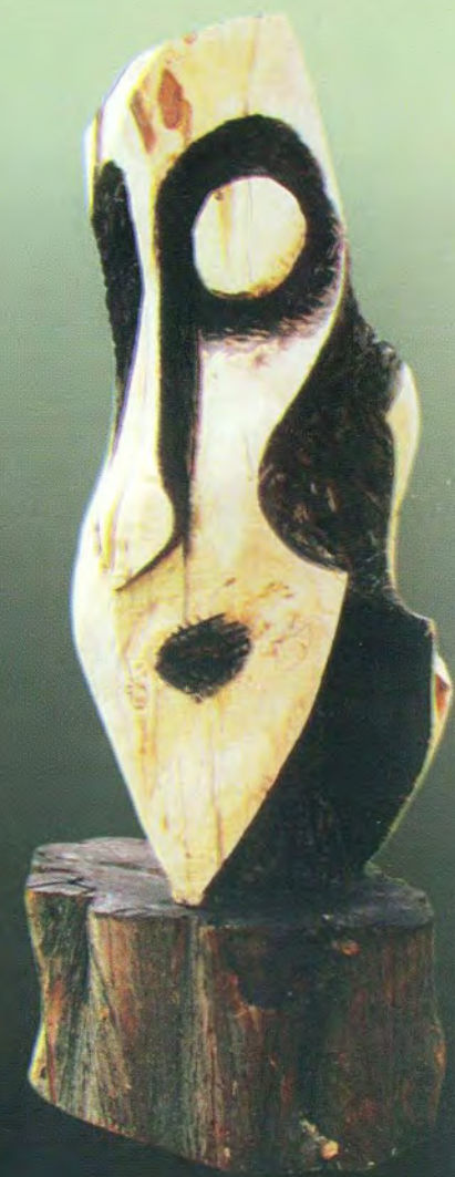
■ TITULO / ALTIPLANO AUTOR / JAVIER LEONARDO GUTIÉRREZ R. MARCELA MAMANI CARLOS QUISPE MAMANI DIMENSIONES / 2X80X70.