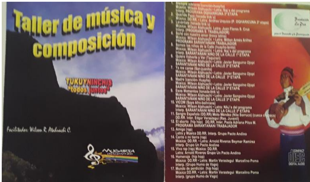
Ilustración 2. Tapa de la portada del cd musical