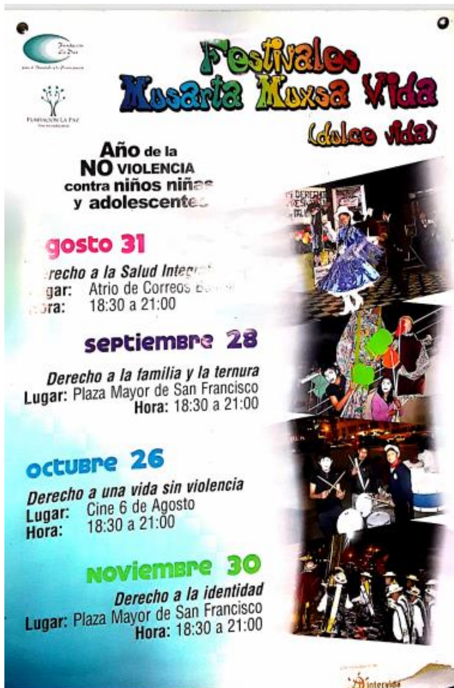
Ilustración 5. Festivales de MUSARTA MUXSA VIDA organizado por la producción musarta producciones de lo que fue encargado.