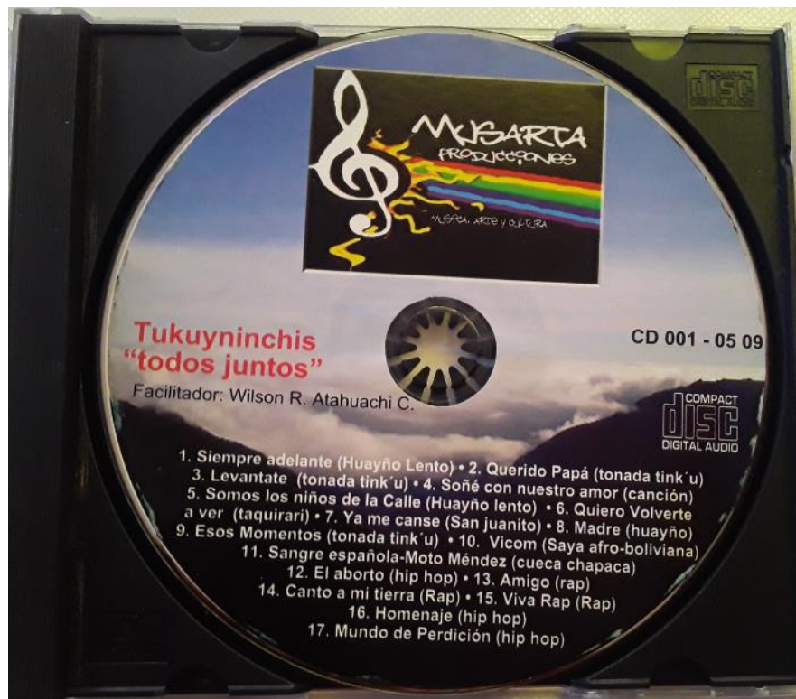
Ilustración 4. El cd. Musical el resultado final del taller de composición musical