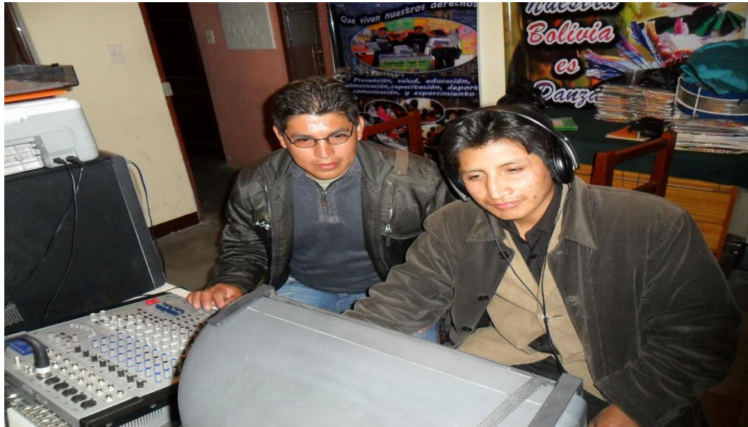
Ilustración 1. Dentro del estudio de grabación musical realizando la edición, ecualización, mezcla y masterización, las canciones grabadas dentro el taller de composición. (2011)