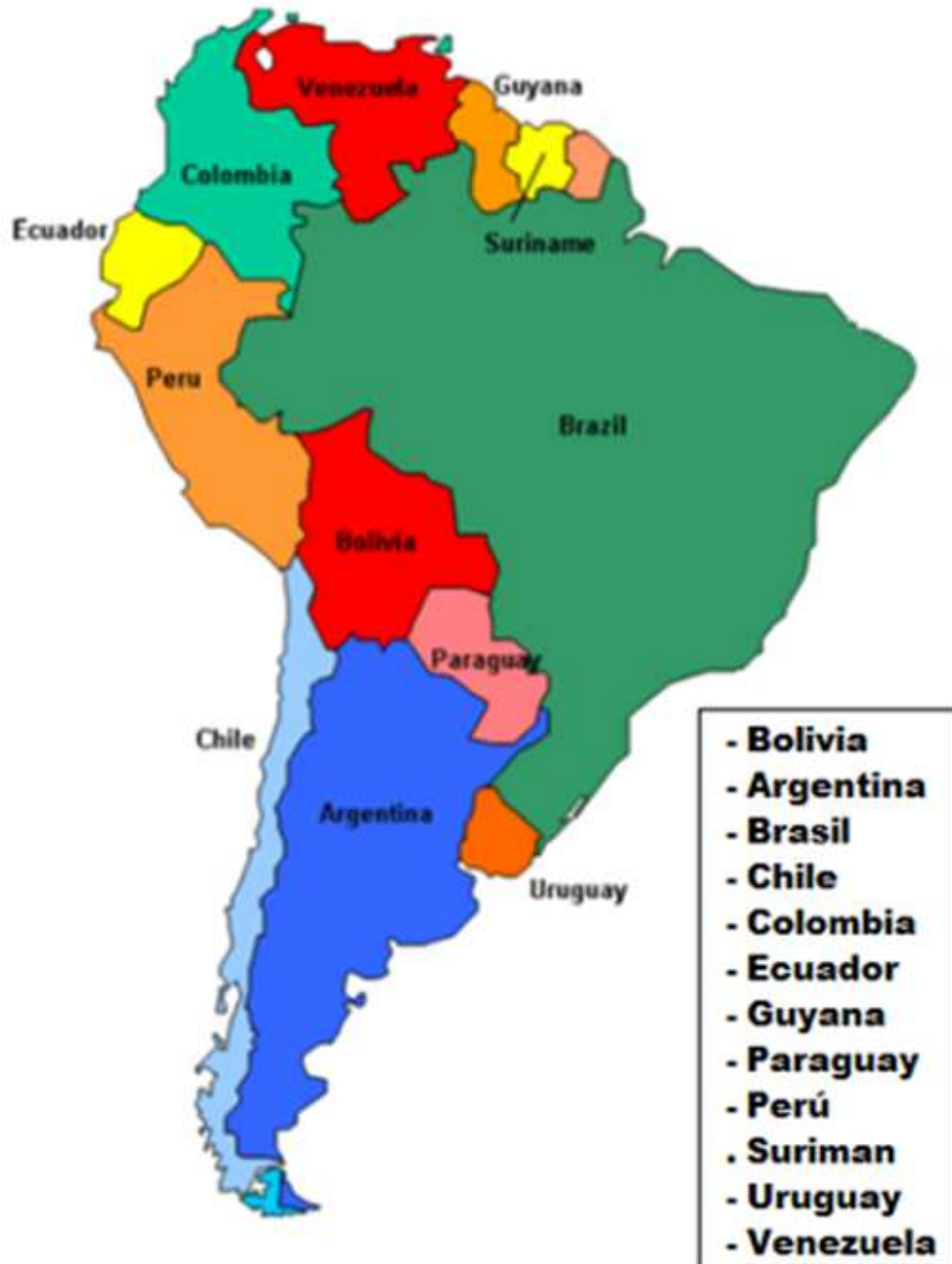
Figura 7: Mapa de los países miembros de UNASUR