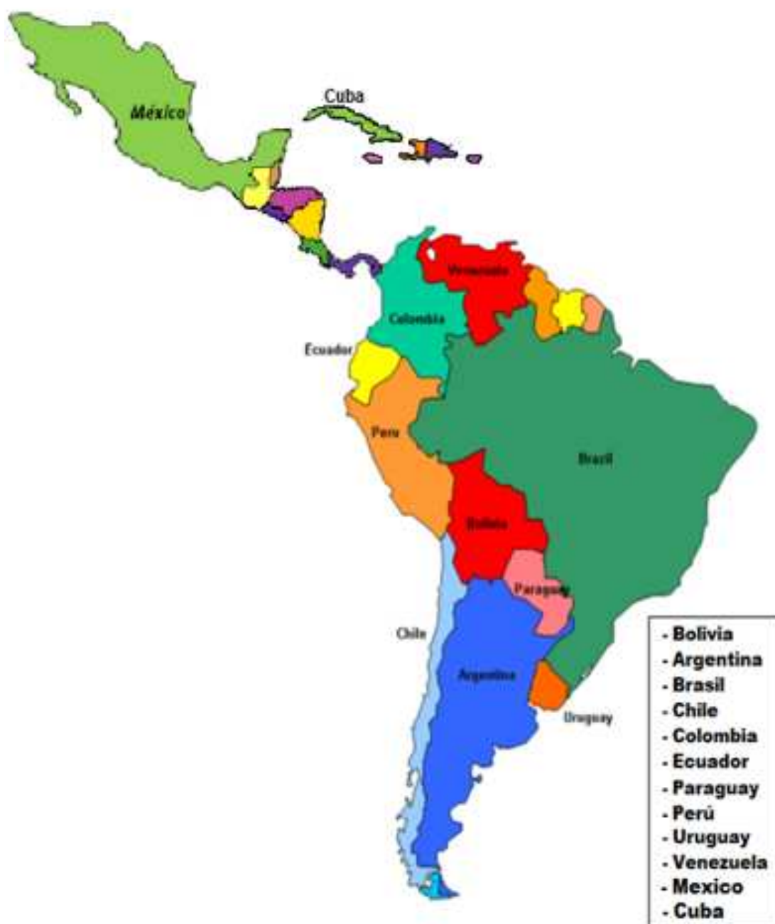
Figura 2: Mapa de los países miembros de la ALADI