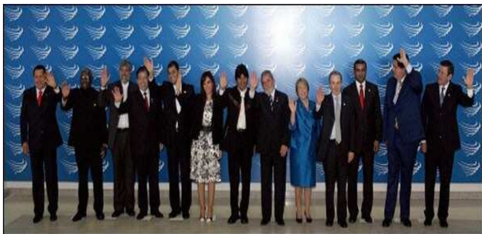
Figura 7. Presidentes en la creación de la UNASUR