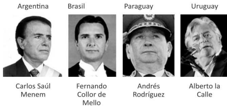
Figura 5. Presidentes en la creación de la MERCOSUR