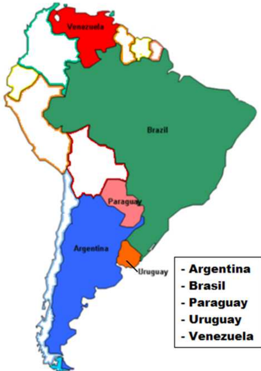
Figura 6: Mapa de los países miembros de MERCOSUR