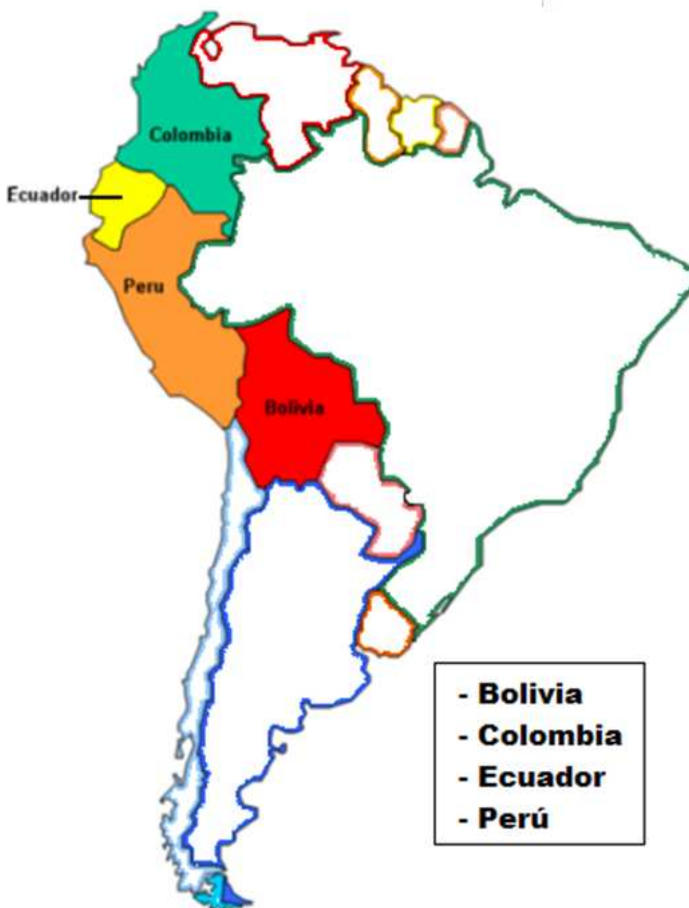
Figura 4: Mapa de los países miembros de la CAN