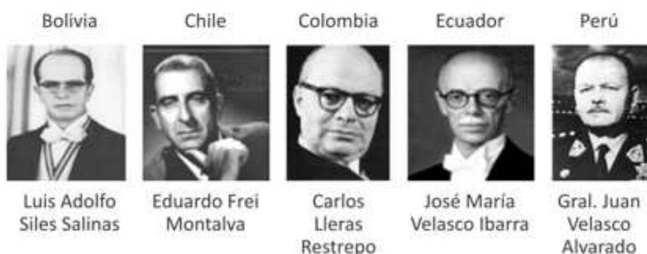
Figura 3: Presidentes en la creación de la CAN