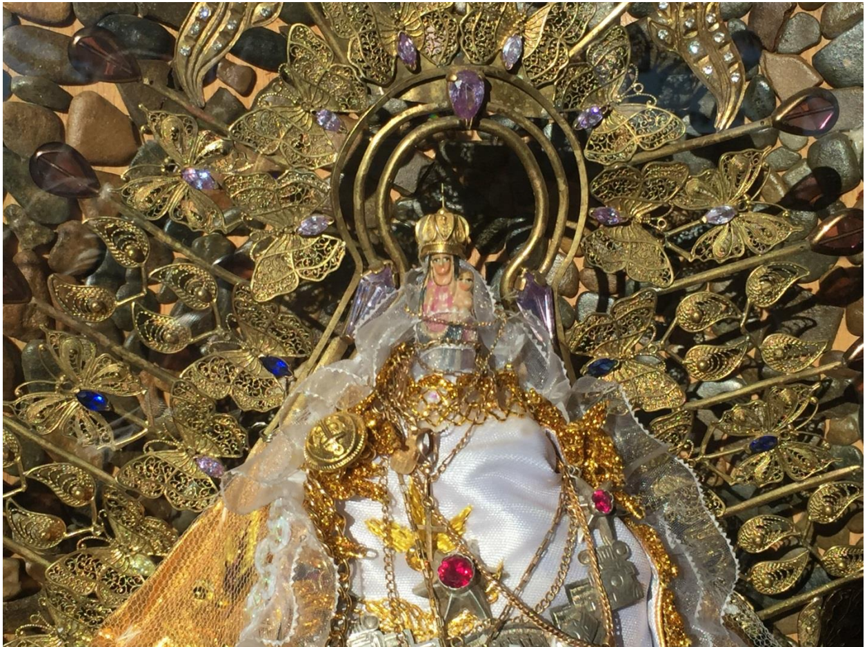
(Virgen de Letanías, Viacha 14 de abril, 2017. Por Paola Flores)