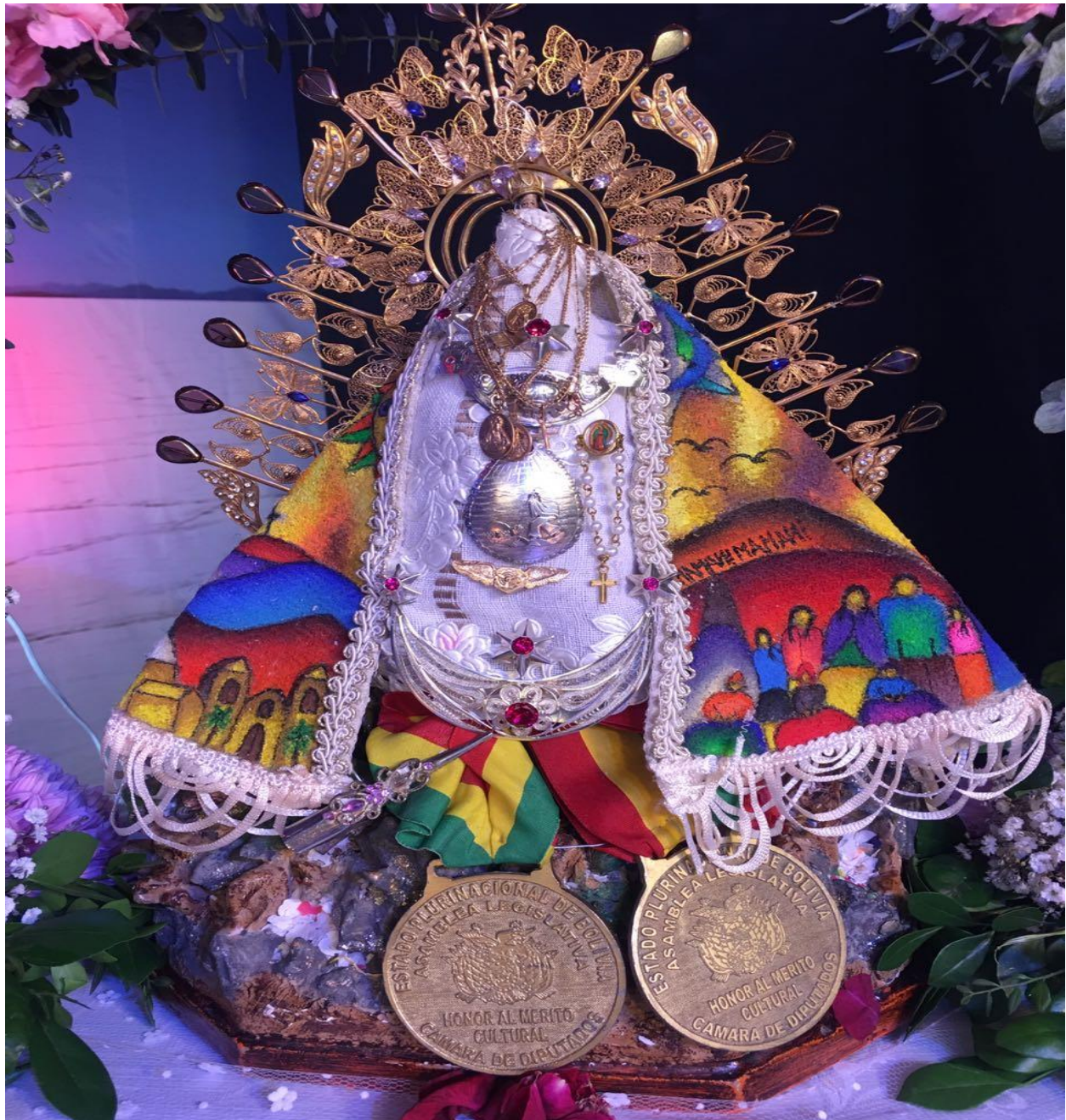
(Detalles de la Virgen de Letanías, Viacha, Junio 2018. Por Ministerio de Culturas)