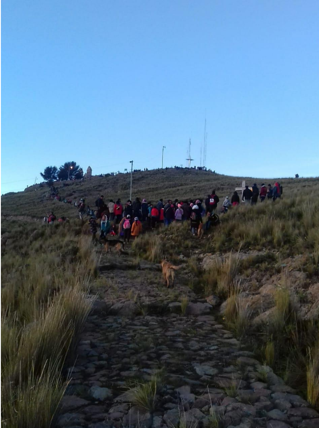
(Peregrinación al cerro de Letanías. Abril Por Guadalupe Tapia)