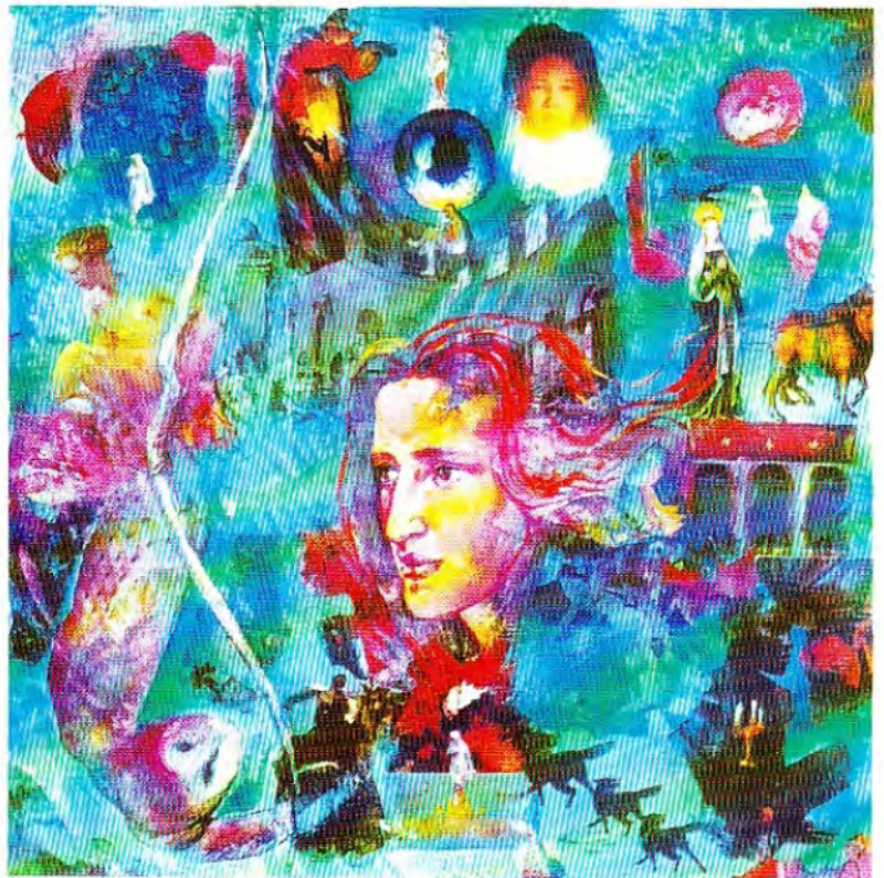
"Mito de los perros negros" óleo y colage Cartón 90 X 90 cm