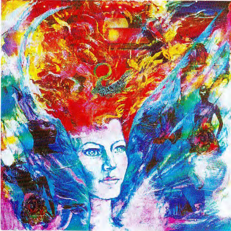
"Mito de la salamandra" óleo y colage Cartón 90 X 90 cm