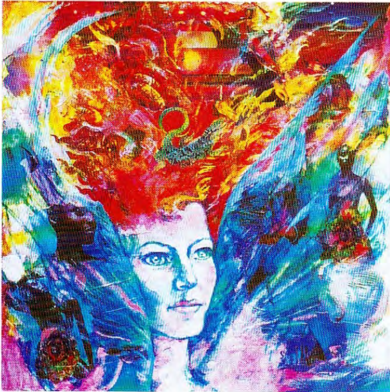
"Mito de la salamandra" óleo y colage Cartón 90 X 90 cm