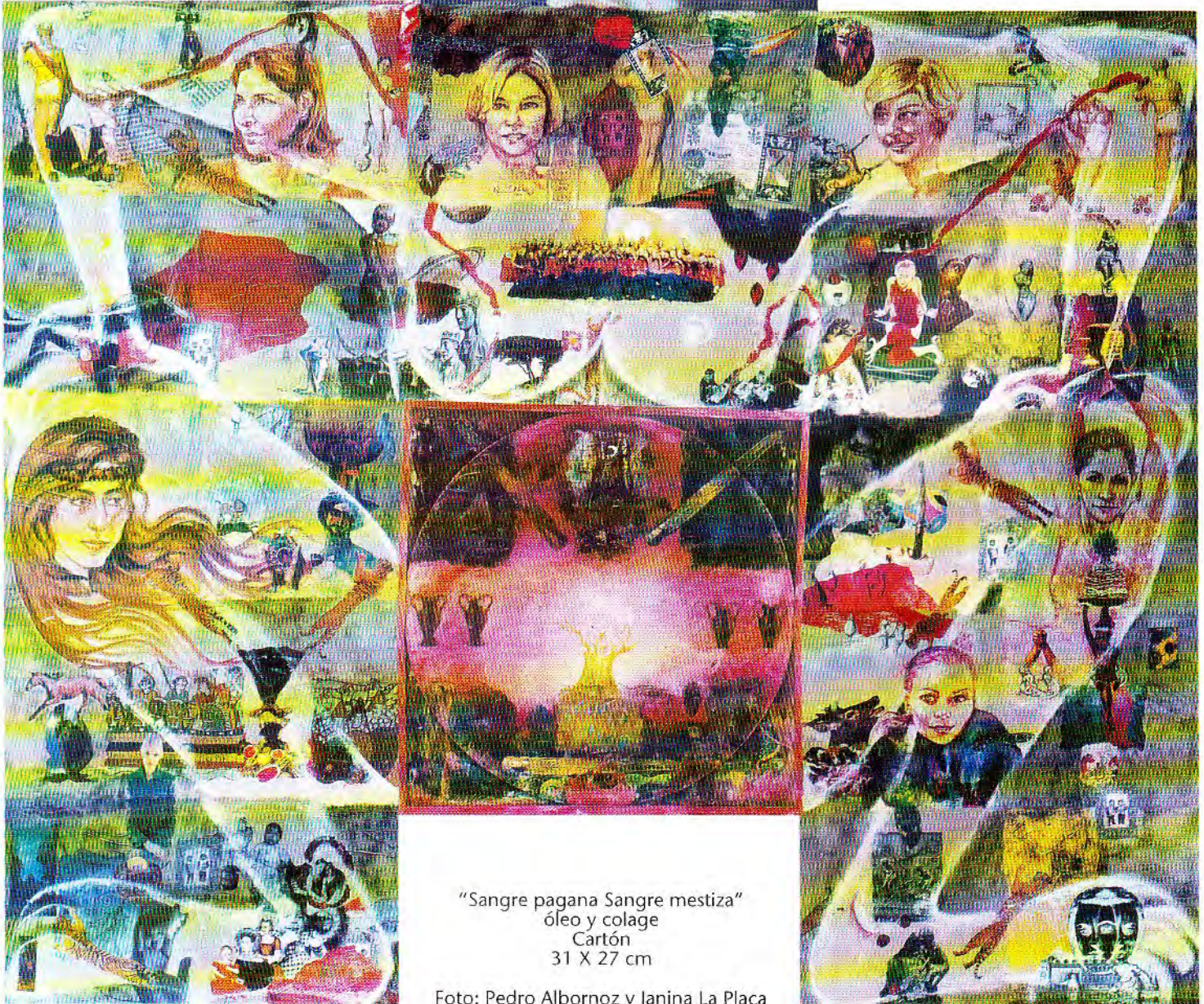
"Sangre pagana Sangre mestiza" óleo y colage Cartón 31 X 27 cm