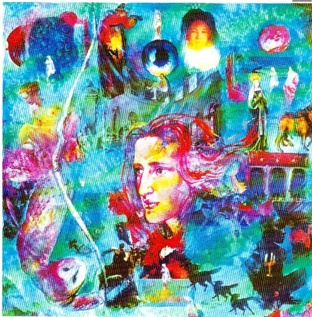
"Mito de los perros negros" óleo y colage Cartón 90 X 90 cm