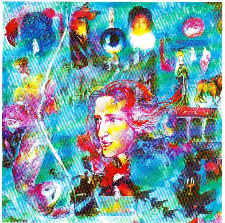
"Mito de los perros negros" óleo y colage Cartón 90 X 90 cm