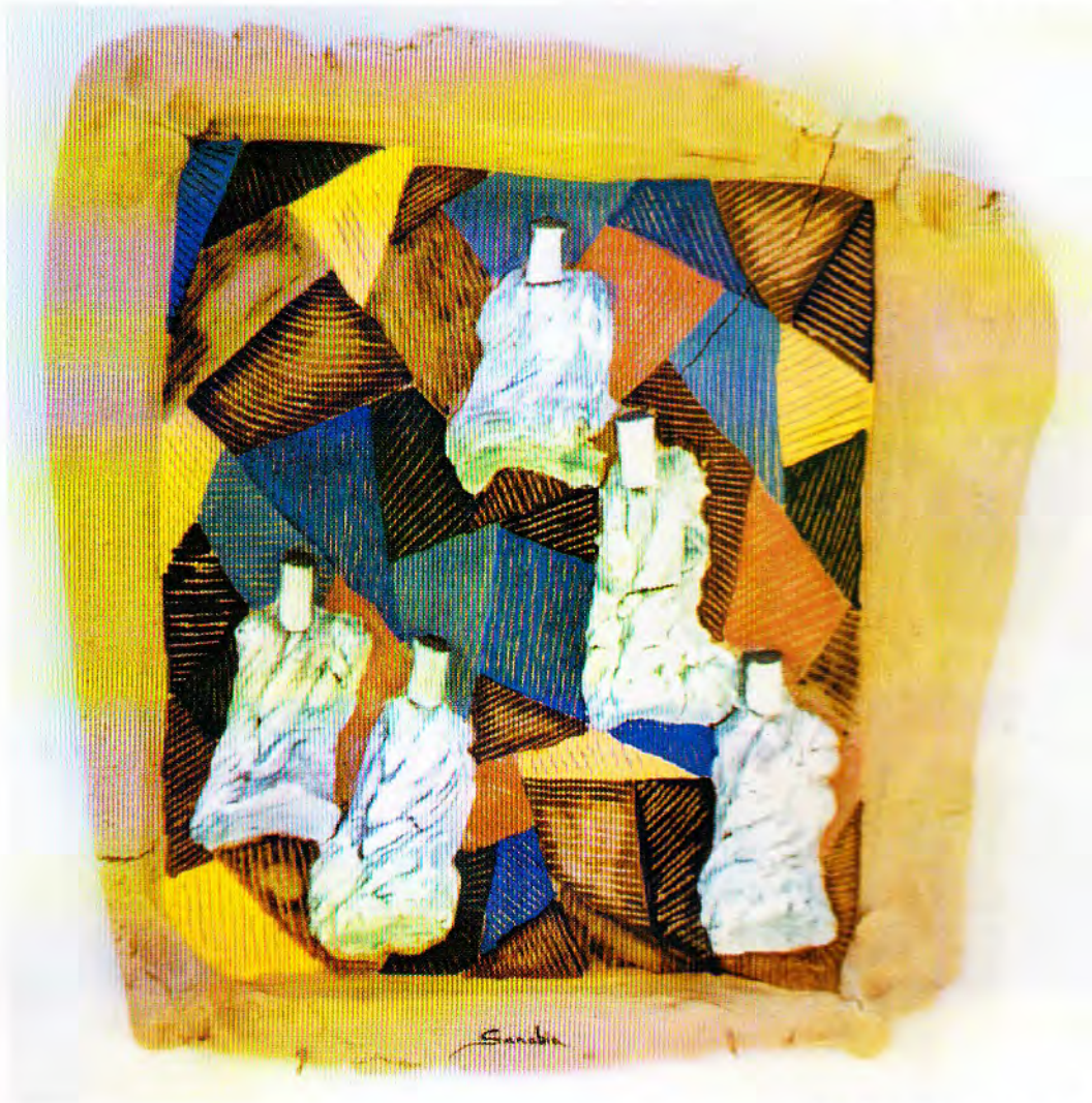
CELESTIALES – cerámica

Sus altas cerámicas "Celestiales" tienen un gran sentido de movimiento debido a sus formas espirales y su acertado uso del color. Su conocimiento de esmaltes es muy evidente y se puede apreciar en sus placas de pared, lo mismo que en sus trazos rápidos y efectivos en otras cerámicas.