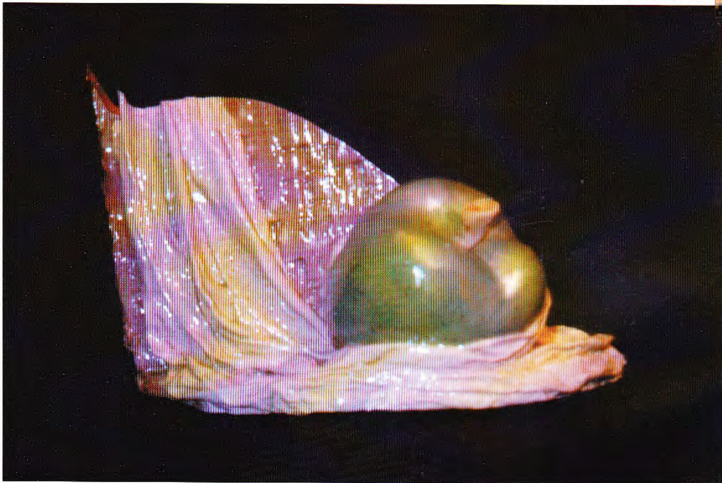
AL DESCUBIERTO — Cerámica

Su arte conceptual combinado varios elementos y texturas crean una sensación de movimiento y balance. Como acuarelista yo aprecio mucho sus lavados metálicos sobre porcelana. Me impactó su trabajo en la antigua técnica de RAKU. Los esmaltes son verdaderamente hermosos y las formas puras.