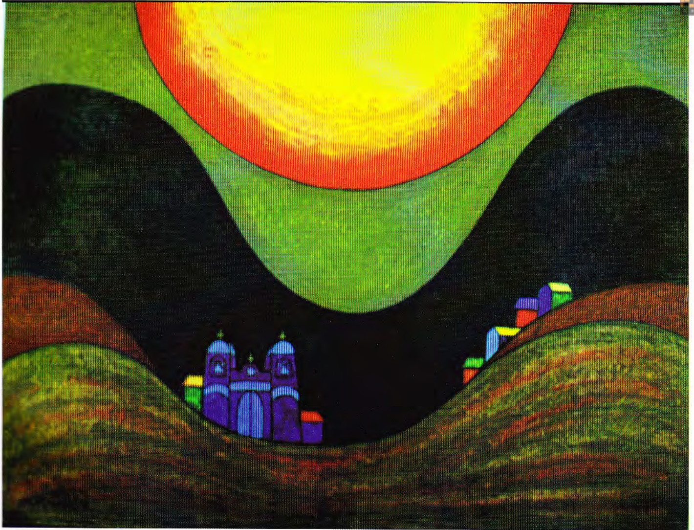
PUEBLO CON SOL — pastel oleo

"El ancestro, la pachamama, el mundo andino y mágico que Mamani Mamani lleva adentro, pugna por salir y él busca la mejor forma de expresarlo; sin miedo, experimentando con diversos materiales y temas que nos muestran la riqueza interior de este joven artista.