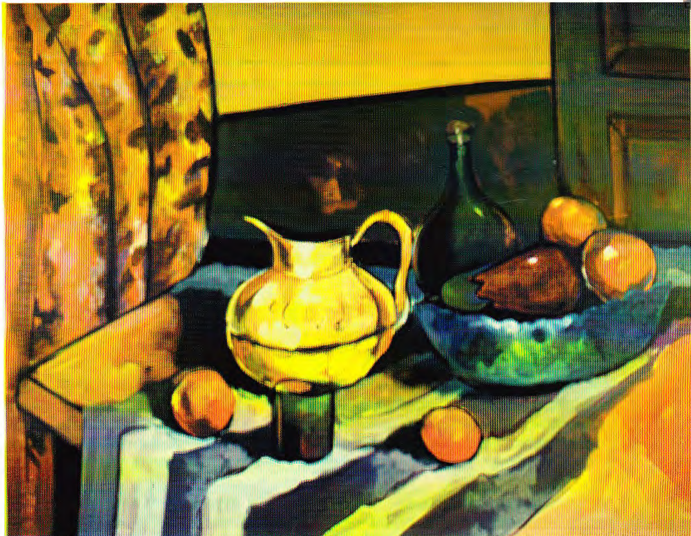
BODEGON – acrílico

Con todo el vibrante color de la escuela impresionista, juega a su favor Valdivia Aranibar. El color está allí, lo presiente, descubre y muestra este artista que ha vivido en las jugosas fuentes del impresionismo.