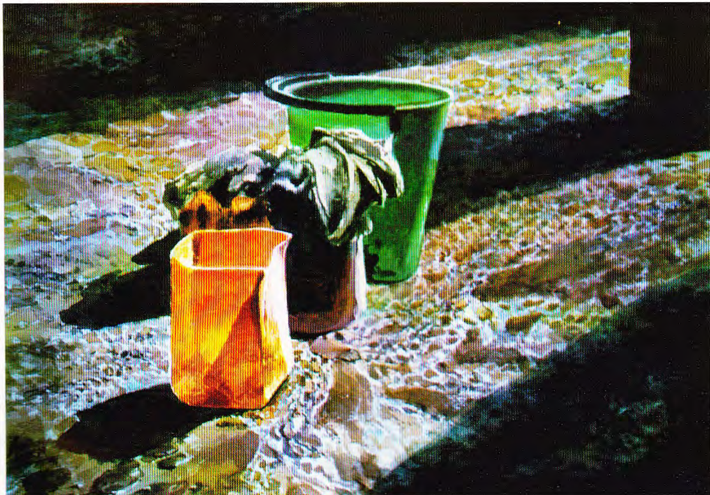
BALDES — Acuarela