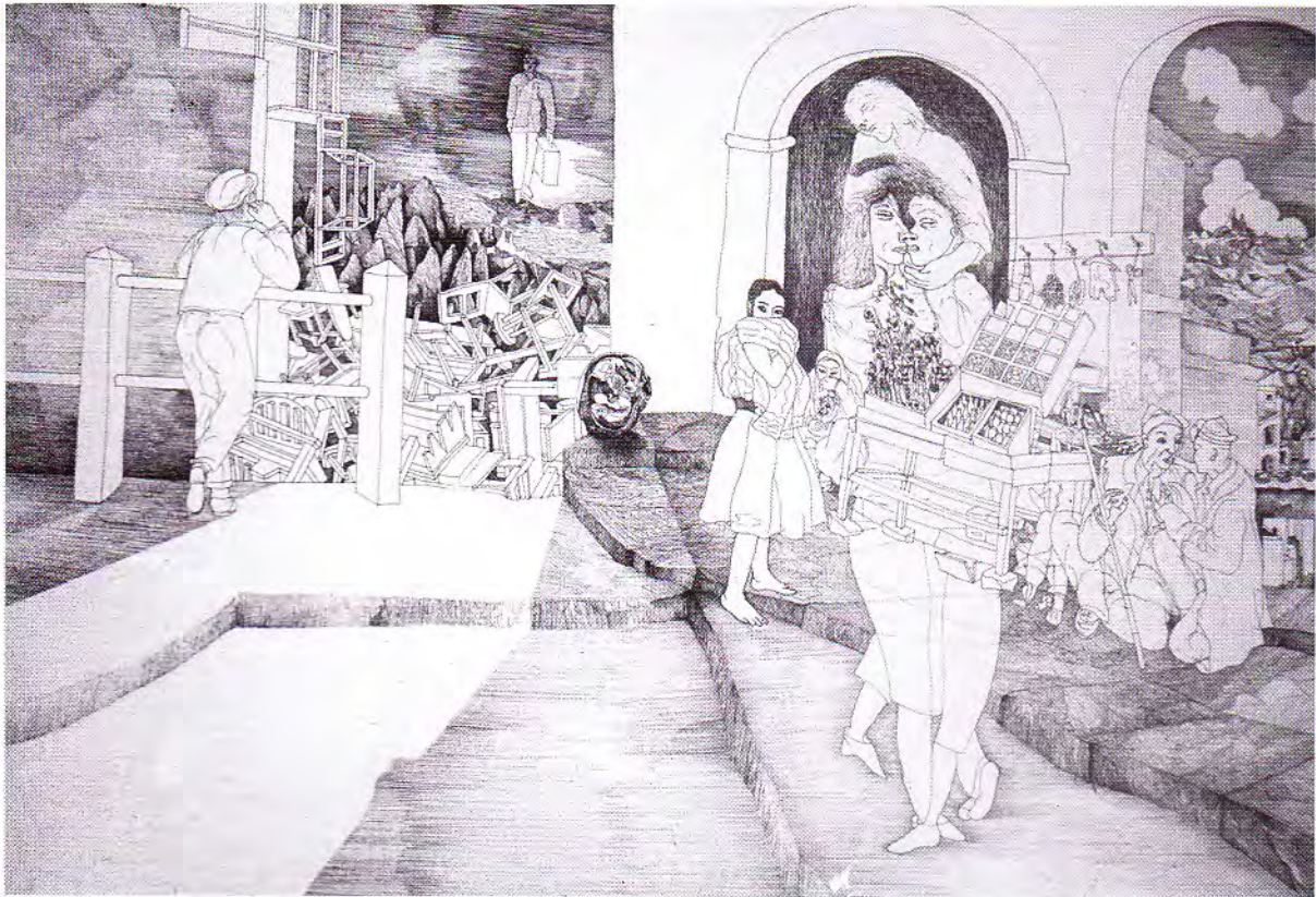
AMOR BRUJO tinta s/papel 38 x 54 cm.