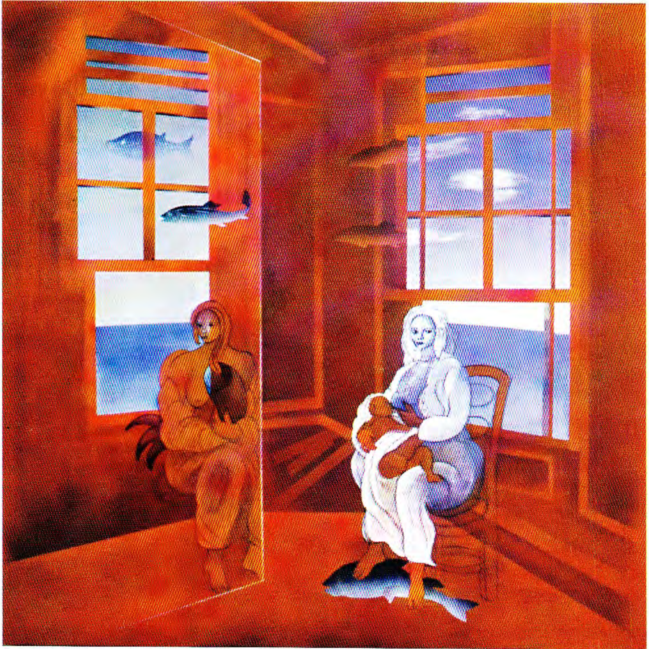
AGUA CIRCULAR (Variación sobre "ayer" de J. Borges) óleo s/tela 120 x 120 cm.