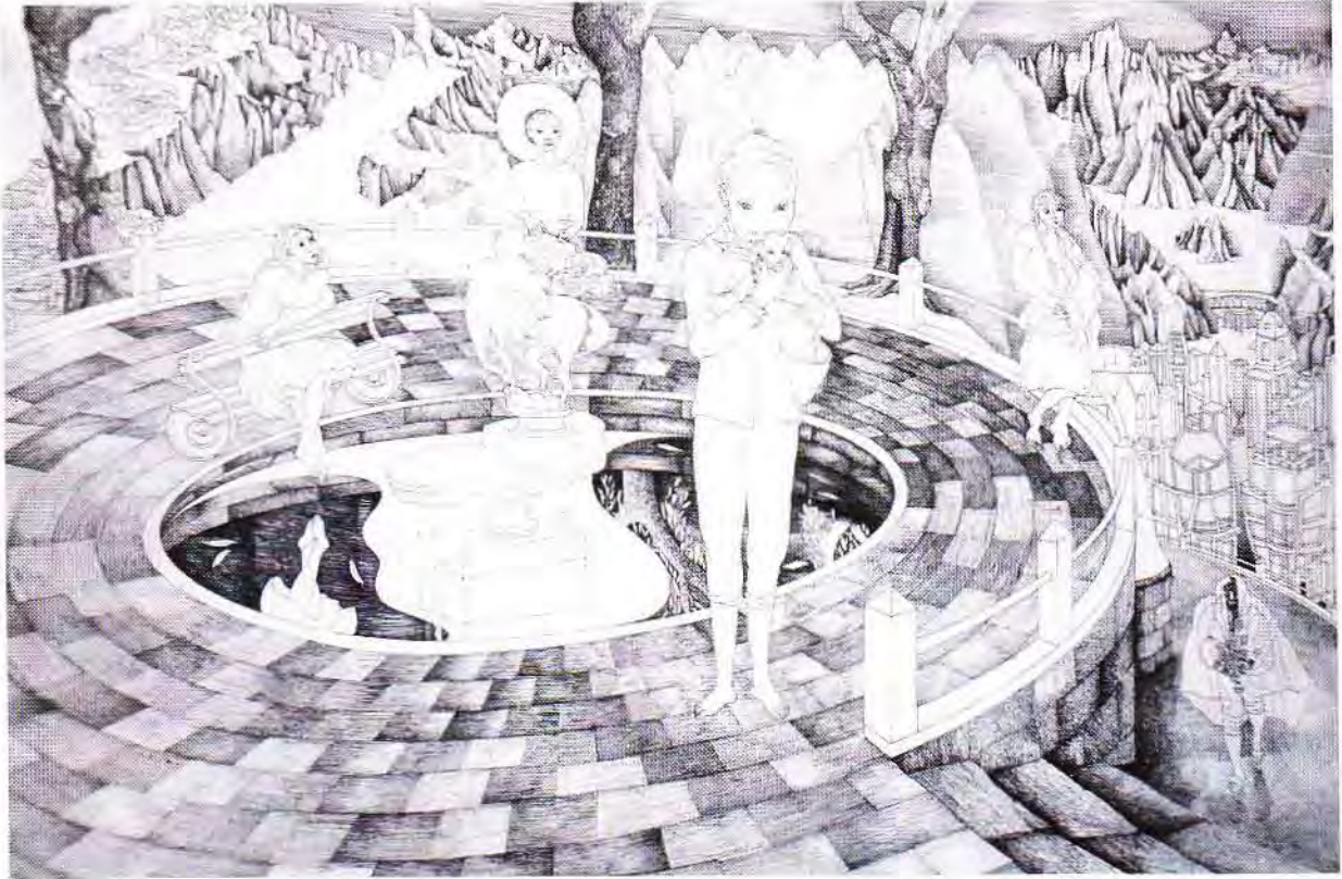
MONTICULO II tinta s/papel 38 x 54 cm.

Memoria Iluminada Galería donde vaga la sombra de lo que espero es verdad que vendrá es verdad que no vendrá A. Pizarnik