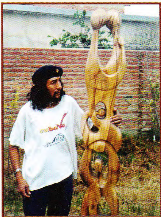
“ TERNURA SOCIAL.”