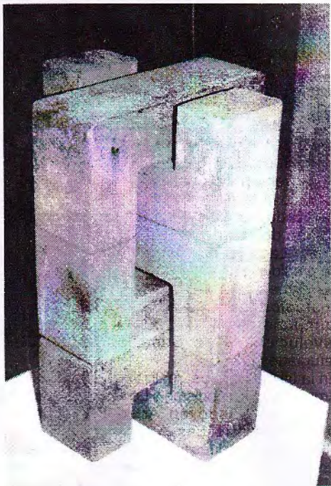
“ EVOLUCION 5 ”