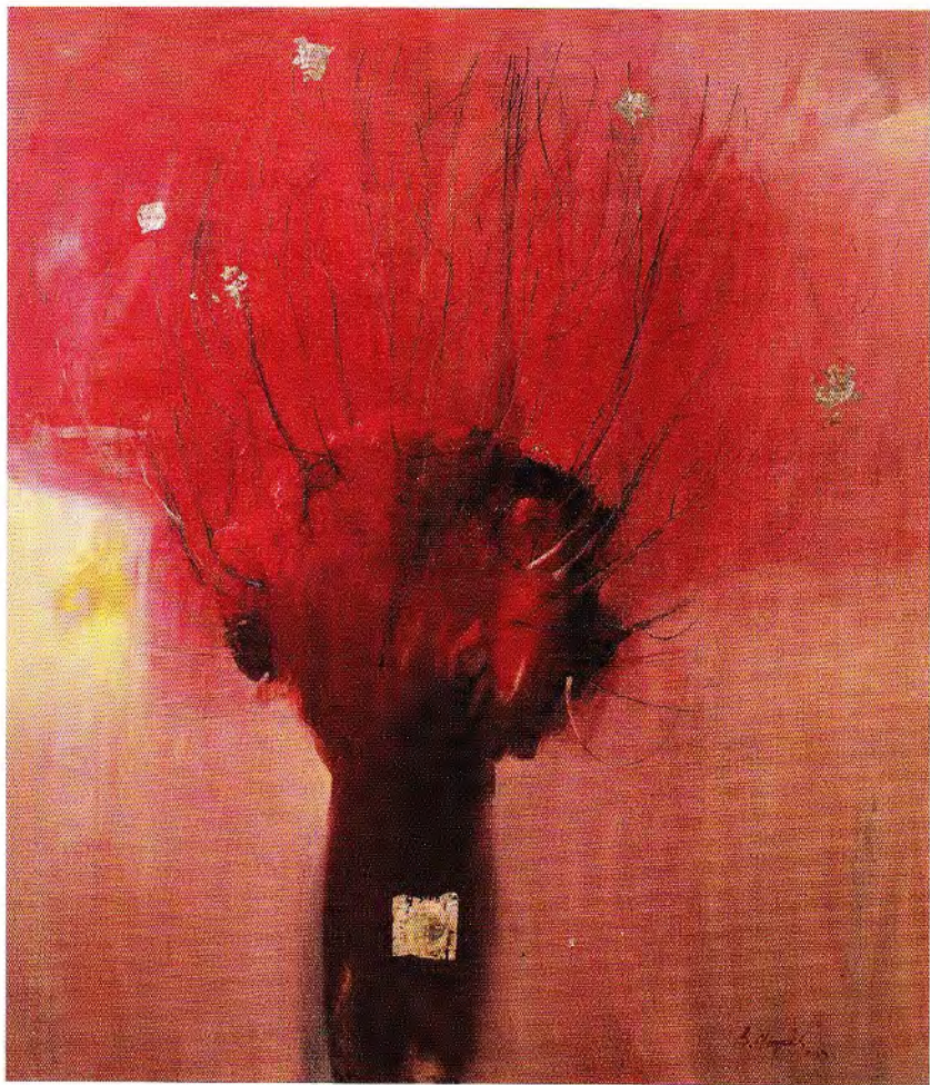
Tajibo - Plata - Rojo • óleo / lino, técnica mixta • 150 x 130 cm