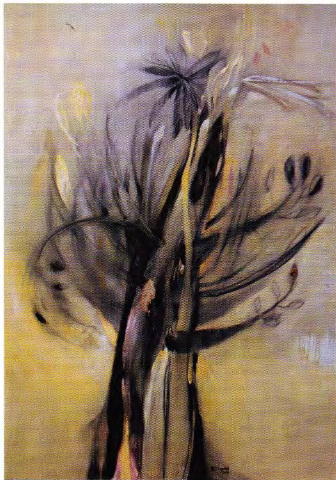
Oro - Plata - Jacarandá • óleo / lino, técnica mixta • 170 x 130 cm