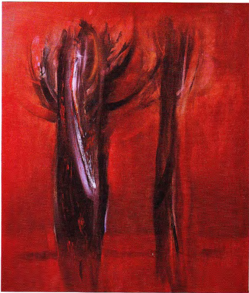
Ceibos - Cobre - Rojos • oleo / lino, técnica mixta • 170 x 130 cm