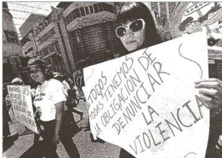
MOVILIZACIÓN. Una marcha en La Paz por el derecho de las mujeres a denunciar la violencia, en 2013.