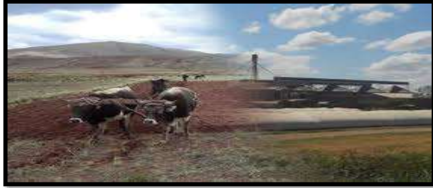
Las Tierras en el Altiplano Boliviano.