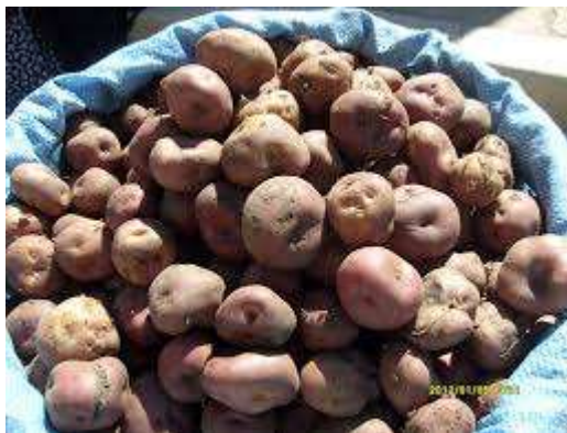
LA PRODUCCION EN EL ALTIPLANO.

Otros agricultores aymaras también trabajan de forma directa con exportadores cruceños que lanzan el producto a Europa y Asia. El mercado estadounidense ya conoce el producto boliviano abriéndose poco a poco y se necesita mayor difusión de las cualidades del consumo de una quinua Original, sin ninguna manipulación genética como es desarrollada y producida la quínoa en el estado de Colorado y de Canada.