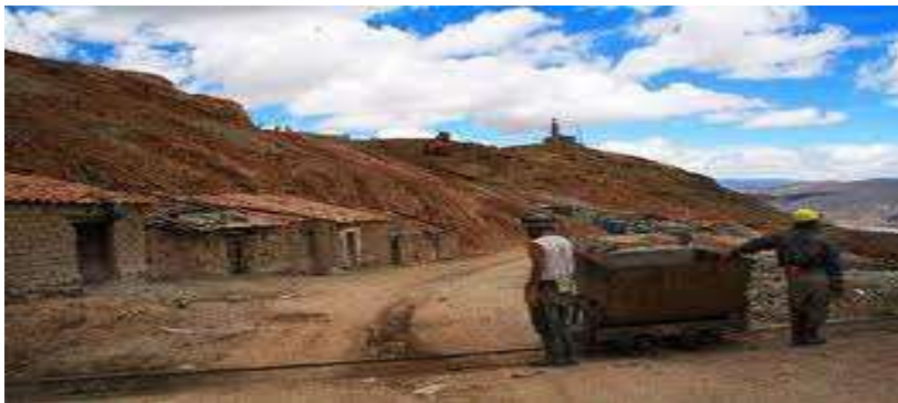
EL CLIMA EN EL ALTIPLANO HACE QUE LA SUPERVIVENCIA SE DIFICULTE.

La persistencia de conflictos ligados a la tierra ha evidenciado la necesidad de consolidar un centro de conciliación en materia agraria, que pueda orientar a las personas que estén atravesando por estos problemas.