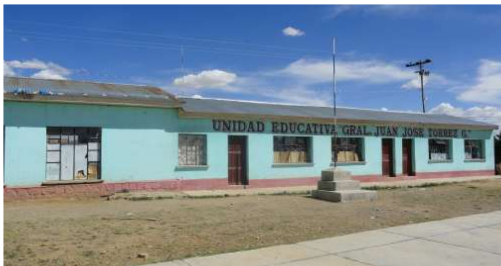
Unidad Educativa "Gral. J.J. Torrez" - Nucleo German Buch