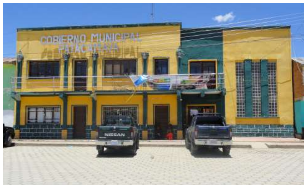
Edificio de la H. Alcaldía Autónoma Municipal de Patacamaya