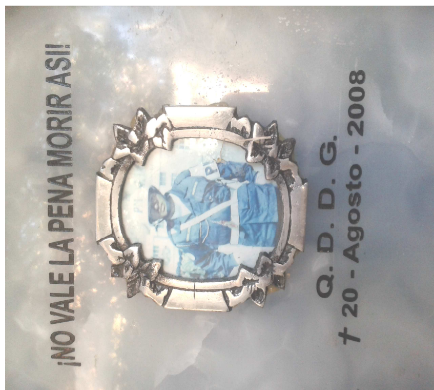
Ilustración 5: TESTIMONIO VULNERACION DE DERECHOS, 2008. ESTE SOLDADO FALLECIÓ TRAS SER GOLPEADO POR SU INSTRUCTOR EN LA CIUDAD DE EL ALTO.