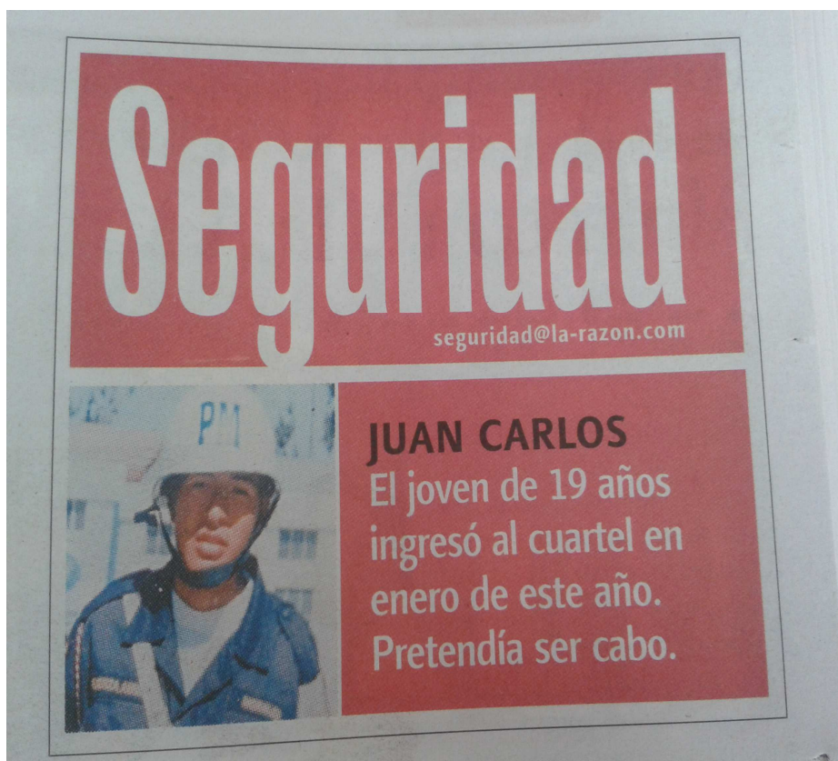
Ilustración 12: VULNERACIÓN DE DERECHOS, SOLDADO MURIO TRAS SER GOLPEADO POR SU PROPIO INSTRUCTOR 2008.