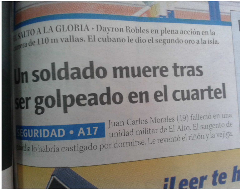
Ilustración 11: VULNERACIÓN DE DERECHOS, MEDIOS ESCRITOS LO DESTACAN DE ESTA MANERA.