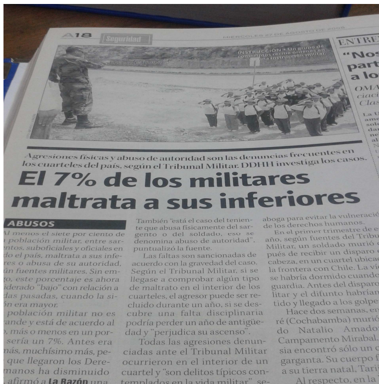
Ilustración 13: VULNERACIÓN DE DERECHOS, ESTADÍSTICAS QUE MUESTRA ESTE MEDIO DE COMUNICACIÓN