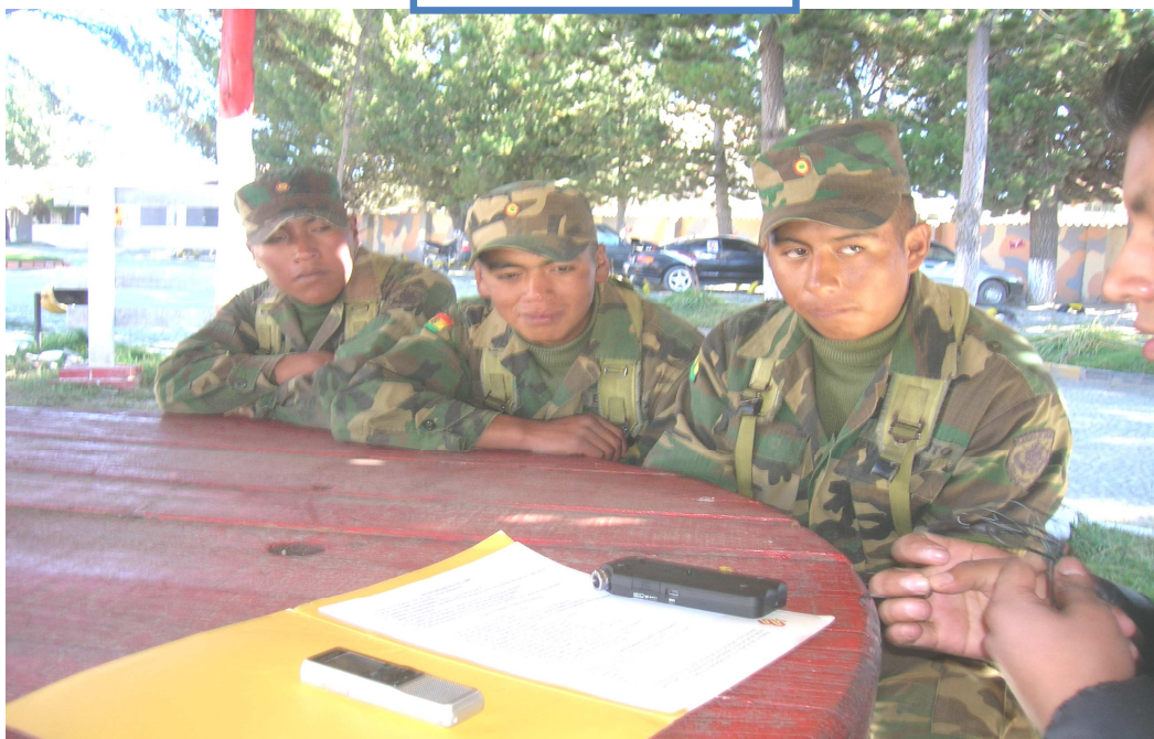
Ilustración 1: REGIMIENTO AYACUCHO DEL MUNICIPIO DE ACHACACHI, PROVINCIA OMASUYOS-LAPAZ. ENTREVISTA A ALGUNOS SOLDADOS, 2014.