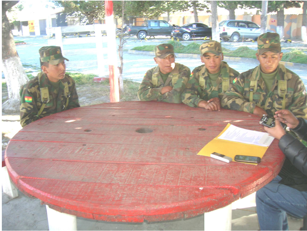
Ilustración 4: ENTREVISTA SOLDADOS, PREPARANDO LA REPORTERA PARA GRABAR LAS INTERVENCIONES.