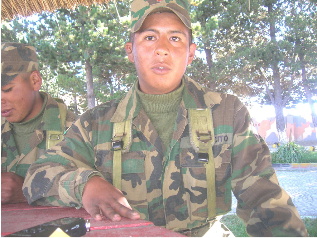
Ilustración 3: ENTREVISTA SOLDADO, ÉL CUENTA LA IMPORTANCIA DE ESTE SERVICIO.