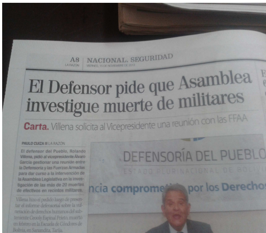
Ilustración 8: VULNERACIÓN DE DERECHOS, DEFENSOR DEL PUEBLO REFIRIÉNDOSE SOBRE MUERTE DE MILITARES.