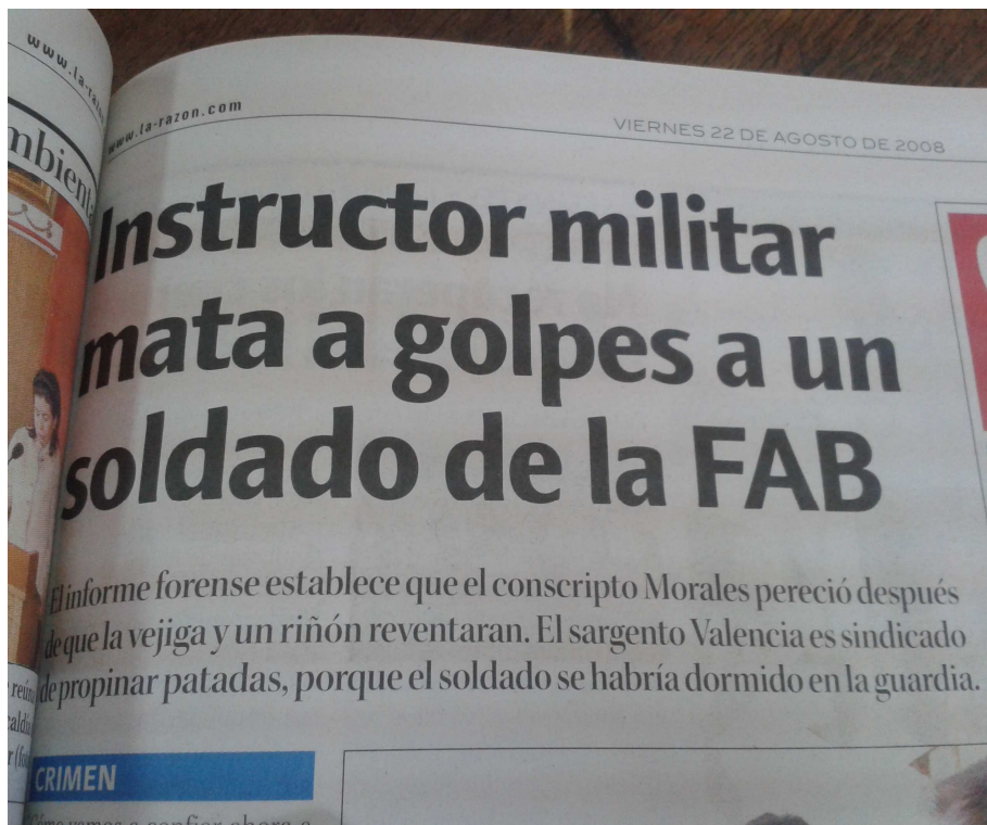
Ilustración 14: VULNERACIÓN DE DERECHOS, REPERCUSIONES SOBRE LA MUERTE DE JUAN CARLOS 2008.