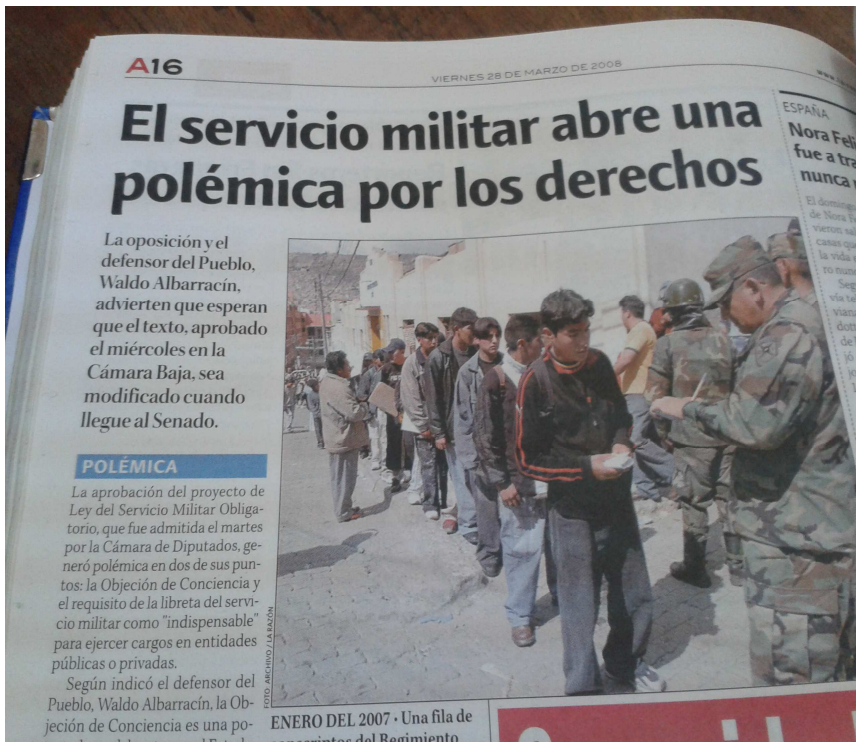
Ilustración 10: VULNERACIÓN DE DERECHOS, REPERCUSIONES.