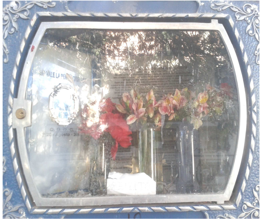
Ilustración 6: CEMENTERIO, SOLDADO GOLPEADO. ES LA TUMBA DONDE FUE ENTERRADO, CIUDA DE LA PAZ.