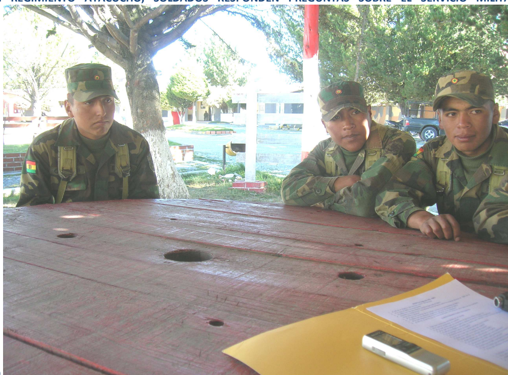
Ilustración 2: REGIMIENTO AYACUCHO, SOLDADOS RESPONDEN PREGUNTAS SOBRE EL SERVICIO MILITAR