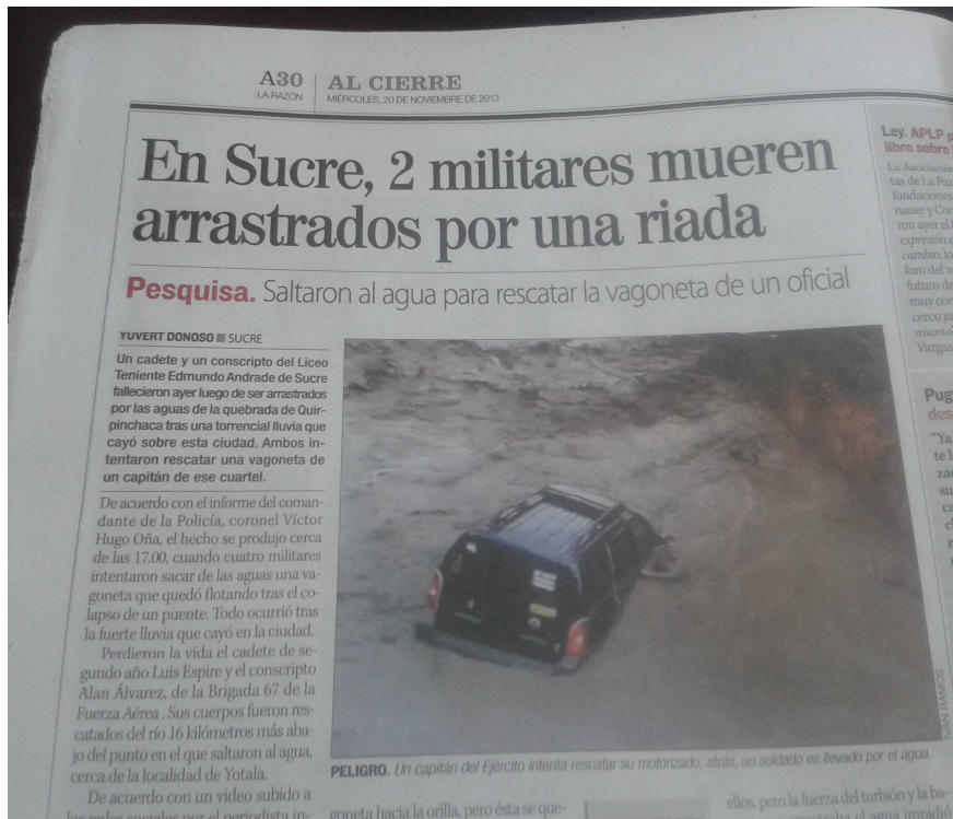
Ilustración 7: VULNERACIÓN DE DERECHOS, OCURRIÓ EN SUCRE.