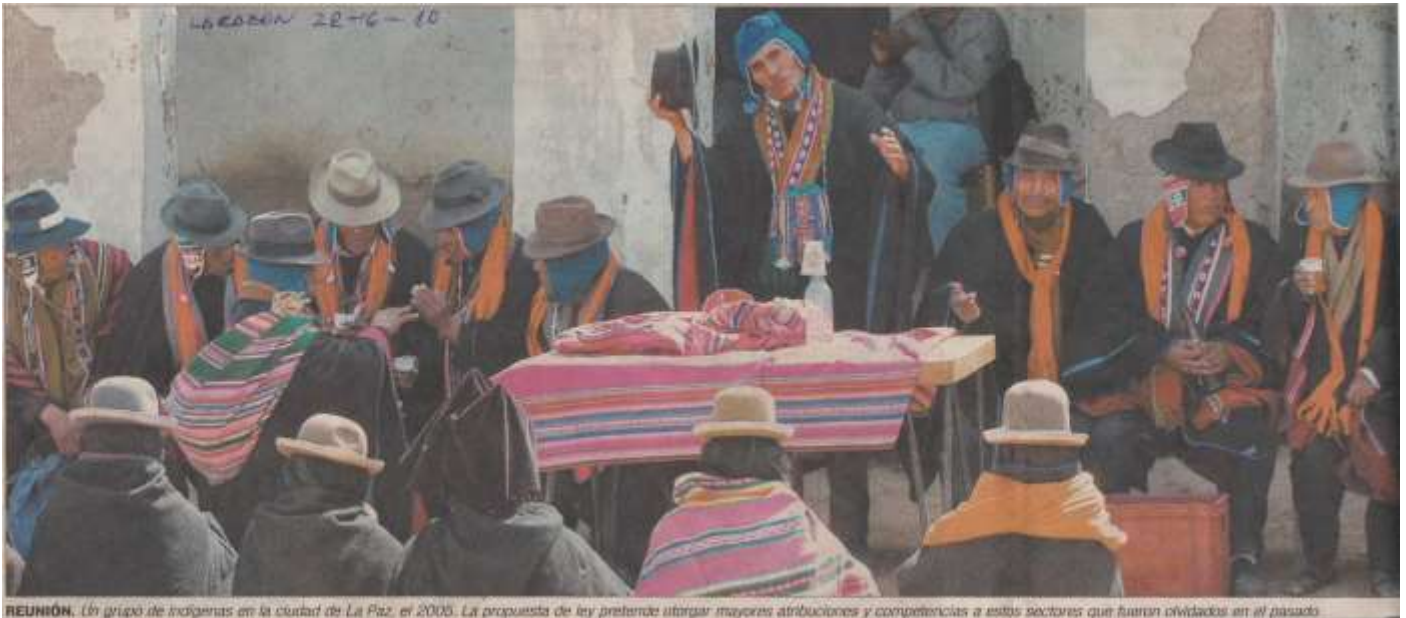
REUNIÓN. Un grupo de indígenas en la ciudad de La Paz, el 2008. La propuesta de ley pretende otorgar mayores atribuciones y competencias a estos sectores que fueron olvidados en el pasado