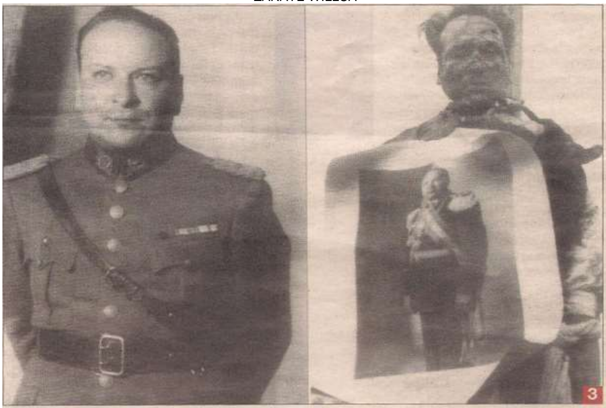
TENIENTE CNEL. GUALBERTO VILLARROEL DEFENSOR DE LOS INDÍGENAS