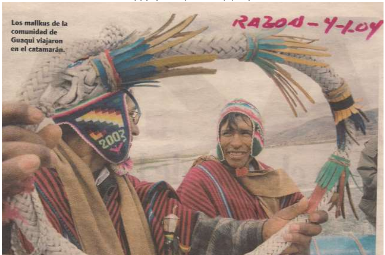
MANDO DE AUTORIDAD