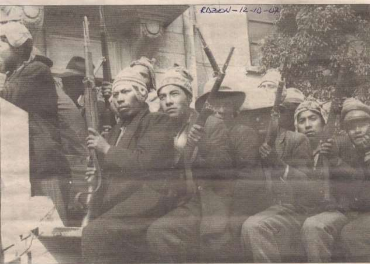
LA PAZ · Un grupo de campesinos armados durante los aprestos de la Revolución de abril de 1952, producto de cuyas reformas se alcanzaron logros como el voto universal.