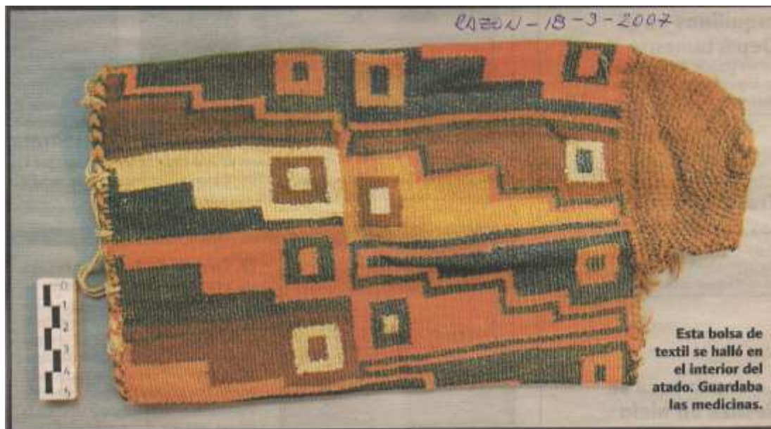
CULTURA, CERÁMICA Y TEJIDO