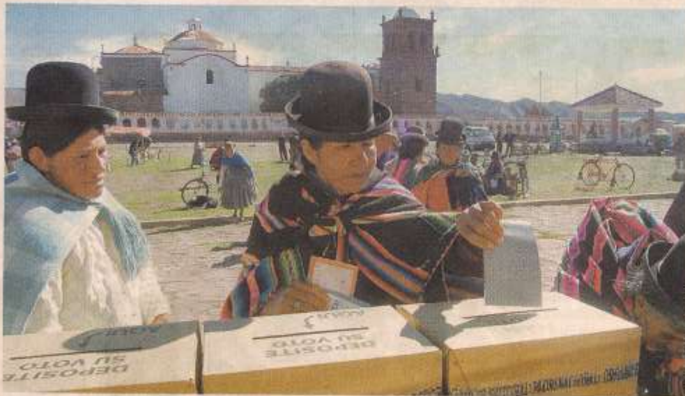
El voto rural tuvo como prioridad hicieron largas filas para emitir su voto. Además de nuestros compañeros Una pobladora

Los machaqueños hicieron filas desde las 6.00 para depositar su voto en las tres mesas electorales que se instalaron en el pueblo. Unos 200 mil ciudadanos de cinco departamentos