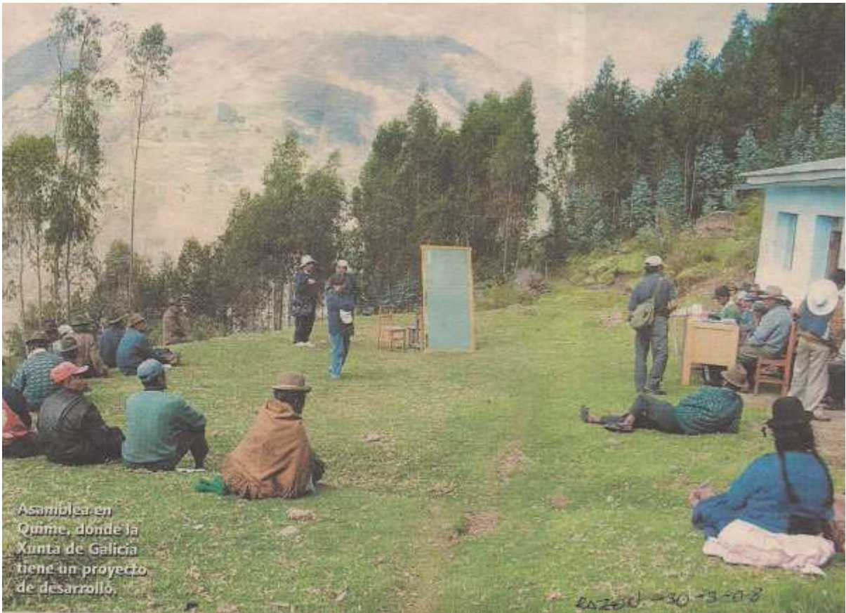
COSTUMBRES Y TRADICIONES