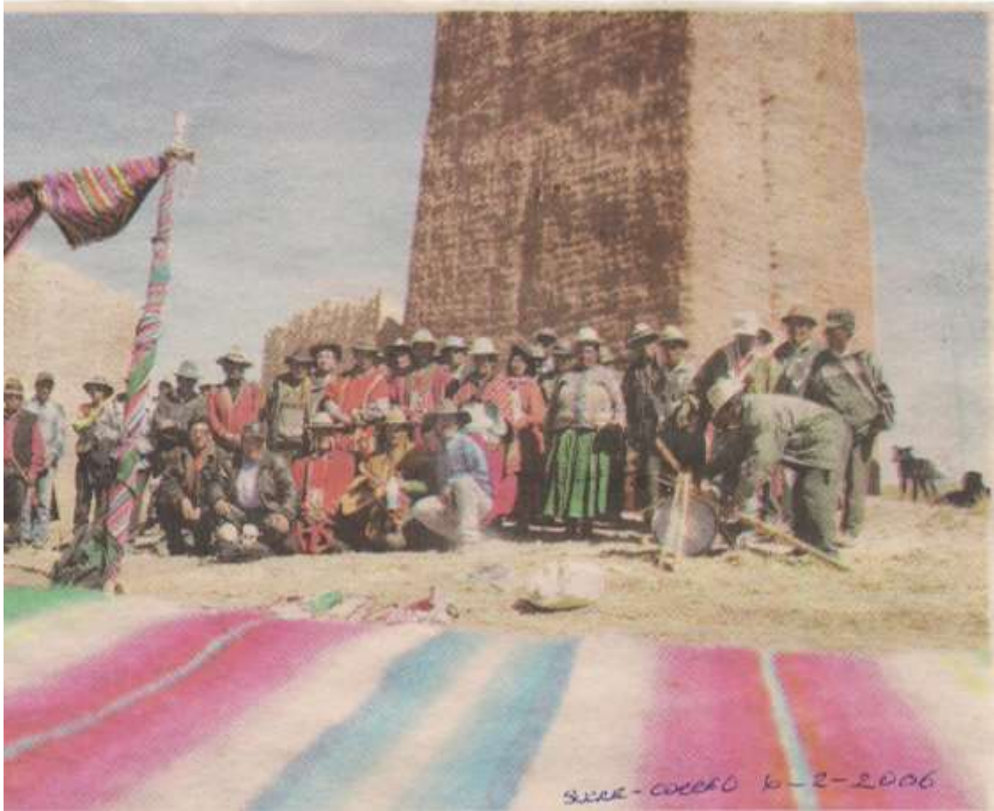
LAS COMUNIDADES DE WAYLLANI Y CÓNDROR AMAYA