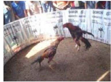
PELFA DE GALLOS

Existe una diversidad de recursos turísticos y potenciales atractivos, clasificados en sitios naturales, patrimonio histórico y monumental, etnográfico y folklore, culturas vivas, artesanía étnica, fechas cívicas y religiosas, acontecimientos y festivales programados.