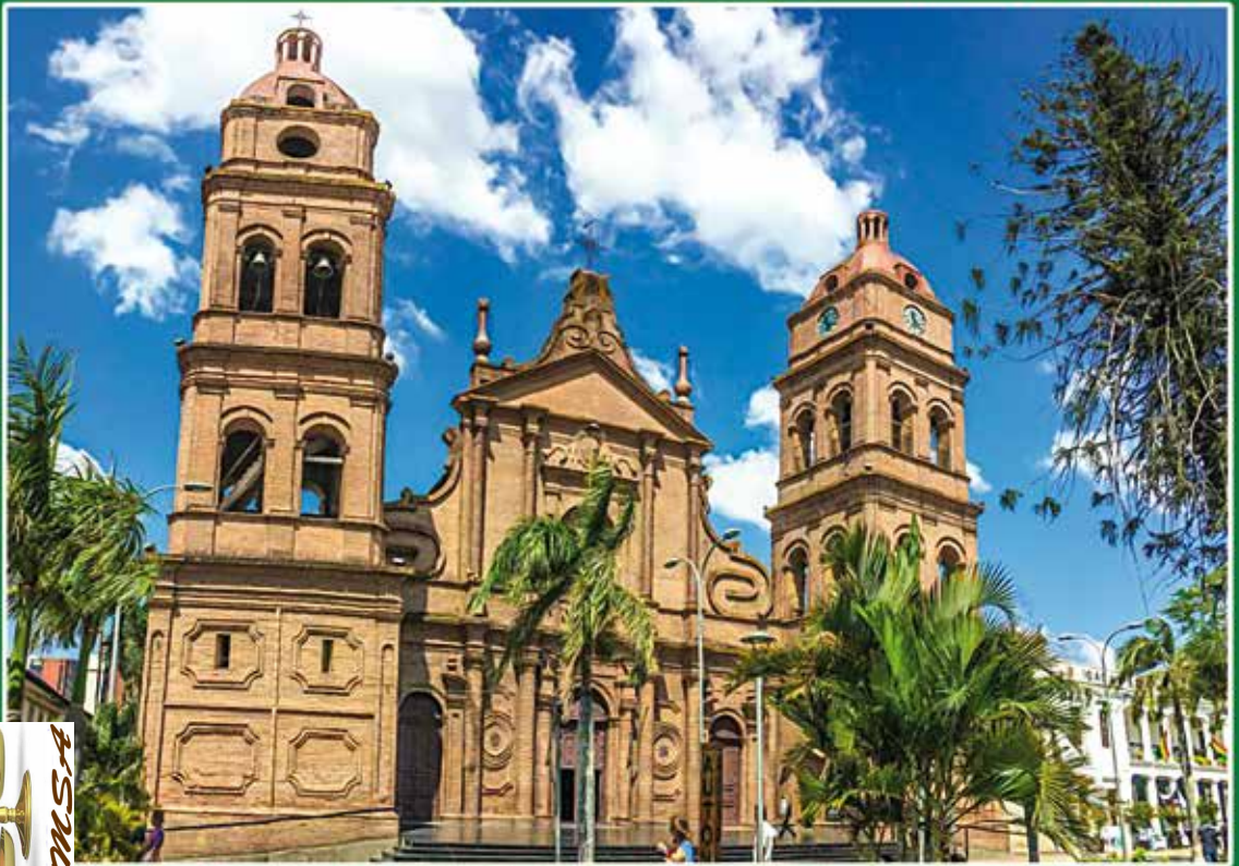
de Viajes Viajando en Carro (2016). "Catedral Metropolitana Santa Cruz de la Sierra" [en línea]; www.viajandoencarro.com/tag/motivaciones/ [consulta: 15/12/2017]