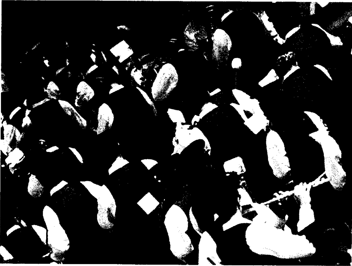
Ilustracion No 1

Orquesta popular: es aquella que interpreta la música actual o popular, es decir, la que está de moda en esta época como rock, jazz, música latinaailable, etc. Piano, sintetizador, batería, bajo eléctrico, saxofón, trompeta y percusión variada son parte de los instrumentos que la conforman.