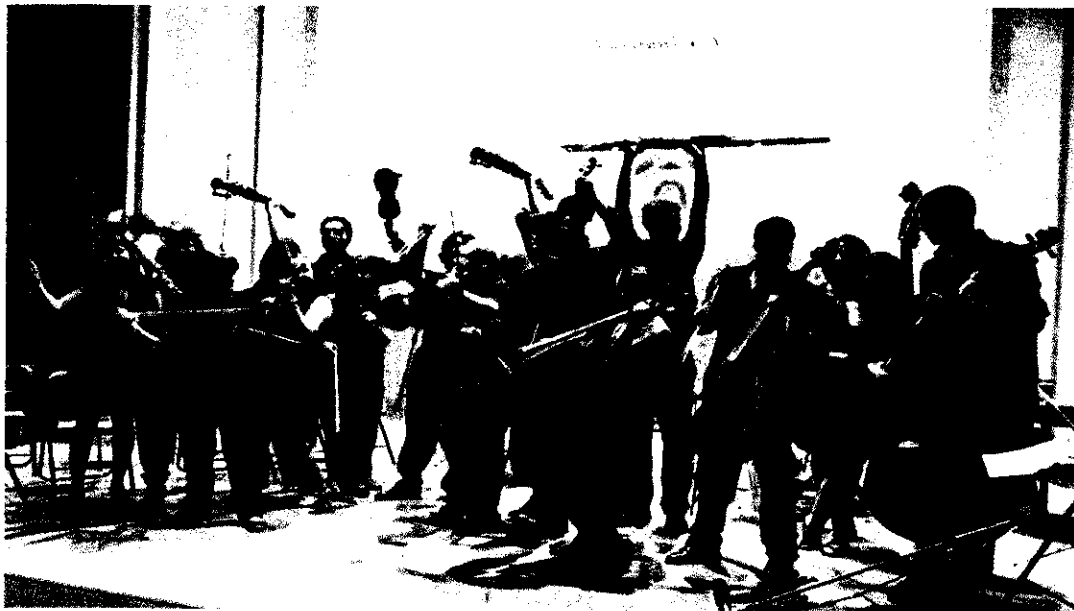
Ilustración No 4

Banda de jazz: formada tradicionalmente por instrumentos de viento, percusión, piano, guitarra y contrabajo.