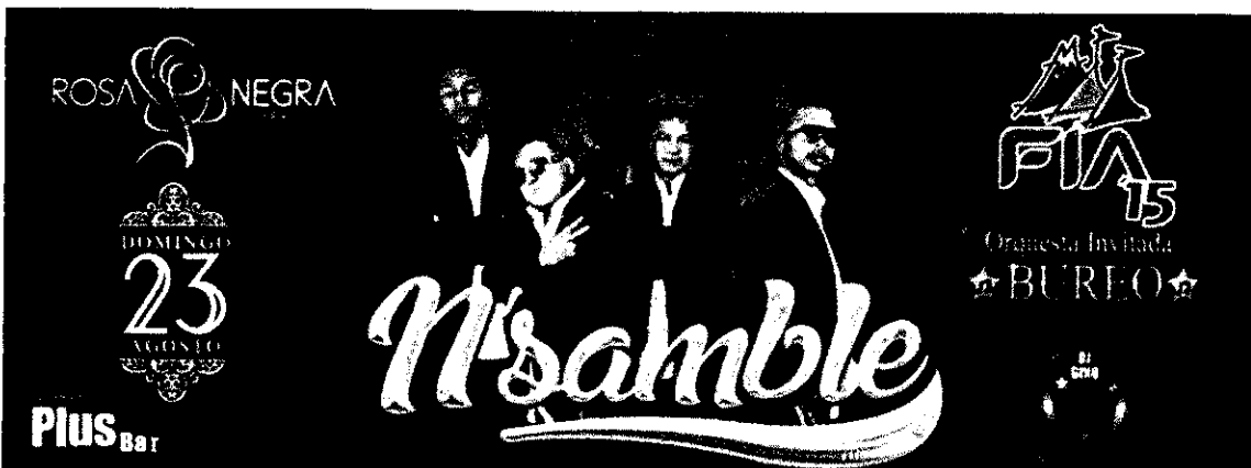
Ilustración No 3

Banda de música: agrupación musical formada por conjuntos de instrumentos de viento y percusión. Se diferencia de la orquesta sinfónica por la ausencia de los instrumentos de cuerda. Existen bandas militares, escolares y de bomberos. Si se incluyen cellos y contrabajos, se denomina banda sinfónica.