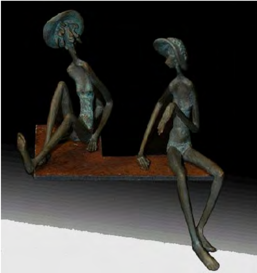
Verano I y II. Bronce 1/1. 0,25 x 0,8 x 0,16 m./ 0,16 x 0,7 x 0,22m. 2003