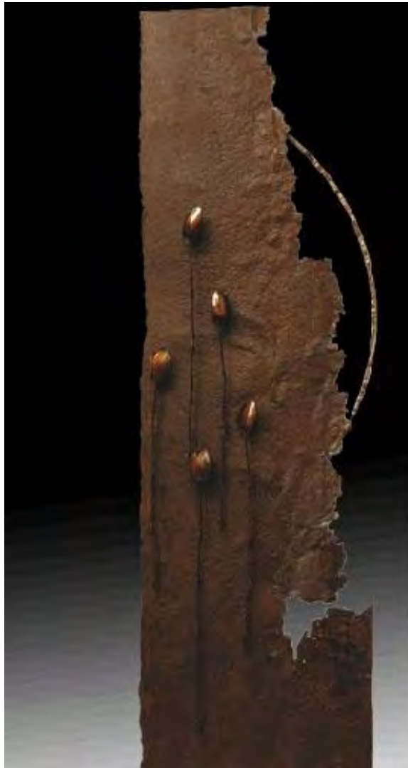
Amanecer. Hierro y níquel. 1,60 x 0,47 x 0,08 m.