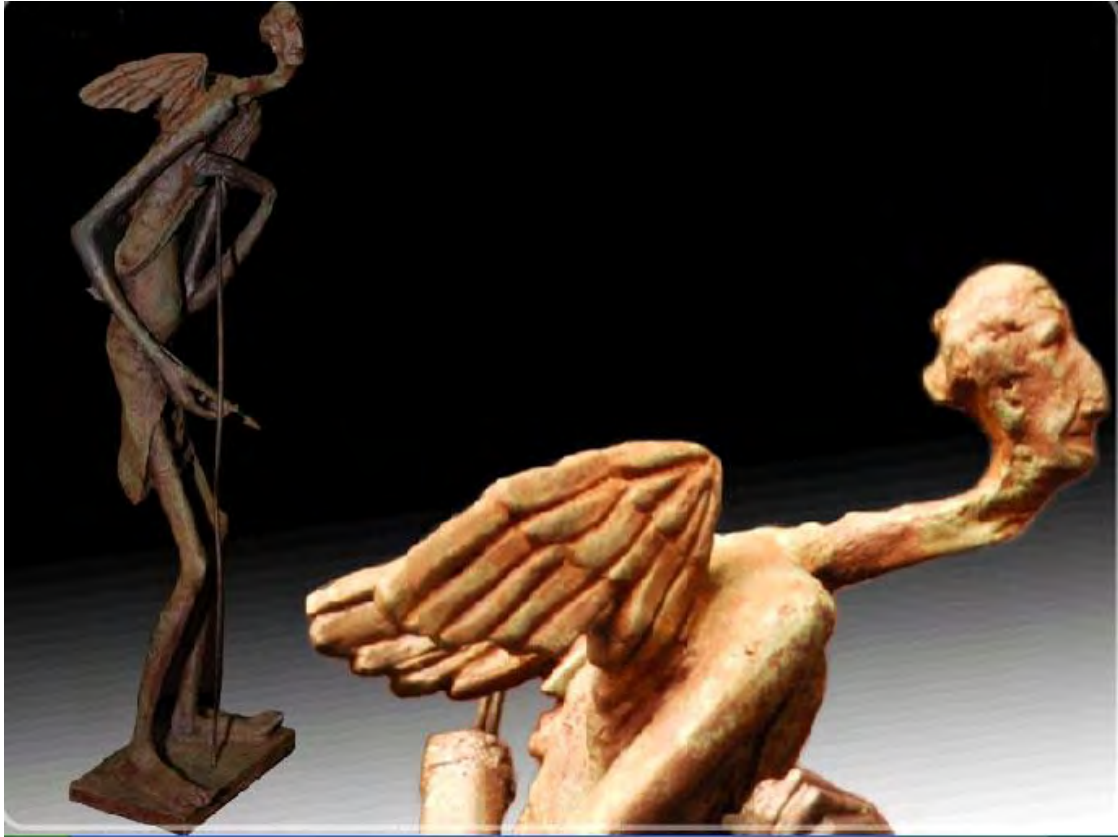
Eros. Bronce 1/1. 0,48 x 0,14 x 0,14 m. 2003