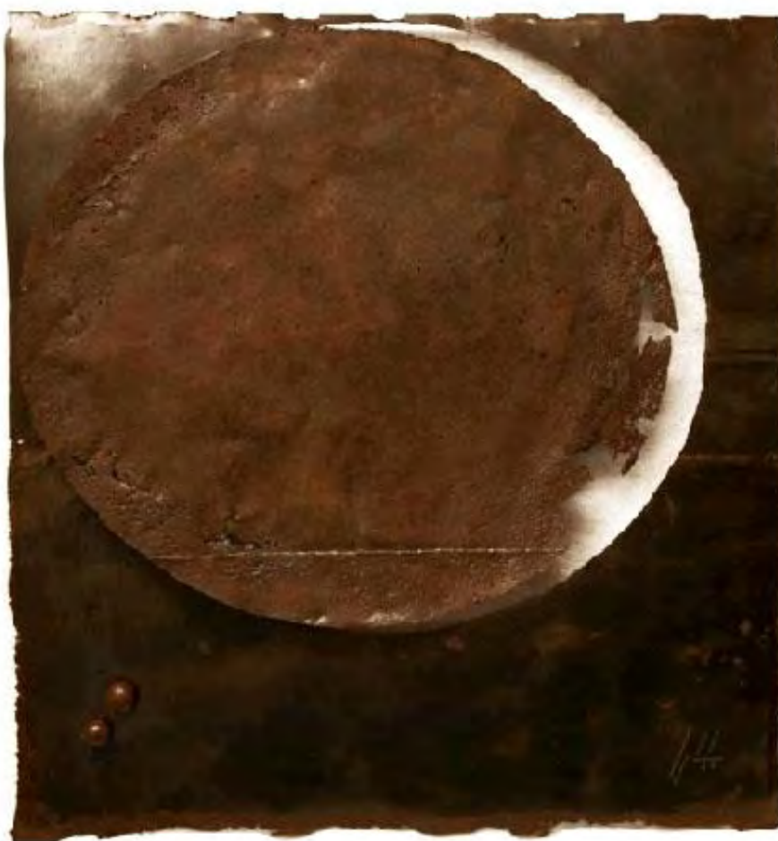
Entre el sol y la luna. Hierro 1/1. 1,45 x 1,65 x 1,12 m.