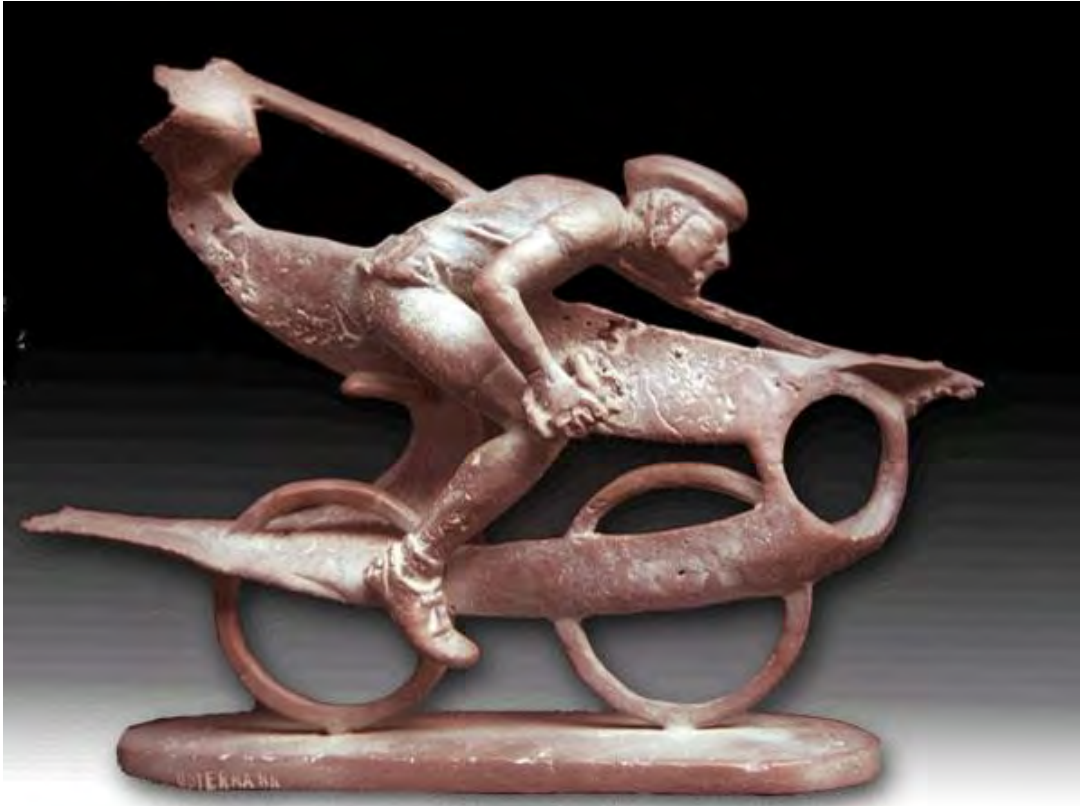
Premio "Mejor Ciclista 2001 -2002". Bolivia