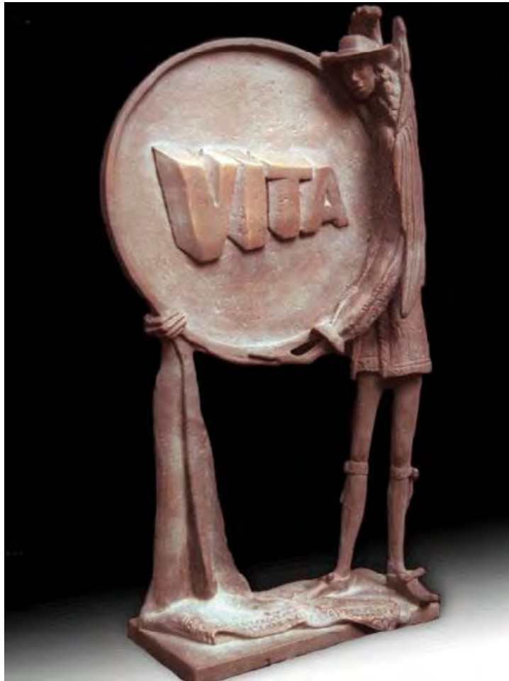
Industrias Farmacéuticas Bolivianas Vita. Bronce 1/1. 0,35 x 0,21 x 0,8 m.