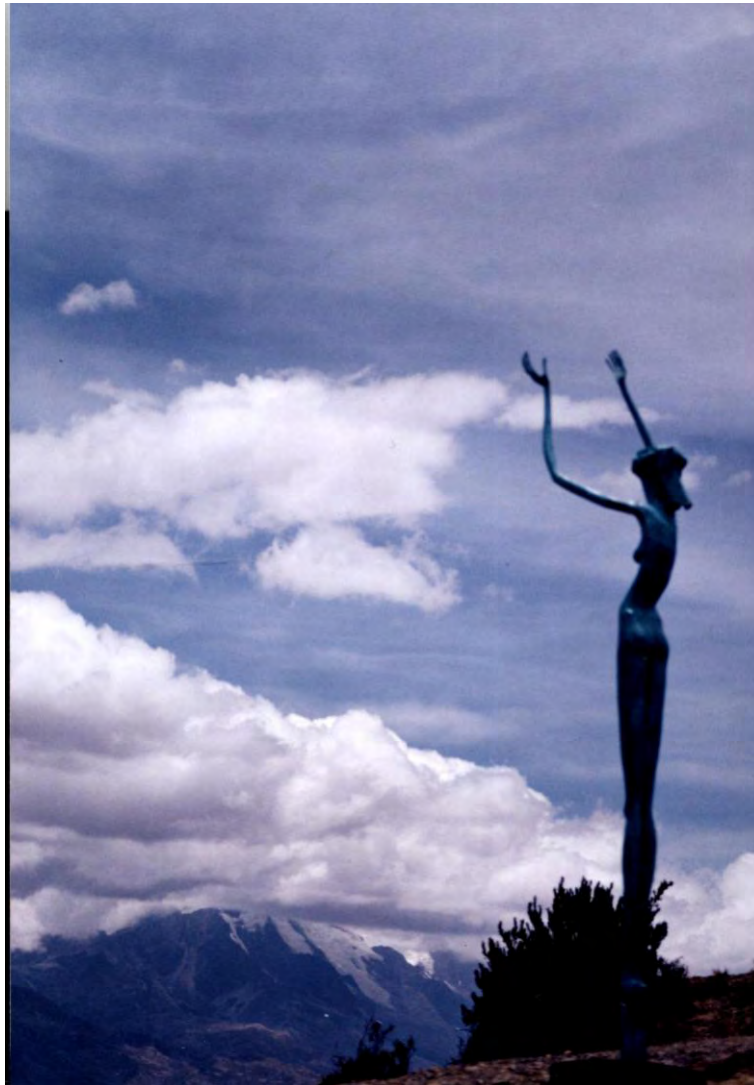
Churita. Bronce. 1998