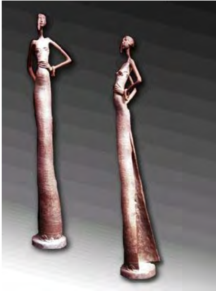
Noemí . Bronce 1/1. 0,51 x 0,11 x 0,06 m. 2003