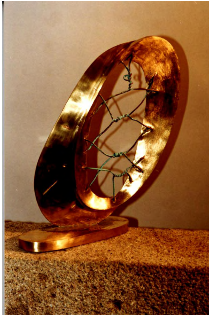
Rueda del tiempo. Bronce. 1998