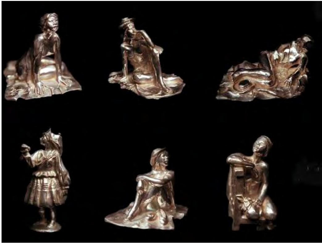
Miniaturas de plata.