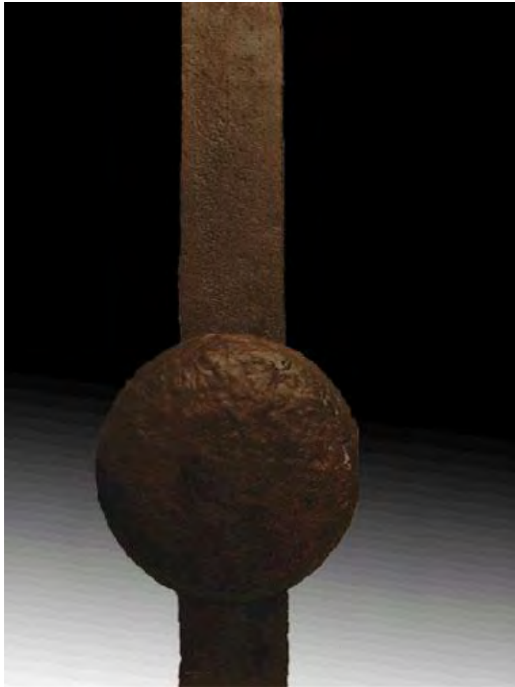
Tiempo. Hierro 1/1 1,63x 0,60 x0,10