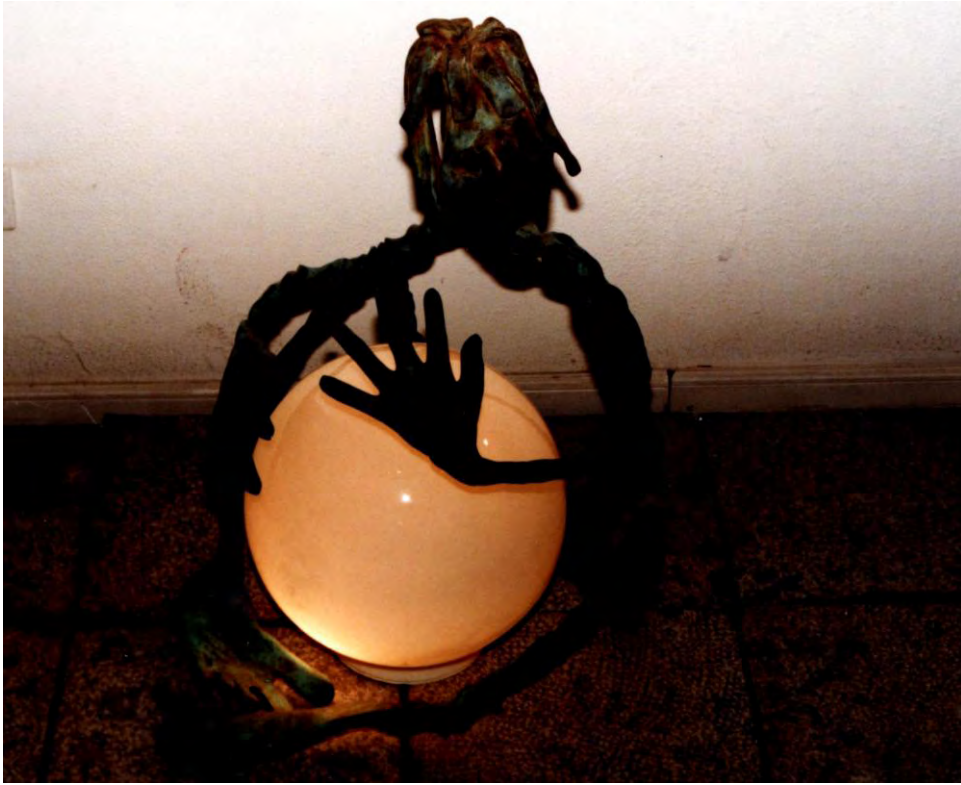
Marcel. Bronce. 1998