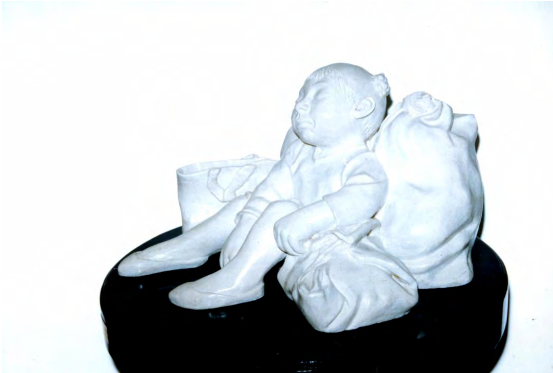
Unjaña. Mármol. (Vas a ver) 48 x72 cm. 1988