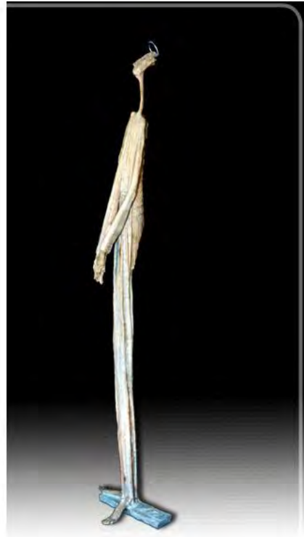
Santo Palomo. Bronce 1/1. 1,14 x 0,22 x 0,15 m. 2003