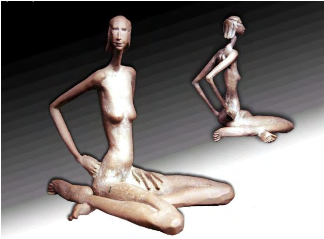
Dorotea. Bronce 1/1. 0,14 x 0,11 x 0,13 m. 2003