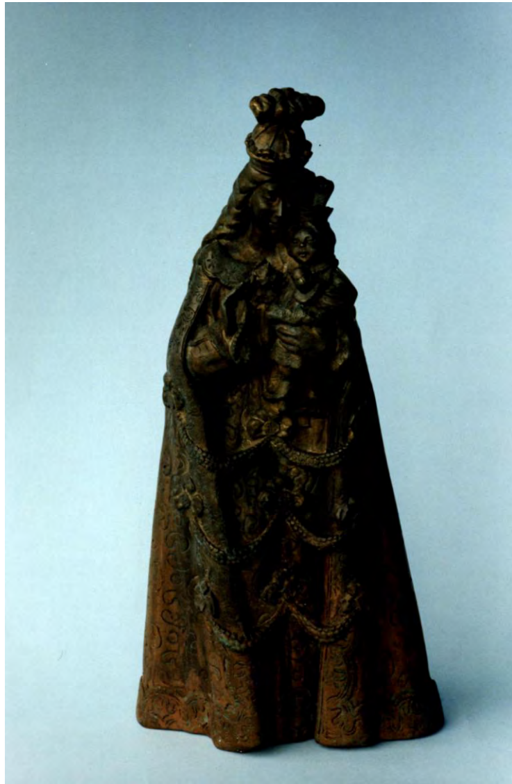
Virgen India. 32 x 15 x 10.5 cm. Bronce. 1998