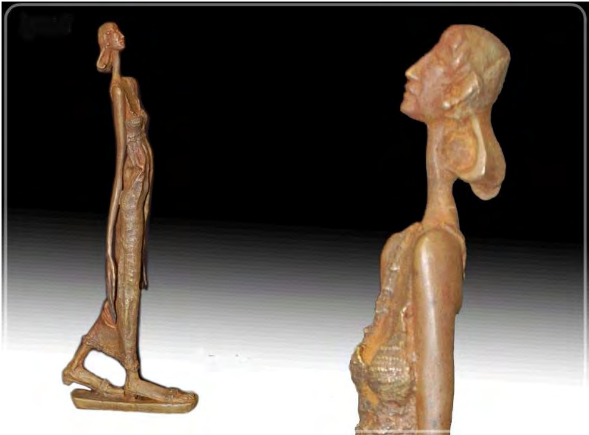
Samira. Bronce 1/1. 0,33 x 0,12 x 0,5 m. 2003