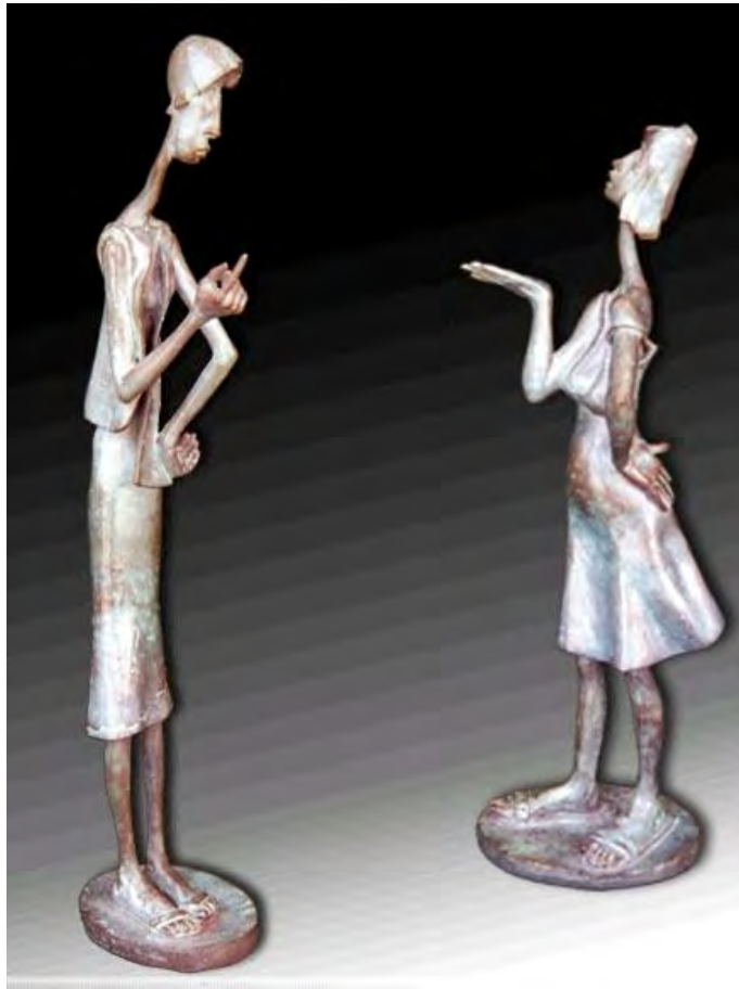
Rosita y Angelita. Bronce 1/1. 0,47 x 0,19 x 0,10/ 0,57 x 0,08 x 0,010 m. 2003