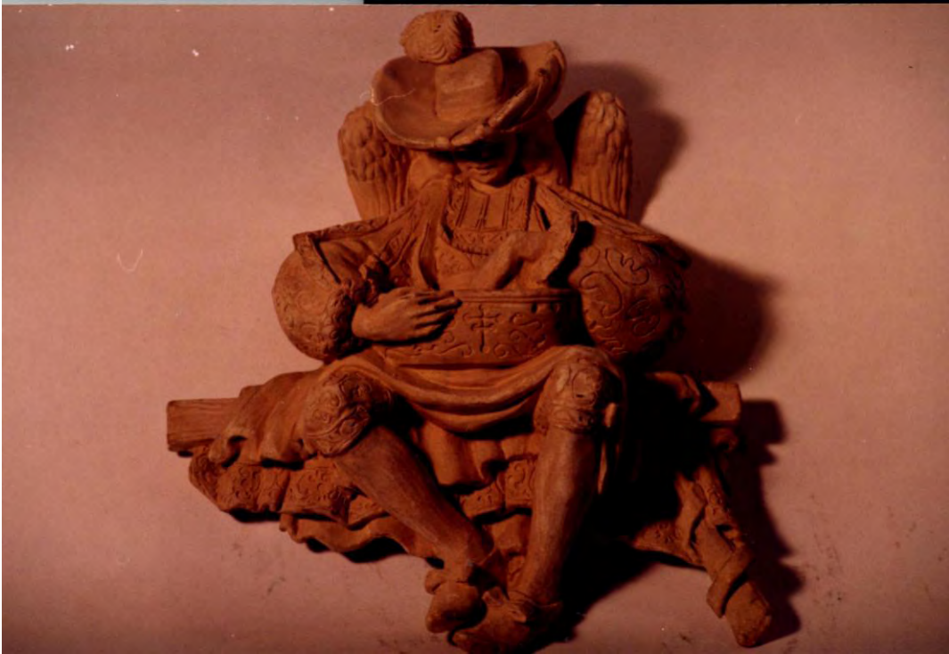
Bendito. Terracota. 1994