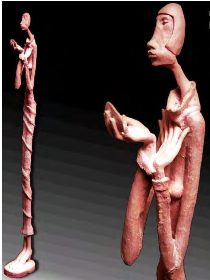
Coqueta . Bronce. 2003