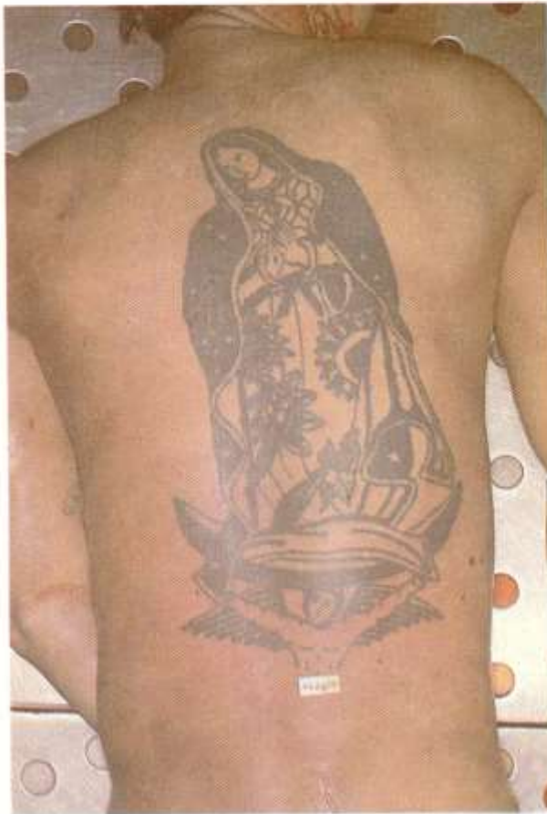
Fig. 5.6. Tatuajes. Los tatuajes también contribuyen a la caracterización del cadáver.