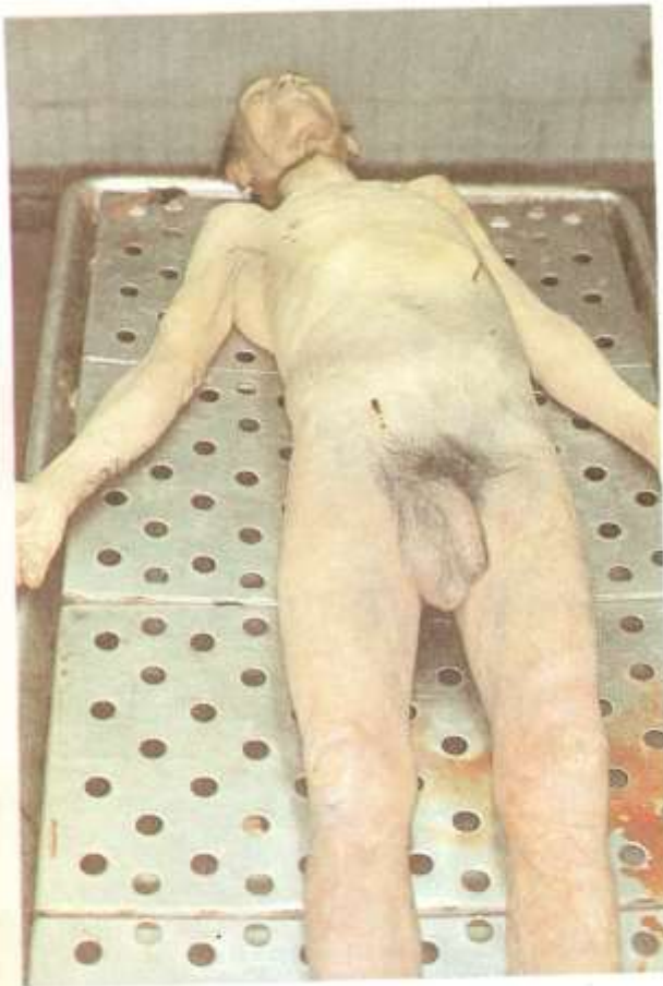
Fig. 2.5. Mancha verde abdominal. La mancha verde abdominal es un signo temprano de la putrefacción y resulta de la degradación química del contenido intestinal y de los propios tejidos de la cavidad y pared abdominales. Esta coloración se va haciendo extensiva a las regiones anexas y puede abarcar la totalidad del cuerpo.