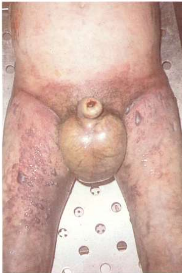
Fig. 2.3. Proceso de putrefacción. El proceso de putrefacción genera abundantes gases que se infiltran en todos los tejidos corporales. Obsérvese la distensión del abdomen y de los miembros inferiores, así como el gran enfisema escrotal y peneano.