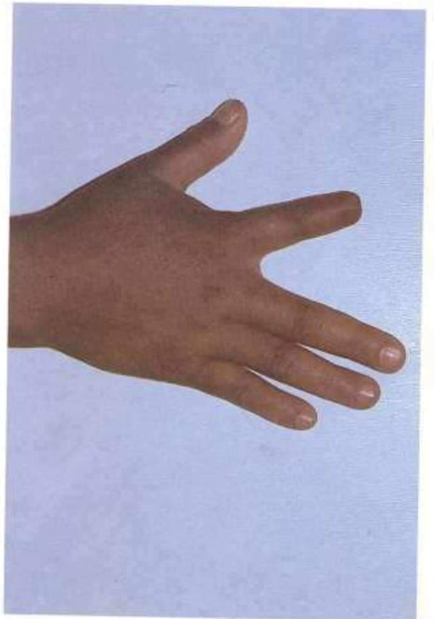
Fig. 5.4. Ausencia de porción corporal externa. En caso de descomposición avanzada del cadáver, resulta de gran valor la ausencia de alguna porción orgánica externa. Nótese la falta de la falange distal del dedo índice.