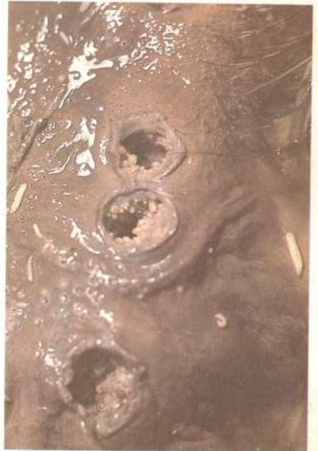
Fig. 2.12. Destrucción por larvas. Dichas larvas destruyen progresivamente a los diversos tejidos.