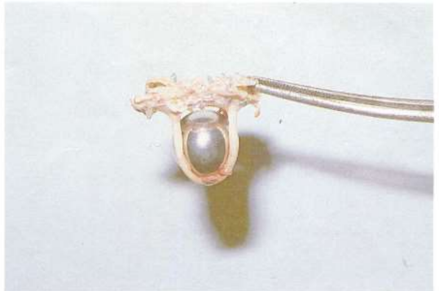
Fig. 5.7. Prótesis. Una prótesis valvular cardiaca puede apoyar notablemente la identificación.