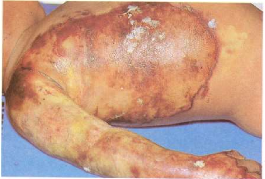
Fig. 8.1. Quemaduras de segundo grado producidas por flama. Además de la profundidad, es importante calcular el porcentaje de área corporal afectada, para normar el tratamiento y establecer un pronóstico. Las quemaduras por calor seco, ya sea por flama o por objetos sobrecalentados, producen eritema, ampollas, escaras y hasta carbonización.