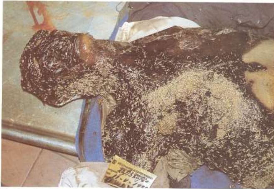
Fig. 2.11. Invasión por larvas. Dependiendo de la fauna del lugar en que haya quedado expuesto el cadáver, se desarrollarán en él larvas de insectos que lo invaden totalmente.