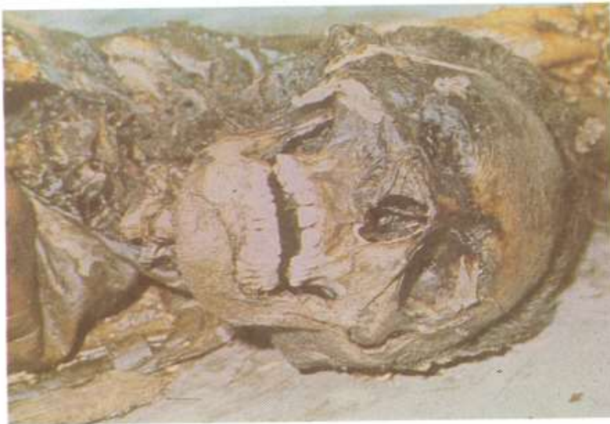
Fig. 5.17. Reconstrucción de la fisonomía del individuo. Ante la pérdida de tejidos, además de lo antes mencionado, se puede intentar una reconstrucción de la fisonomía del sujeto.