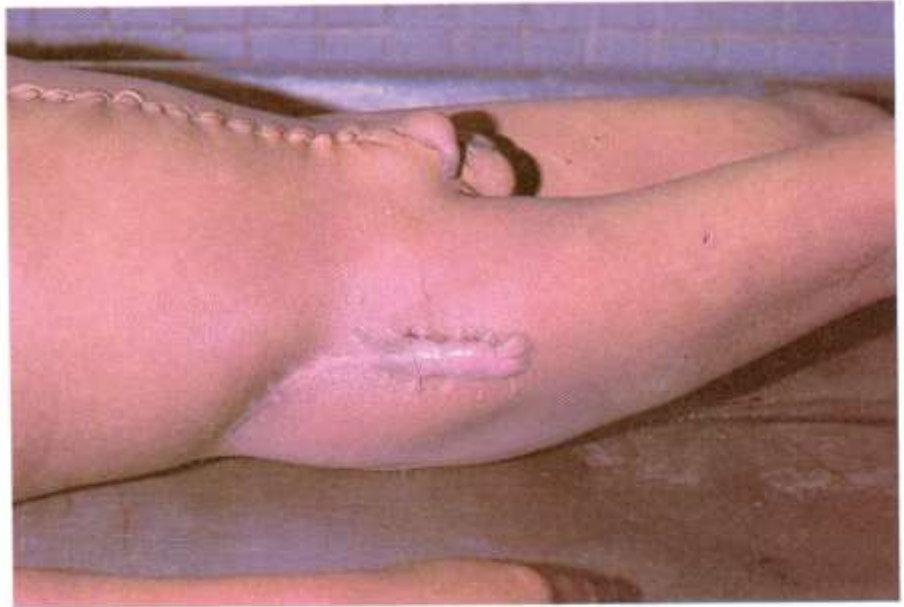
Fig. 5.5. Cicatrices. Las cicatrices adquieren importancia por su localización y características, como en este caso en que se trata de una cicatriz quirúrgica que loide, a la altura de la cadera derecha.