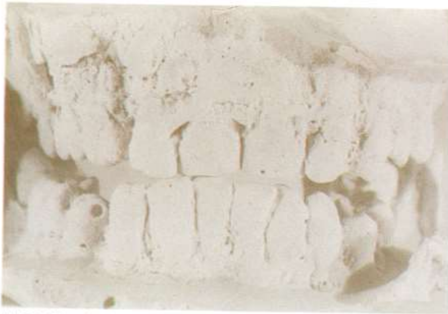
Fig. 5.9. Obtención de molde. Además de la observación directa de la dentadura, pueden obtenerse moldes que permitan mayor objetividad en las descripciones.