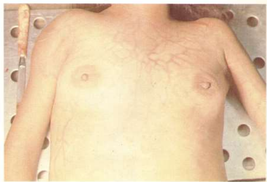
Fig. 2.4. Red venosa póstuma. Los gases de la putrefacción desplazan a la sangre intravascular hacia la periferia y resulta evidente la red venosa subcutánea.