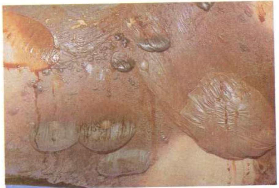
Fig. 2.6. Bulas por putrefacción. Al infiltrarse los gases en la piel se producen flictenas y bulas, algunas de las cuales se llenan con sangre negra que proviene de la rotura de pequeños vasos.