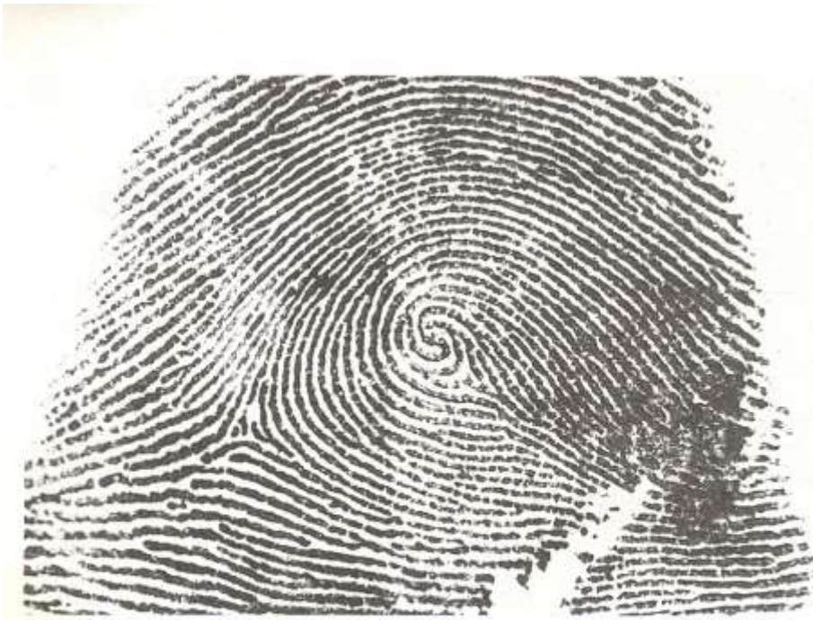
Fig. 5.1. Huella dactilar. Las huellas dactilares constituyen un elemento de primer orden para lograr la identificación de un cadáver. Por desgracia, no siempre se pueden obtener o no hay registros previos para confrontarlas.