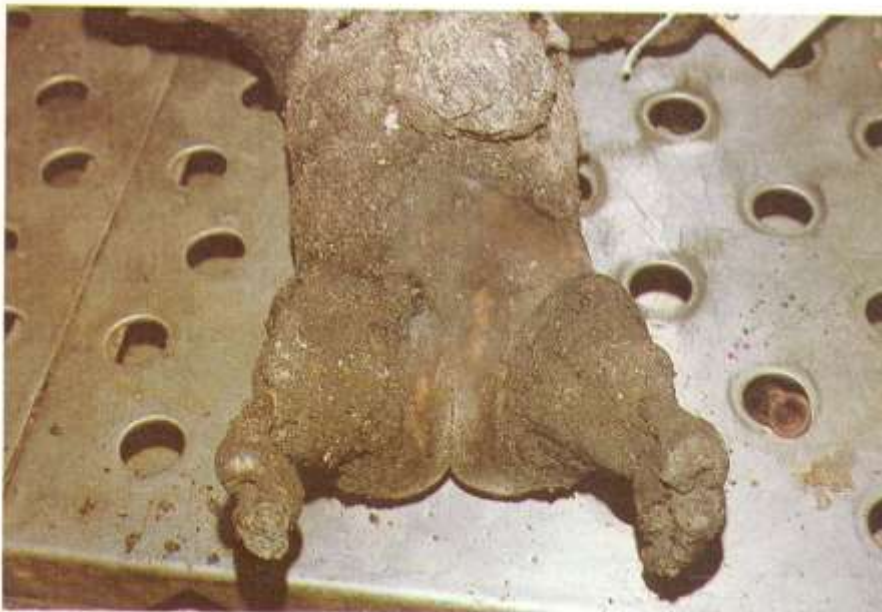
Fig. 8.2. Carbonización. La acción intensa y sostenida del fuego conduce a la carbonización de los tejidos.