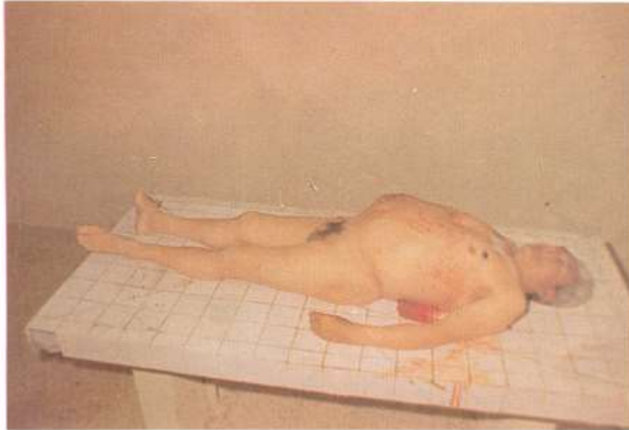
Fig. 1.7. Estudio del cadáver. El examen externo del cadáver se inicia en el lugar de los hechos y se completa en un recinto bien iluminado. Se reportarán los signos cadavéricos para calcular el tiempo transcurrido desde el fallecimiento.