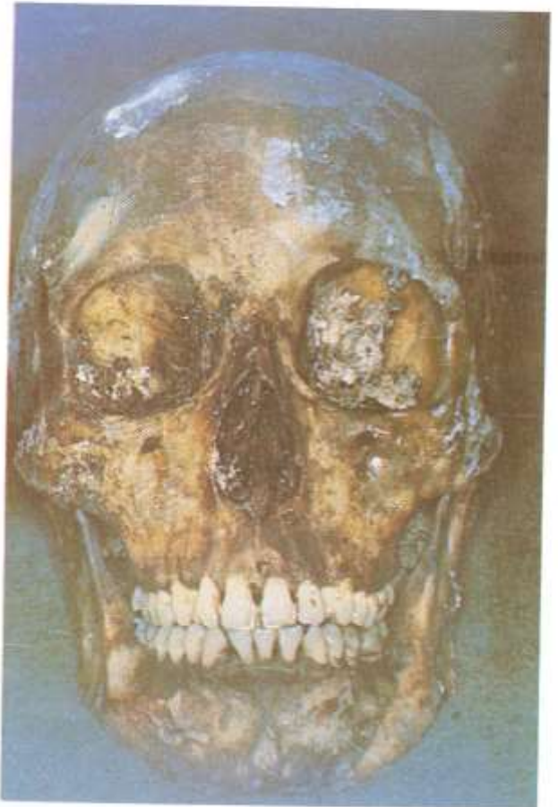
Fig. 5.10. Pérdida de tejidos blandos. Cuando se han perdido los tejidos blandos, la dentadura ofrece grandes posibilidades para la identificación. Véanse los fillos de oro en los incisivos superiores centrales.