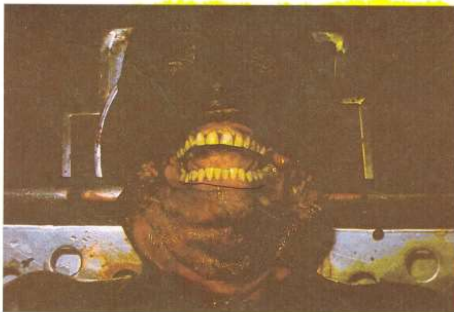
Fig. 5.8. Dentadura. La dentadura resiste a la acción del fuego, como en este caso, en que el fuego calcinó piel y planos subyacentes. Por ello, el estudio de la dentadura es de gran utilidad.