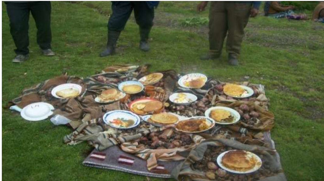
WAYK'ASI El banquete de la comunidad, en el protocolo de diferentes actividades