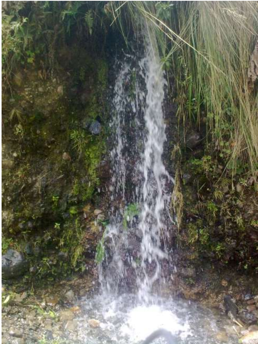
Una hermosa cascada en la comunidad Marcamarcani