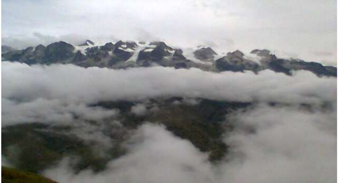
El nevado Illampu con el manto de la nube