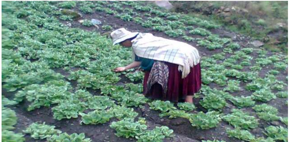
Una mujer verificando papaliza en surco