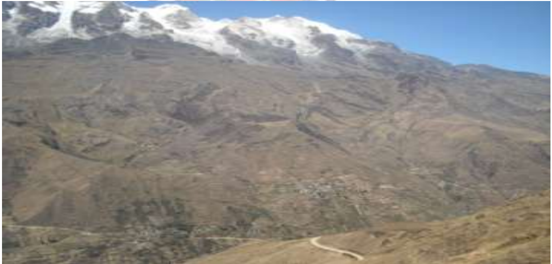
Ubicación de la comunidad Marcamarcani a los pies del Illampu