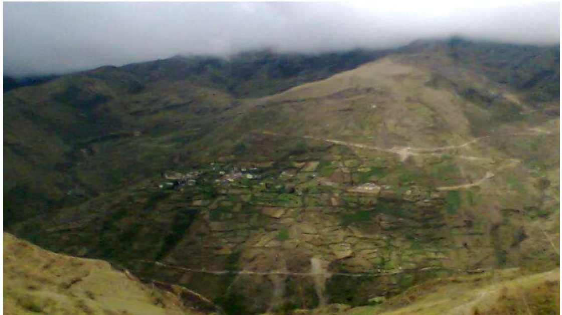
Comunidad Marcamarcani en tiempo de lluvia