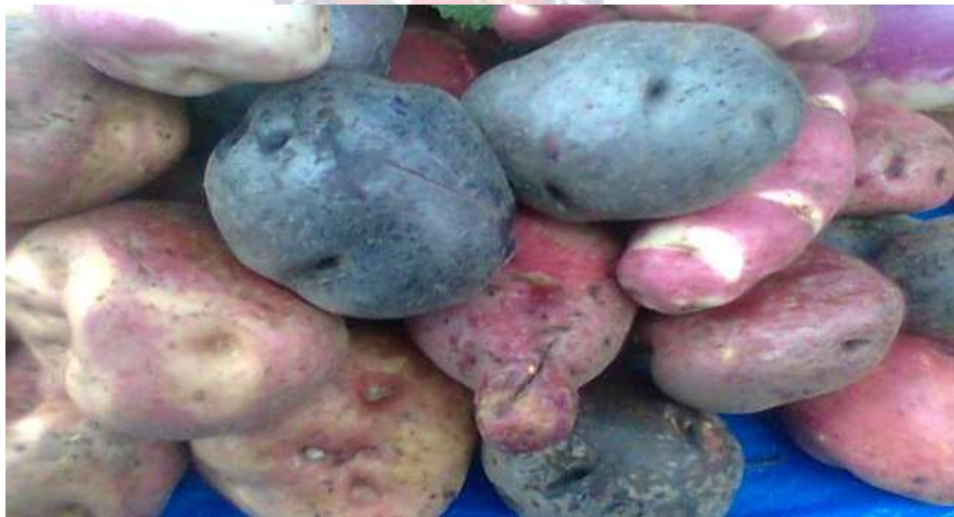
Papa de diferentes variedades