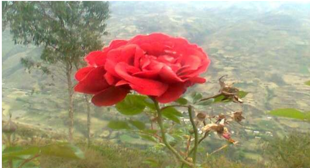
Una hermosa rosa en la naturaleza de la comunidad