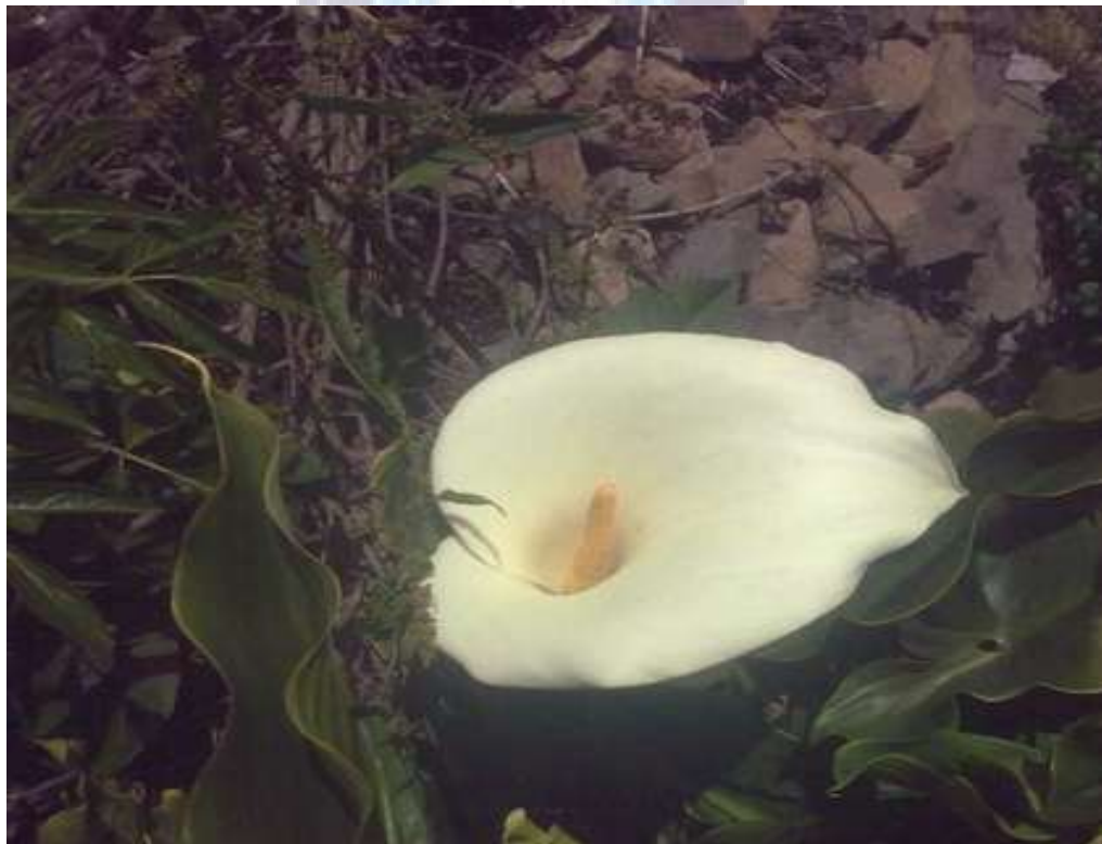
Una flor llamada cartucho