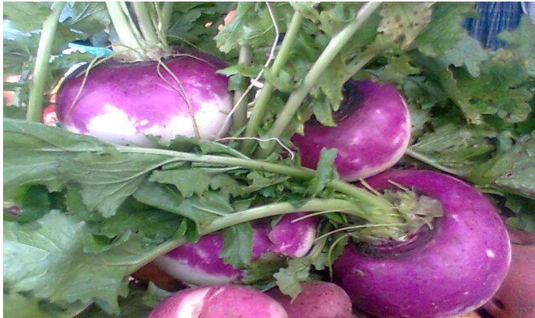
Nabo “revolución verde” en la comunidad Marca marcaní