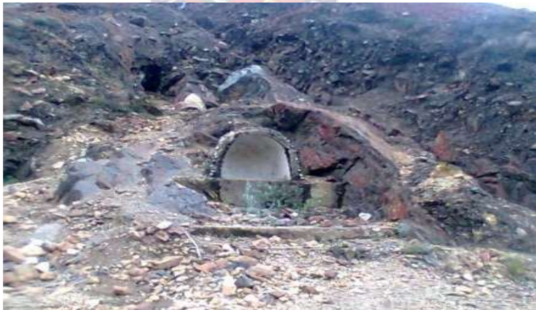
Zona aurífera en los tiempos de la colonia