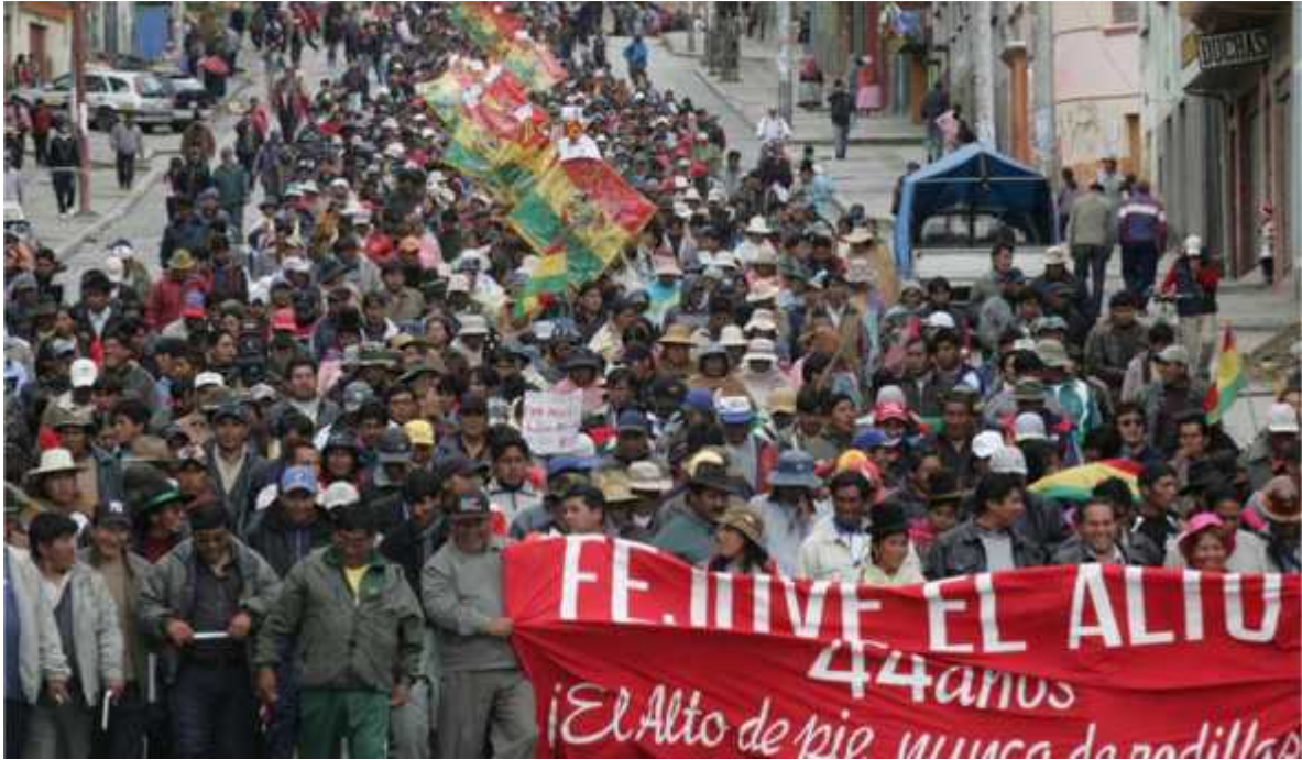
Organización de la Federación de Juntas Vecinales, momentos de Marcha