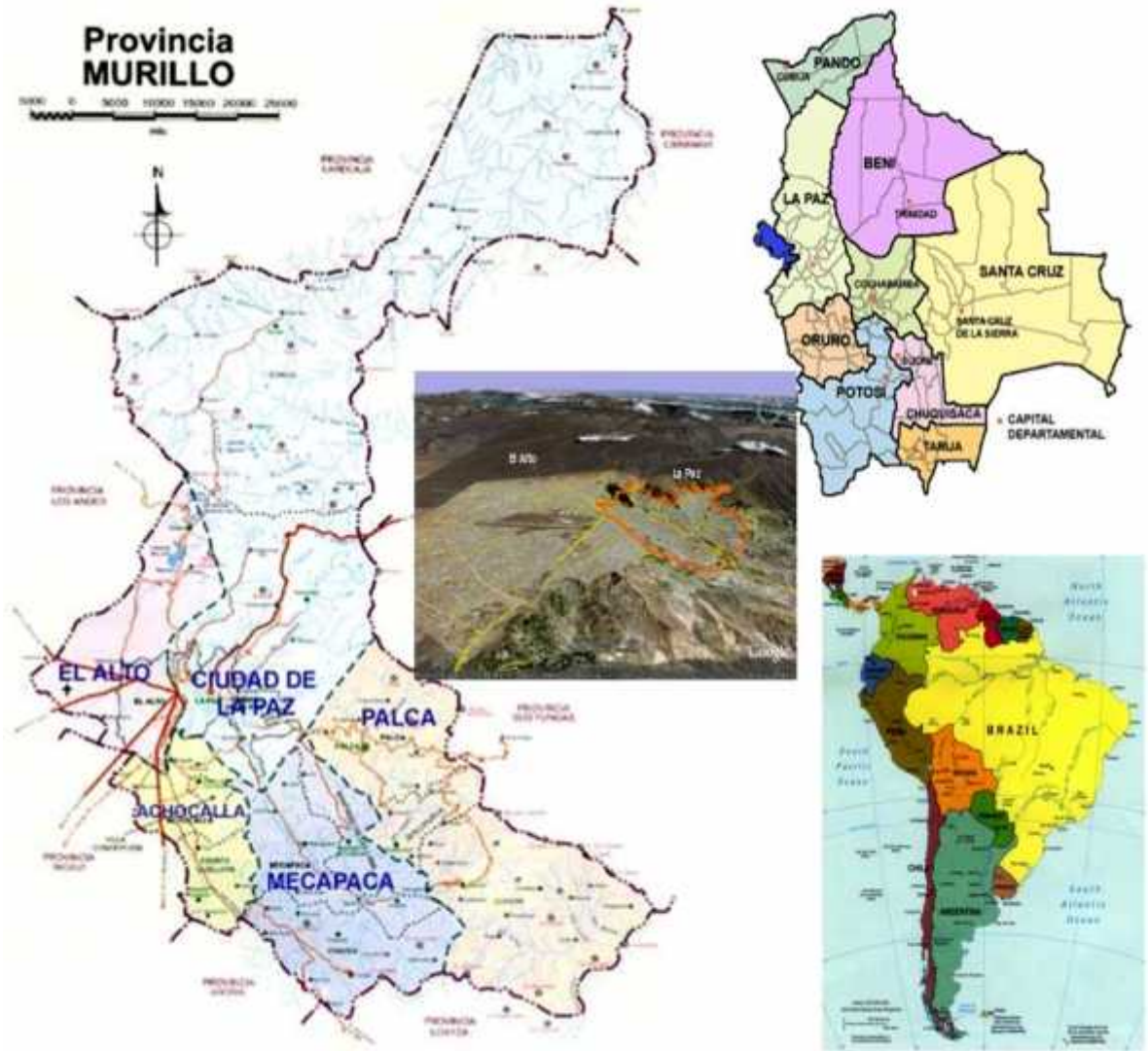
Mapa 1. Ubicación territorial de El Alto y la ciudad de La Paz