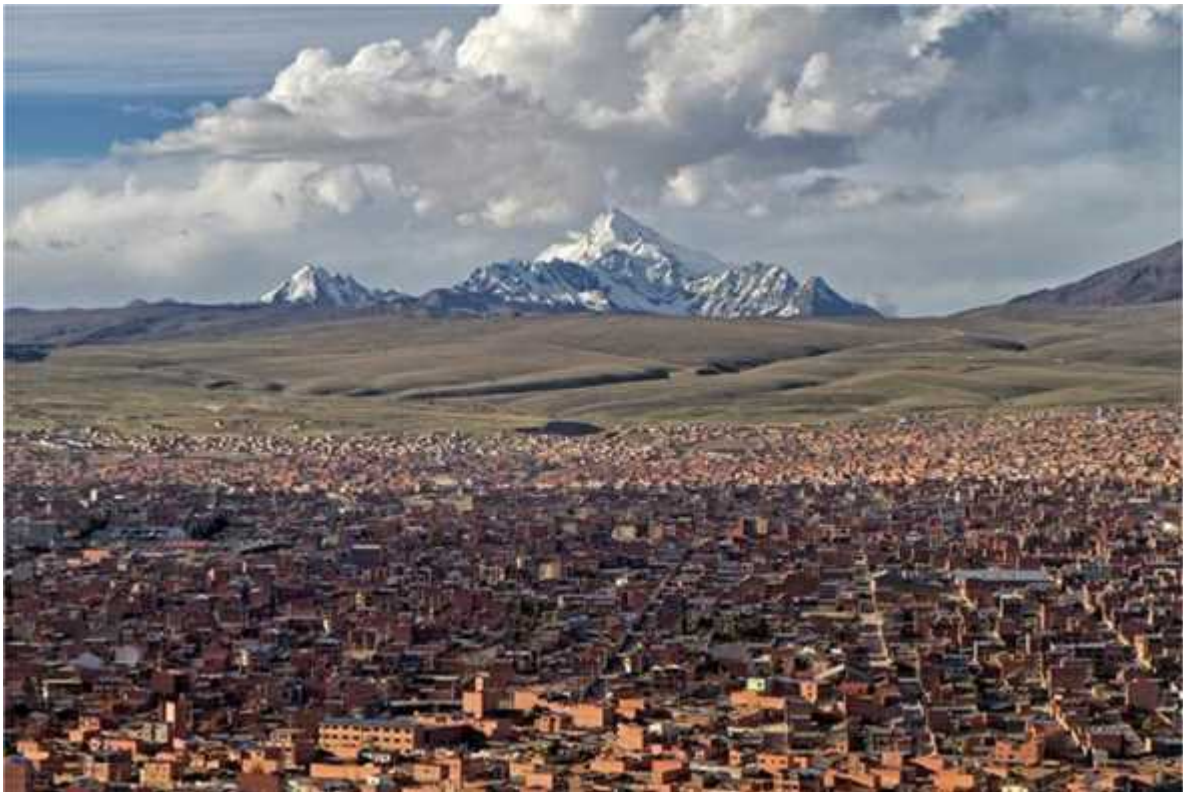
El Alto, vista de la Cordillera