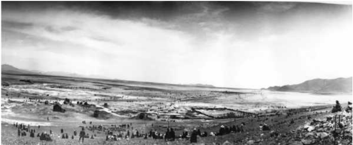
El Alto a principios del siglo XX