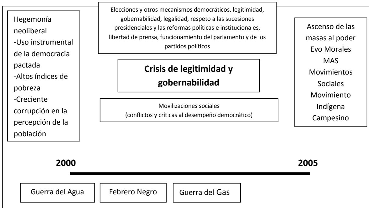
CUADRO N° 2: Modelo explicativo (periodo 2000-2005)