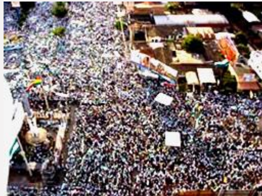
Vista aérea de la multitudinaria concentración en torno al monumento al Cristo Redentor.

La propuesta también alcanza a los gobiernos departamentales que deberán tener competencias compartidas con el gobierno central y los municipales sobre la tenencia y la propiedad de la tierra, así como la protección, conservación, uso sostenible, distribución y redistribución.