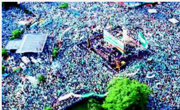
Multitudinaria concentración al pie del Cristo Redentor de la capital cruceña pide respeto a los dos tercios y las autonomías departamentales. El cabildo terminó en una inédita fiesta democrática.

En encendidos discursos, las autoridades departamentales de la “media luna” le rayaron la cancha al gobierno del presidente Evo Morales, al lanzar una severa advertencia de desconocimiento a la nueva Carta Magna y dotarse de un estatuto autonómico, en caso de que no se diera lugar al voto de dos tercios en la Asamblea.