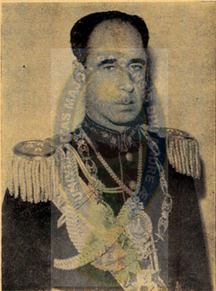
General ALFREDO OVANDO CANDIA