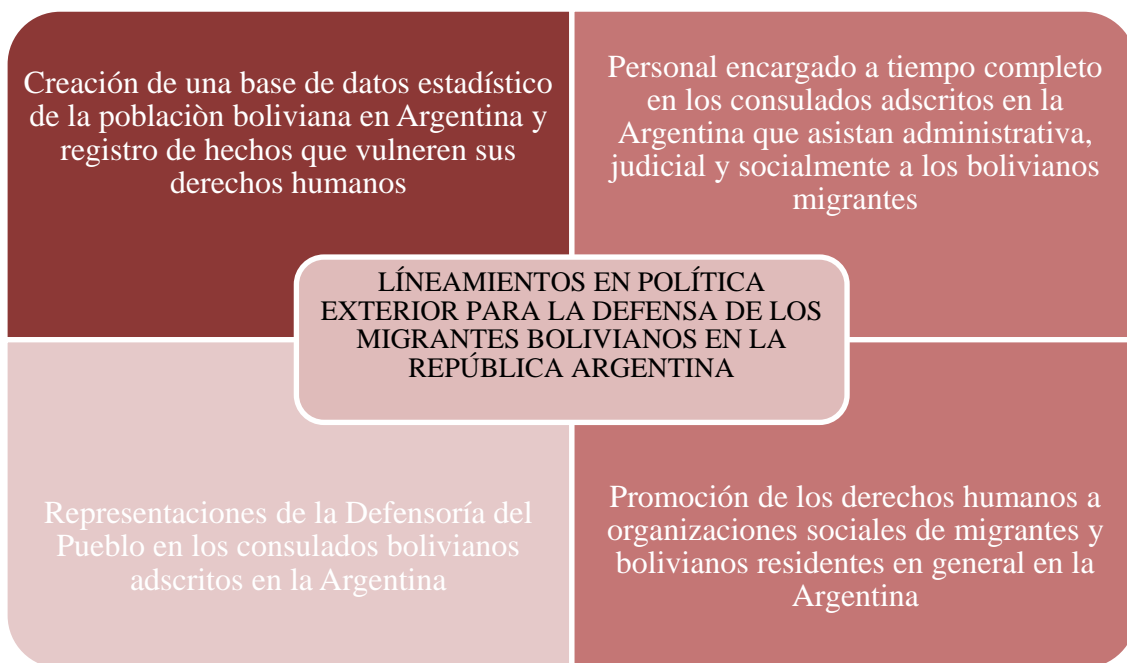
Matriz de la propuesta