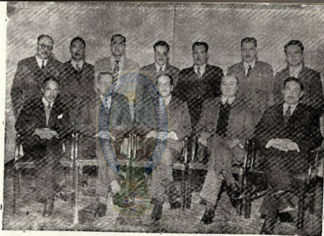
EL VICE PRESIDENTE DEL GOBIERNO DE LA REVOLUCION Dr. HERNAN SILES ZUAZO ENCABEZA LA COMISION DE LA REFORMA AGRARIA