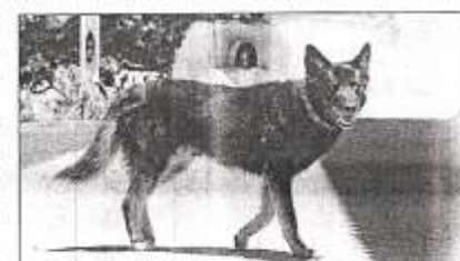
TRABAJADOR Y FIEL

Actualmente, no existe un perro que tenga el