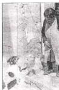
TRAGÓN Y FINO

El grande come hartito, el chiquito es más fino. Los dos tienen pelota, pero juegan bastante con las wawas. En la noche son buenos cuidadores."