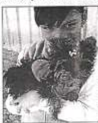
MIMADO Y RENEGÓN

Sol es como un bebé, muerde todo y hay que ver qué es lo que pone en