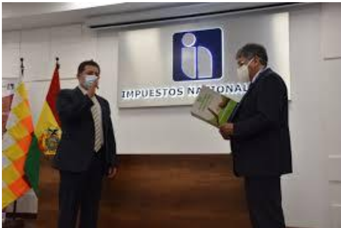
Posesión del nuevo presidente del Servicio de Impuestos Nacionales el Sr. Alfredo Troche Machicado