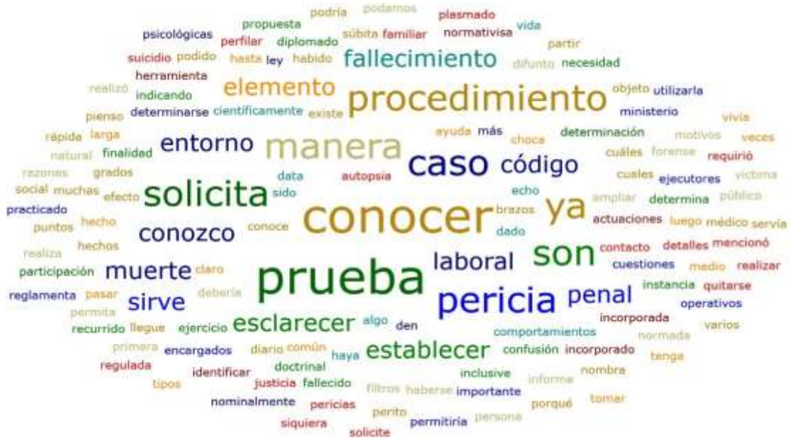
Gráfico 6 Resultados Generales Entrevistas Fiscales de Materia Penal La Paz