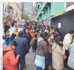
FILA Y DESINFORMACIÓN EN PUERTAS DEL CENTRICO LICEO LA PAZ, FUE AYER, DURANTE EL PRIMER DÍA DE INSCRIPCIÓN ESCOLAR.

Inf. Pág. 3, 1er. Cuerpo y 3, 3er. Cuerpo