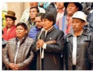
EVO MORALES EN EL MOMENTO QUE REALIZABA EL ANUNCIO, JUNTO A DIRIGENTES DE CONALCAM.

Pese a que el presidente del Estado, Evo Morales, anunció ayer que habrá 12 meses para socializar el Código Penal, las medidas de presión continuarán en todos los departamentos, porque varios sectores exigen la abrogación de la ley.