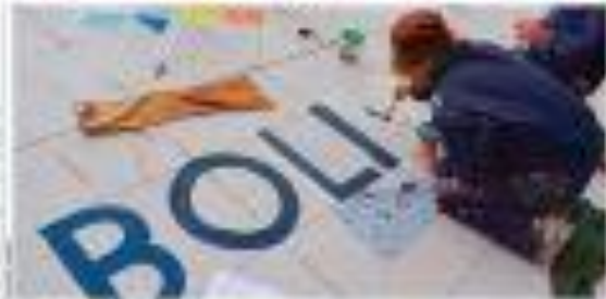
Apoyan, promueven la recuperación del Dólar

05:17 Edición regular Deficiencia comercial de $us 1.127 MM Una encuesta sobre el comercio exterior de Bolivia, realizada por el Banco Mundial, revela que el país sufre de una deficiencia comercial de $us 1.127 millones en el primer trimestre de este año. Este déficit se debe principalmente a la caída de las exportaciones de materias primas y productos agrícolas, así como a un aumento de las importaciones de bienes de capital y tecnología.