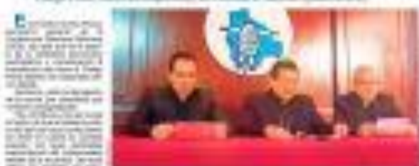
Presentaron primer de película "Aosora"