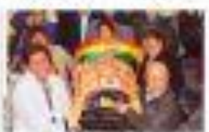
El presidente Evo Morales anunció que el gobierno boliviano ha examinado una lista de países que podrían afectar la integridad territorial y la soberanía del país.

• "Se trata de un debate que se debe hacer en el ámbito de la participación ciudadana, de la consulta popular y del diálogo social." • El Consejo de Iglesia Católica plantea que los cambios que se están haciendo en el Código Penal afectan a la moral y a la dignidad humana.