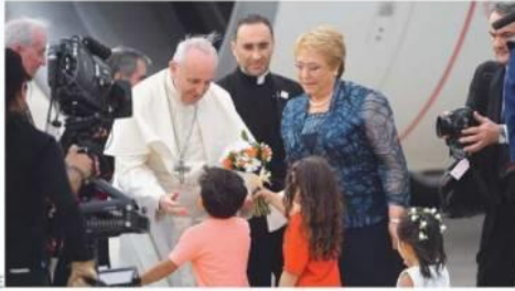
PRIMERA MANDATARIA CHILENA MICHELLE BACHELET Y NIÑOS LE DAN LA BIENVENIDA AL PAPA FRANCISCO. FUE AYER EN SU ARRIBO A SANTIAGO.