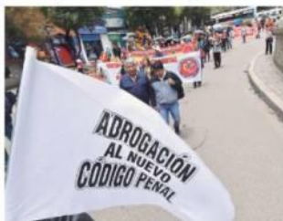
MARCHA PARA LA ABROGACIÓN DEL CÓDIGO PENAL.

• Cívicos del país, la Central Obrera Boliviana (COB) y otros sectores sociales del país pretenden unificar criterios y realizar un solo movimiento en contra de la vigencia del nuevo Código Penal