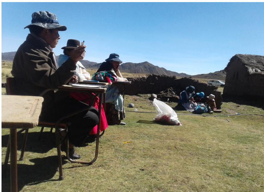
Participantes del CAS de la comunidad de Qorpa Pampa en las clases de tejidos