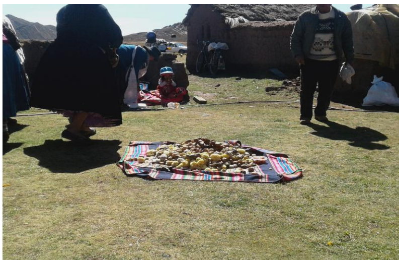
Aptapi de la comunidad Qorpa Pampa después de las primeras horas de clases