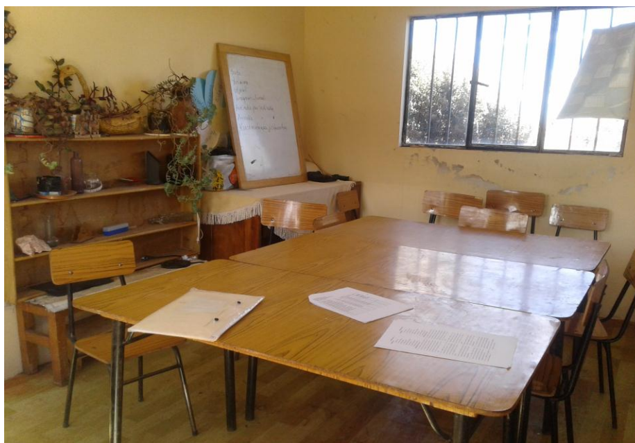
Sala de reunión del cas, donde realizan las reuniones con las diferentes autoridades.