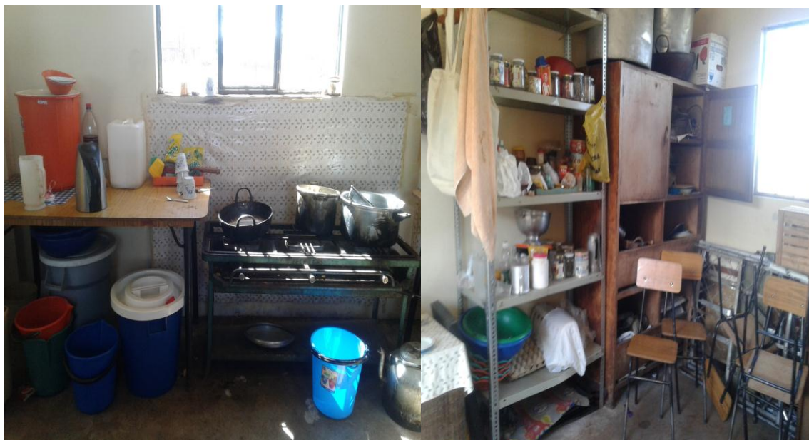
Cocina del CAS donde pasan las clases de soberanía alimenticia (repostería, alimentación)